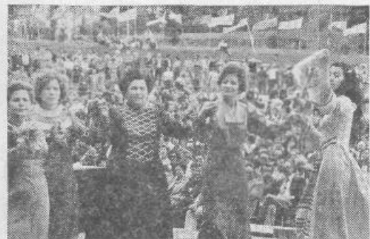
Folklorna skupina iz Kavadarcev

• V krajšem, a izredno dobro izvedenem kulturnem programu so sodelovali