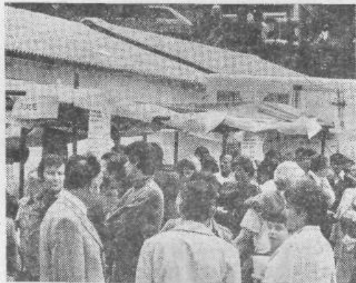
Za lačne želodce so poskrbeli gostinci

• Proslavljanje se je nato nadaljevalo ob domiselno urejenih površinah ob Sori ob dobro založenih stojnicah, ob katerih ste lahko dobili vse, kar se ob takem praznovanju spodobi. In ob tem velja poudariti,