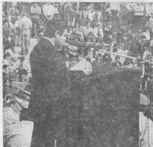
Delegatom je spregovoril Milan Kučan

• Po slavnostnem govoru predsednika Skupščine SR Slovenije Milana Kučana — nekaj njegovih najpomembnejših misli objavljamo v posebnem prispevku — je pred-