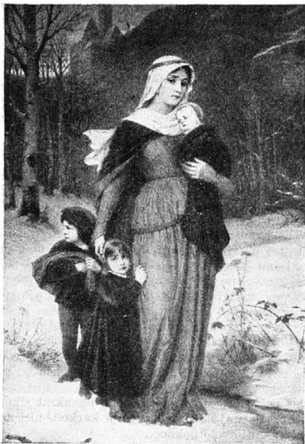
Sv. Elizabeta, turingijska kneginja, zapušća grad Wartburg.