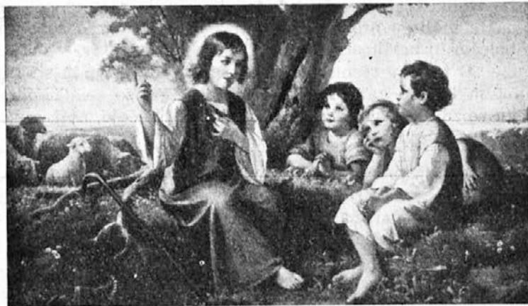
Mali Jezus razlaga Lučkarjem večne resnice.