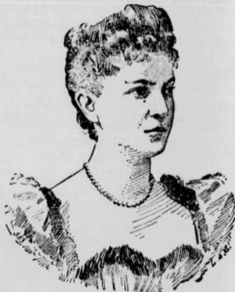
† Draga Mašin, kraljica srbska.

Vzrokov za ta krvavi dogodek je bilo, kot smo omenili več, vendar pa bi se morda preobrat še ne bil izvršil tako naglo, da si ni kralj s svojim posto-