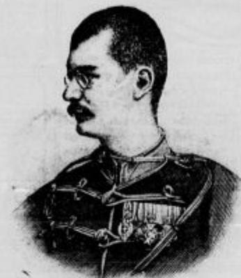
† Aleksander Obrenović, kralj srbski.

V sredo okolo enajste ure ponoči naznanil je strel iz topa, da je prišel trenutek, v katerem naj