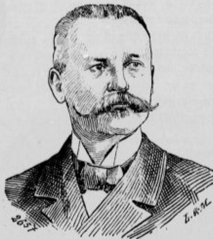
Peter I. Karagjorgjević novi srbski kralj.

Mož, v čegar prid se je izvršil grozni čin, novi proglašeni kralj Peter Karagjorgjević trdovratno taji, da bi bil on sploh kaj