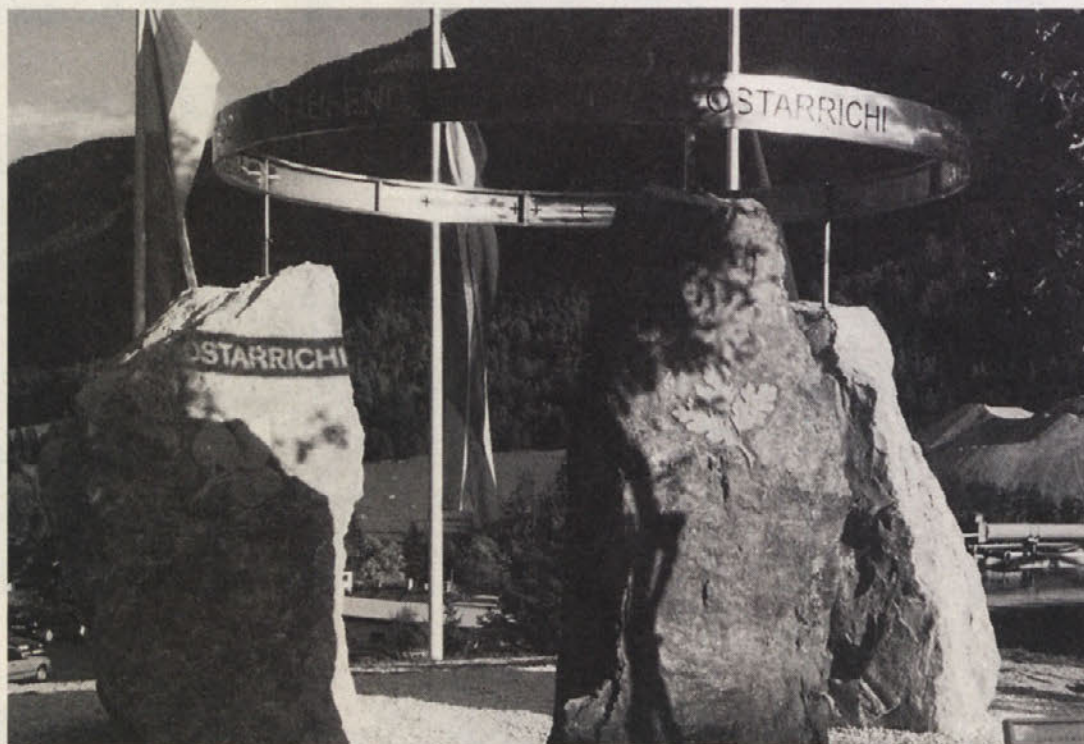
Ko je sonce nizko stalo na nebu, se je Ostarrichi zrcalil na enem od kamnov spomenika