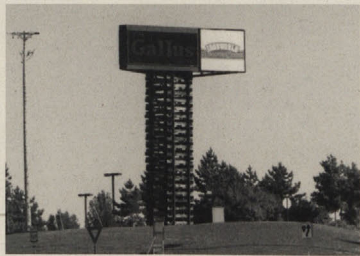
Takole na veliko je bil napovedan koncert zbora Gallus

NAVPIČNO: 1. VADUZ 2. ANOMALIJA 3. RD 4. ŠOLNINA 5. ARI 6. VAZA 7. KANU 8. IVA 9. JI 10. ENAKA 11. VALESA 13. LONDON 16. BIK 19. ETOS 21. TLORIS 23. ČER 25. GLAVA 28. SKOP 29. RIM 30. AR 31. ARA 33. ED 35. AČ