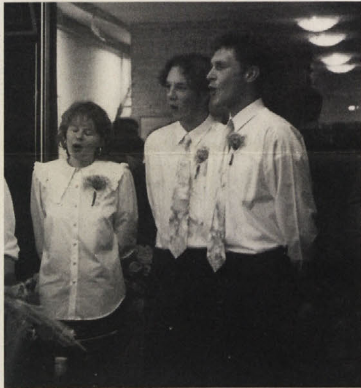
Z Rečice so prišli tudi pevci in pevke s slovenskimi narodnimi pesmimi