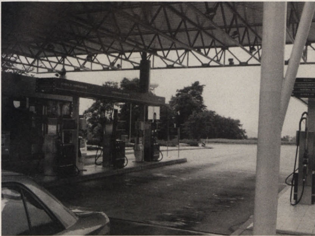
Zapuščena črpalka sanja o boljših časih

Na črpalki-dvojčici v Trziču, kjer se je druge barti kar trlo avtomobilov s koroškimi in drugimi avstrijskimi registracijami, je pretekli četrtek opoldne bilo vse tiho in mirno. Le par Gorenjcev je pripeljalo napajati svoja žejna vozila, črpalkarji pa so končno našli čas za zalivanje rož okoli »bencinske pumpe«. Od zruška v predoru je na tej črpalki promet padel za 70 odstotkov, ker ni zmanjkalo le