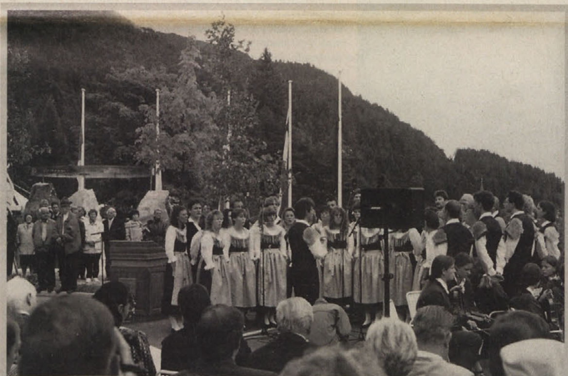
Na praznovanju tisočletnice prvega imenovanja Avstrije je sodeloval tudi MePZ Danica.