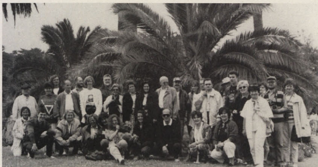
Gallusovi pevci v Los Angelesu

Po prečkanju S-ameriškega kontinenta od V proti Z se je