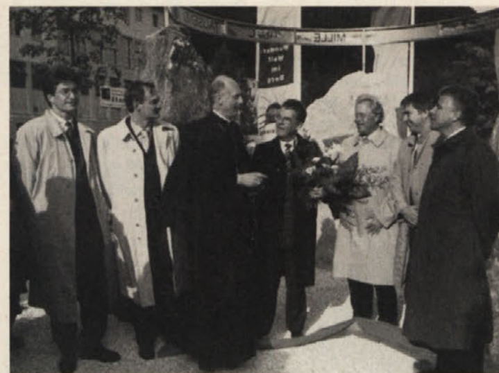
Rajda častnih gostov pred kamnitim spomenikom milenija