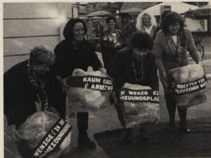
Ministrice Helga Konrad pri dviganju »kamna spotike«

Socialdemokratske žene, na čelu ministrice Helga Konrad in predsednica koroških socialdemokratskih žena Melitta Trunk, sta v okviru cestne akcije na Novem trgu opozorile javnost, da morajo žene odstraniti še številne »kamne spotike« na poti do dejanske enakopravnosti žensk v Evropi. Ministrice Konrad je napovedala, da se bodo žene še naprej aktivno vmešavale v politiko z raznimi zahteva-