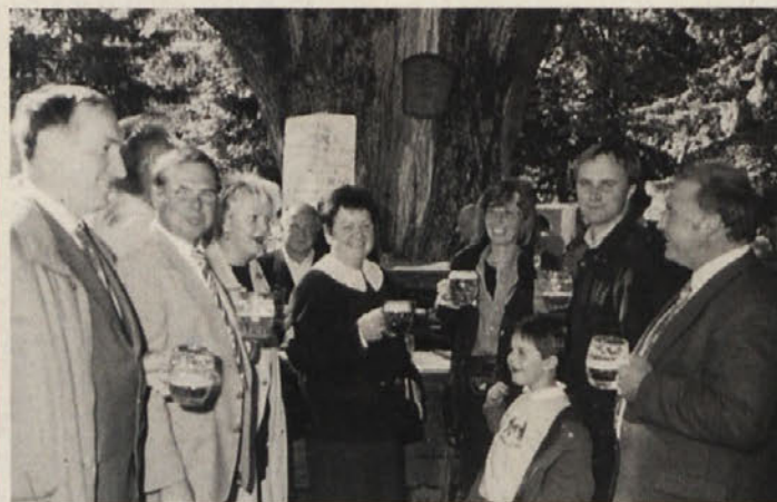
Žegnanje je termin za kmete, prišel je tudi zb. sv. SJK Štefan Domej

premražene romarje. Tega prijetnega programa so se prav posebej razveselili tudi številni slaščičarji, kramarji in domači gostinci, ki so imeli dober nos, kajti na naval obiskovalcev so se pripravili z zadostnimi zalogami pijače in jedače. Ker pa je rozalsko žegnanje v prvi vrsti namenjeno časti Bogu in omenjeni svetnici, je pri oltarju nad izkopanimi bilo več maš, ki so jih romarji pridno in izdatno obiskali. Prijetno presečenjenje letošnjega rozalskega žegnanja pa je vsekakor bilo dejstvo, da ni zdrknilo na raven poceni tribune volilnega boja. Tokrat pač deželni politikovi ni bilo, je dovtipno in pikro pripomnil neki romar. wafra