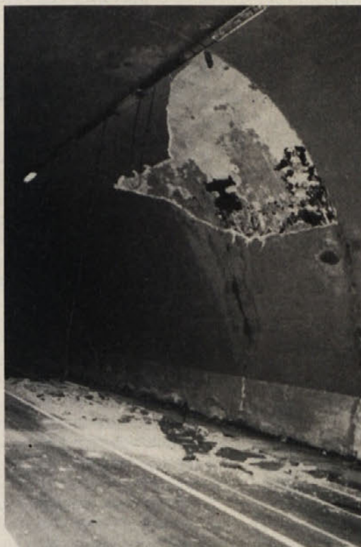
Zrušek v predoru