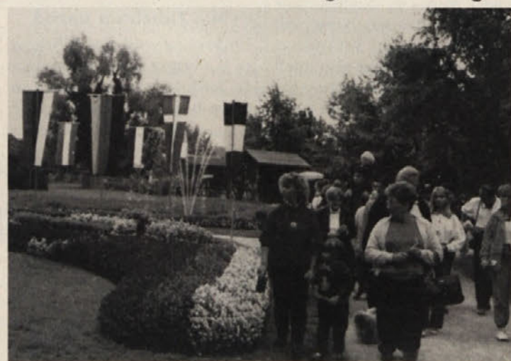
Razstava je privabila veliko ljudi

V Savinjskem gaju v Mozirju, moremo reči, da je na letošnji razstavi Cvetje Evrope '96 v Savinjskem gaju v Mozirju bilo kaj videti in še več za občudovati. Na stotisoče različnih cvetic je privabilo strašansko veliko obiskovalcev, točna številka še ni znana je pa po vsej verjetnosti tudi rekorda, tudi zato kjer je bilo vreme tako vrtinarjem kot obiskovalcem zelo naklonjeno.