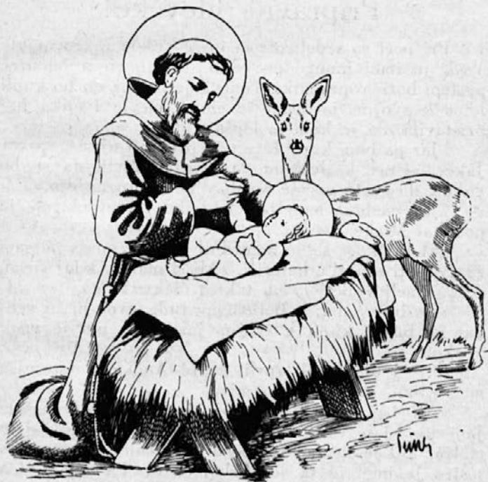
Sv. Francišek se razgovarja z Jezuščkom.