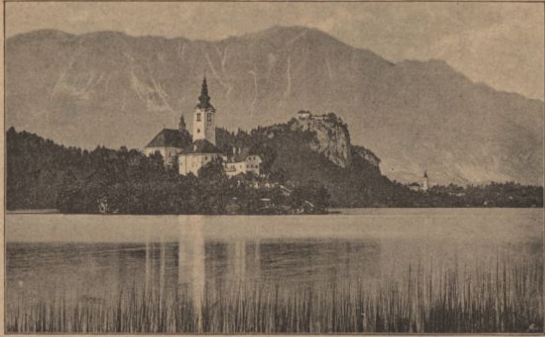
„Blejsko jezero“ (stran 17).