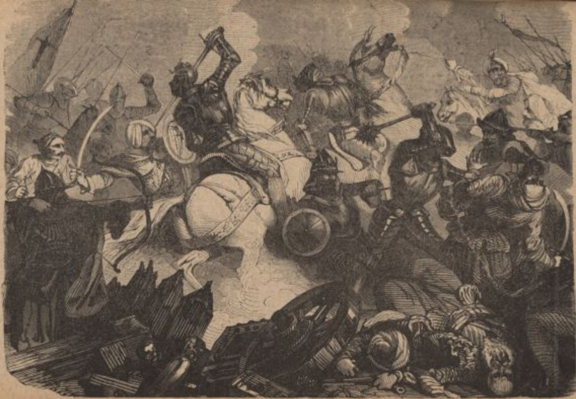
Ernest Železni pred Radgono (stran 41).