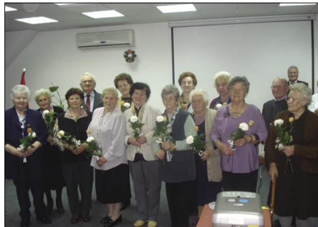
Člani, steri so stari 75 lejt ali starejši

mo pá meli bal pa se notrapopravimo v maškare. Zdaj, ka mammo več moškov v družtvi, njé mo tö mogli nanjé vzeti, naj se namaskirajo, če do meli korajžo. Letni piknik mo držali na Dolenjom Seniki, zdaj smo se odlaučili za tau ves, ka tam so tö dobri pogoji (feltételek) za telko lidi. Meli mo pa takšne programe tö, stero smo do tejpgamau nej meli, šli mo gobe brat pa meli mo kolesarsko turo tö, za tiste, steri so ešče mlajši pa se radi vozijo s biciklinom.