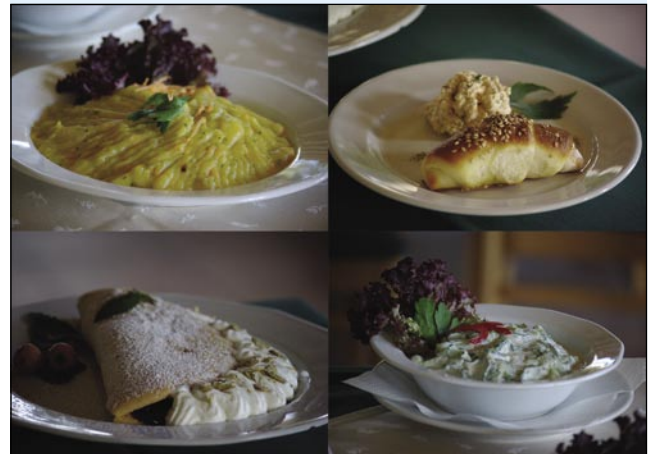
Jedi, ki so jih pripravili v okviru usposabljanja v restavraciji Lipa