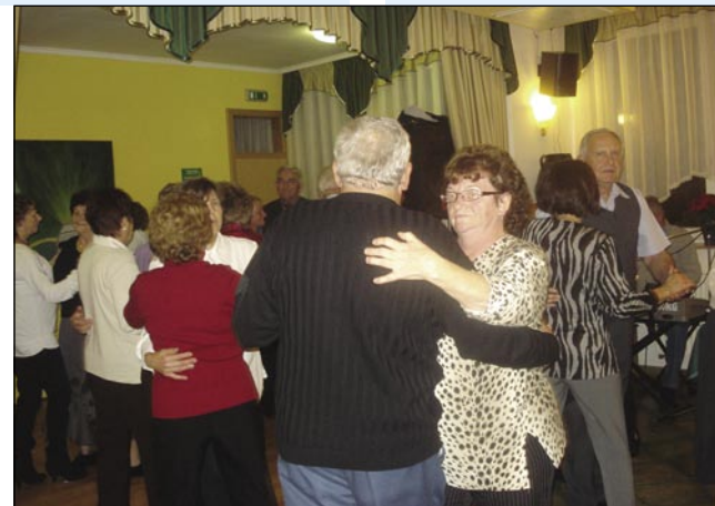
Člani društva se radi zavrtijo

mo pá meli bal pa se notrapopravimo v maškare. Zdaj, ka mammo več moškov v družtvi, njé mo tö mogli nanjé vzeti, naj se namaskirajo, če do meli korajžo. Letni piknik mo držali na Dolenjom Seniki, zdaj smo se odlaučili za tau ves, ka tam so tö dobri pogoji (feltételek) za telko lidi. Meli mo pa takšne programe tö, stero smo do tejpgamau nej meli, šli mo gobe brat pa meli mo kolesarsko turo tö, za tiste, steri so ešče mlajši pa se radi vozijo s biciklinom.