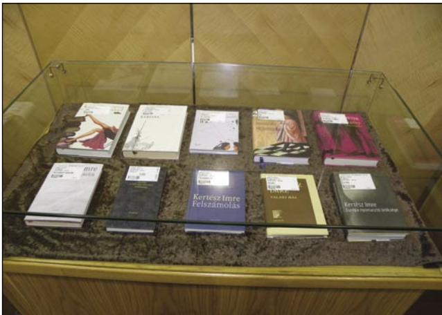
Vitrina, v kateri so pretežno dela nobelovca Imreja Kertésza

brati najbolj dragoceno beletristiko... Zaradi nenehno spreminjajočih se modnih trendov in usmeritev na področju književnosti se je težko odločiti, katero je kvalitetno in trajno vredno delo. Katera od novitet je dragocena, jezikovno in estetsko tako pomemb-