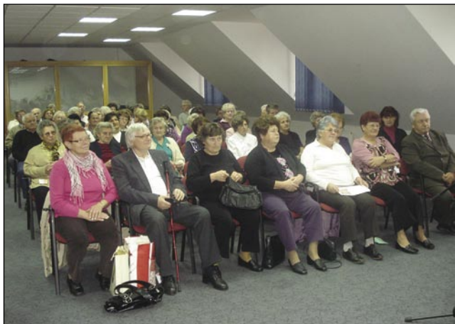
Člani društva pa gostje iz Puconec

Nedela, gda smo se srečali, je bila ranč tretja nedela v mejseci, zatok je bila v varaškoj