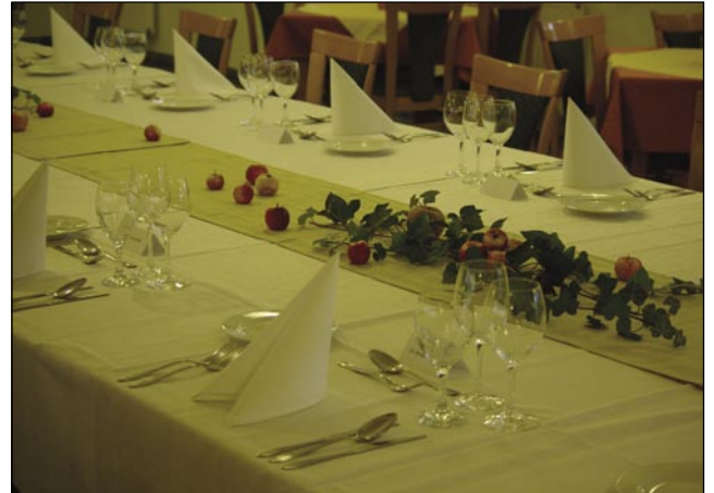
Lepo pripravljena miza na delovnem kosilu

»Da je celotni projekt potekal brez večjih problemov,