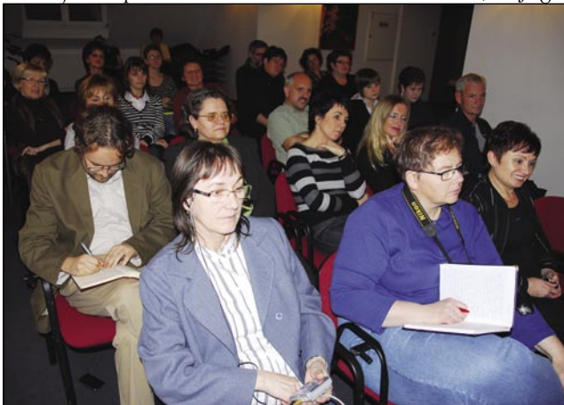
Obiskovalci srečanja so zdaj tó trno zadovolni bili