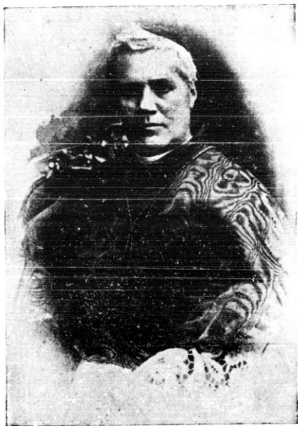
† Sveti Oče Pij X.