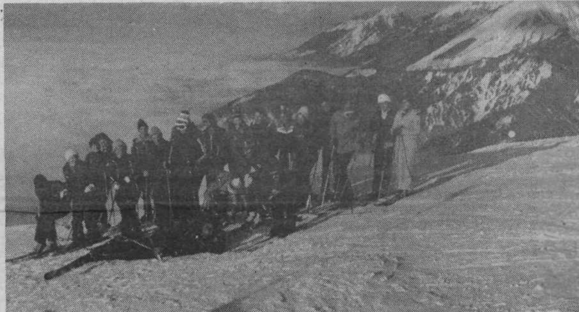
Tudi letos se bodo vzgojiteljice VVZ učile smučanja, le da tokrat v Kranjski gori. Lani so se zbrale na Kravcu (na sliki) in nekaj dni pozneje so že samostojno učile smučati svoje male varovance.