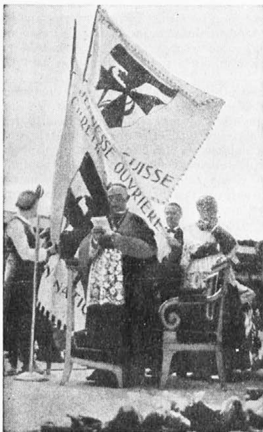
Kardinal Verdier na kongresu krščanske delavske mladine v Parizu

Zakaj pa se Ti je Verdier tako priljubil? Kaj na njem posebno občuduješ?