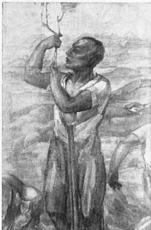
Tratnik : Pomlad

Sodobna mladina sicer ve in razume, da so pota otrok teme, t. j. onih, ki jim ni mar za značajnost in poštenost, v življenju lahko zelo uspešna. Saj je rekel Kristus, »da so otroci teme pametnejši kot otroci luči.« Vendar je življenjska pametnost za krščansko mladino premajhna vrednota, da bi nehala pripadati skupini otrok luči, t. j. otrokom božjim, otrokom,