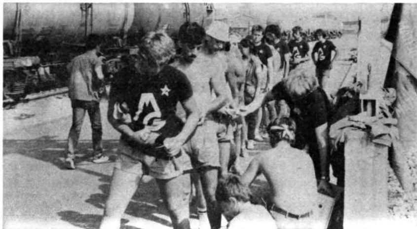
MDA KOLUBARA – Malica po napornem delu pri menjavi tračnic na železnici

V nasprotju z obema ostalima občinama, se je izguba v gospodarstvu občine Sevnica povečala, tako