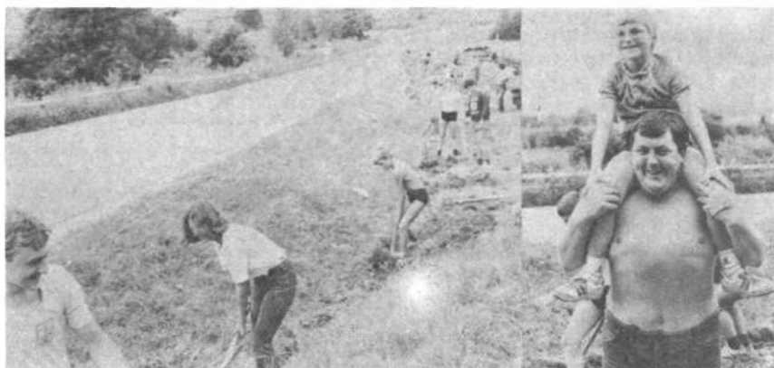
Med brigadirji — pionirji v Stari vasi je bila tudi tale brigadirka iz Revirjev.