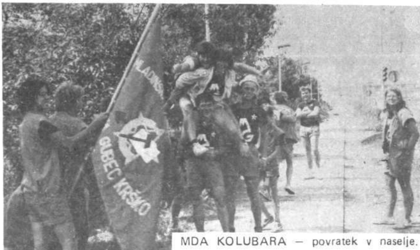
MDA KOLUBARA – povratak v naselje.

II. izmena je bila v obliki tabora, kar se nekoliko razlikuje od običajne delovne brigade, predvsem v tem, da je življenje tabora nekoliko bolj sproščeno, kajti poudarek je bolj kot med brigadirji na medsebojnem spoznavanju in spoznavanju okolice in dežele nasploh. Kajti na tem taboru so sodelovali mladi različnih držav. Prišli so iz: Amerike, Belgije, Nizozemske, Finske, Švedske, Francije, Nemčije, Španije, Italije, Argentine, Namibije, Anglije, Estonije in Madžarske. V naselju je bilo 60 – 70 tujcev in lahko rečemo, da so bili medsebojni odnosi zelo dobri, kljub temu, da prevajalci niso bili zagotovljeni pravočasno, pa so se med sabo kar