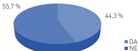
Graf 2: Vzorec staršev glede na to, ali je v družini še kakšen šoloobvezen otrok.

Anketne vprašalnike za starše učencev prvega VIO pa je rešilo 245 staršev. V raziskavi je sodelovalo 82,4 % predstavnic ženskega spola in 17,6 % predstavnikov moškega spola. Tudi število anketiranih staršev je skoraj enakomerno porazdeljeno glede na razred, ki ga obiskuje njihov otrok. Anketni vprašalnik je izpolnjevalo največ staršev, ki imajo svojega otroka v prvem razredu (36,3 %), sledijo starši otrok v drugem razredu (32,2 %) in starši tretješolcev (31,4 %). V raziskavi je sodelovalo več staršev, katerih otrok je prvi šolajoči se (graf 2). Od staršev, ki imajo še katerega šoloobveznega otroka, jih je največ takih s še enim šolarjem, in sicer 78,2 %, z dvema jih je 18,4 %, najmanjši delež pa je tistih, ki imajo še tri šoloobvezne otroke, in sicer 3,4 %.