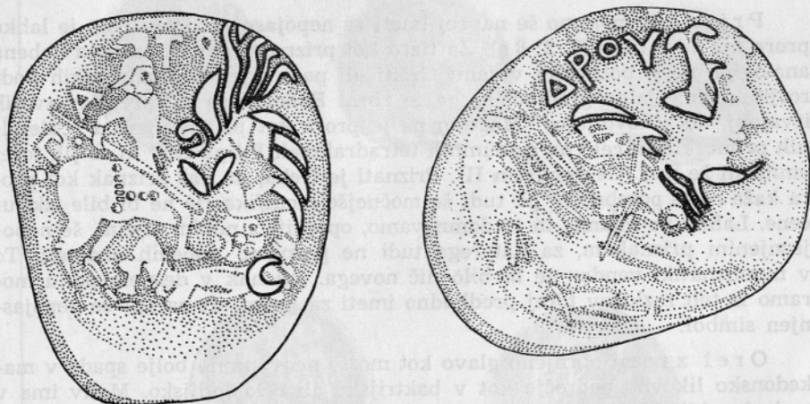
Ostanki prekovane tetradrahme Aleksandra III. Reste einer übergeprägten Tetradrachme Alexanders III.

Sprednja stran prekovanega novca nam je znana in je identična s pariškim primerkom 35 (T. 2: 10 a) ali pa morda z nekoliko dograviranim žigom