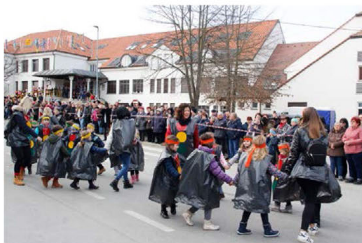
Najmlajši iz vrtca Videm kot semaforji