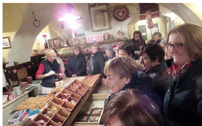
Pri Lectarju v Radovljici