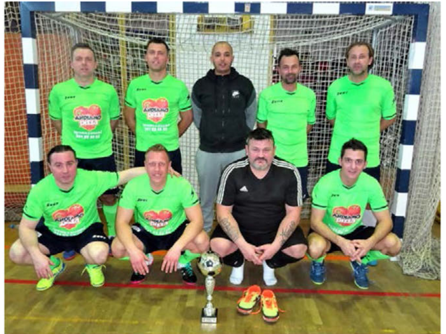
Pizzeria Andiamo – prvaki v veteranski kategoriji.