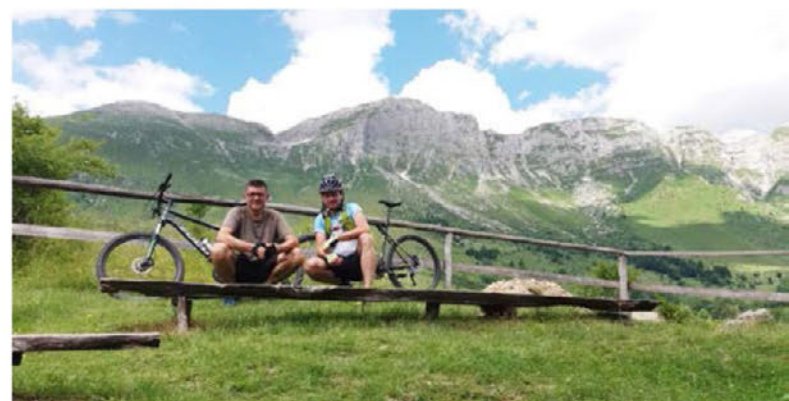
Na planini Kuhinja pod Krnom