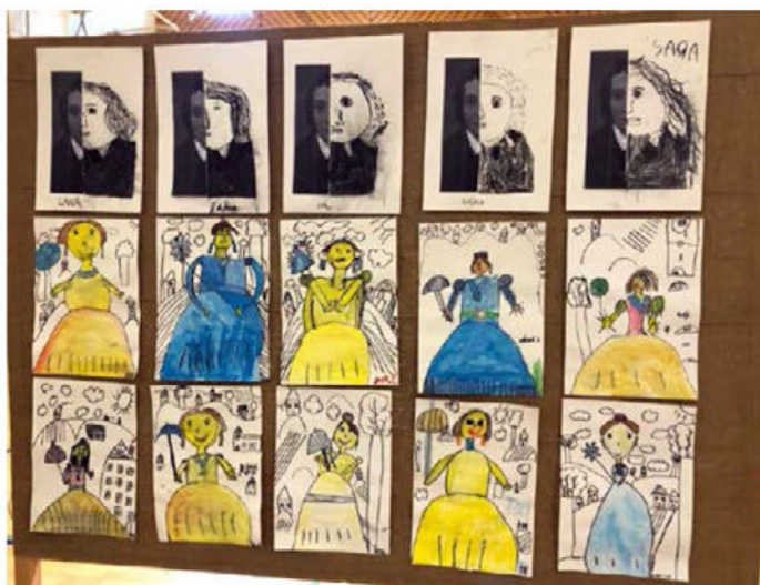
Razstava ob Prešernovem dnevu na šoli Leskovec