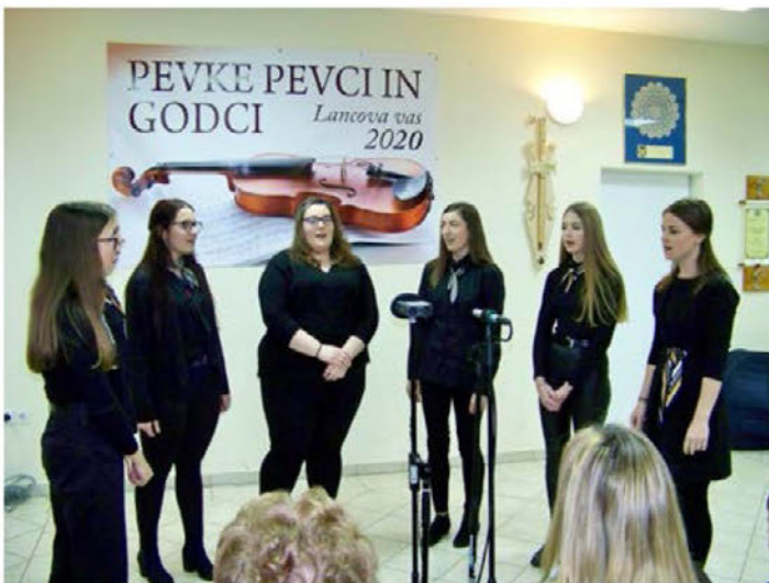
Prvič so se predstavile mlade pevke FD Lancova vas in požele velik aplavz.