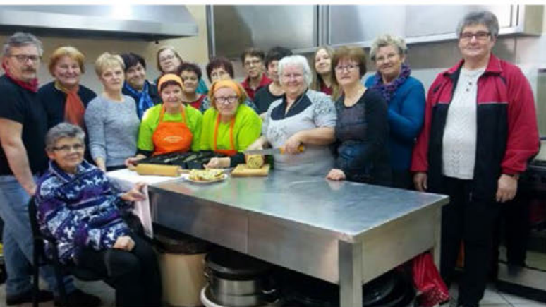
Do junija bodo Lancovljanke prav gotovo dodobra izpopolnile kuharsko znanje o poticah. Fotografija je nastala na enem izmed četrtkovih tečajev peke potic.