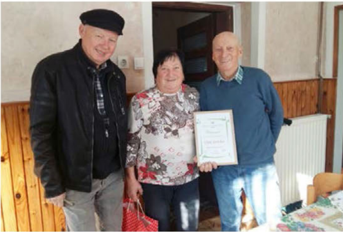
Zakonca Habjanič iz Sovič sta praznovala petdeset let skupnega življenja. Oba sta člana DU Videm in delegacija društva ju je obiskala s čestitko.

poti, čakajo nas srečanje članov v Majšperku, strokovna ekskurzija in trgatev, v oktobru pohod po Halozah, v novembru nakupovalni dan na Madžarskem. Zadnji mesec v letu bo rezerviran za obiske članov, starih nad 80 let, in invalidov, člane bomo obiskali s koledarji in pripravili zaključek leta za člane DU Videm.