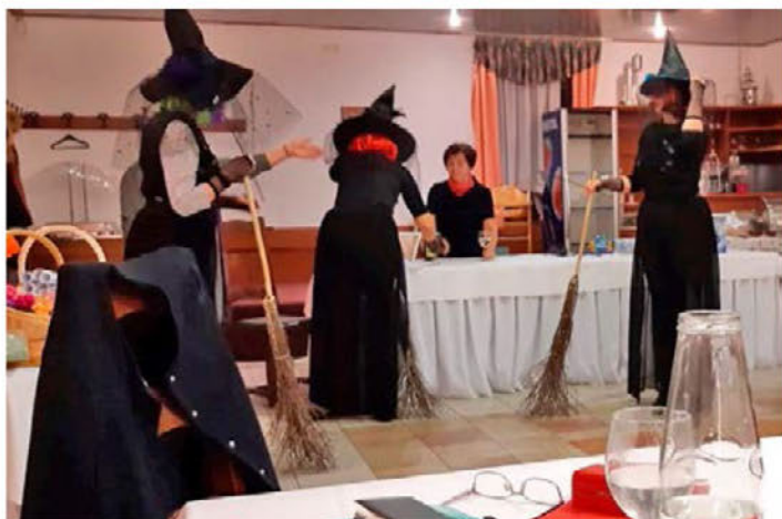
Čarovnice so zmotile delovno srečanje.

Potepanje so nadaljevali po praznično okrašeni Ljubljani. S seboj so prinesli spomine z Ljubljanskega gradu, navdušila pa jih je tudi lanska zgodba Ledene dežele o koliščarjih, Rimljanih in tudi znamenita Plečnikova arhitektura. Glavna atrakcija je bil ledeni zmaj.