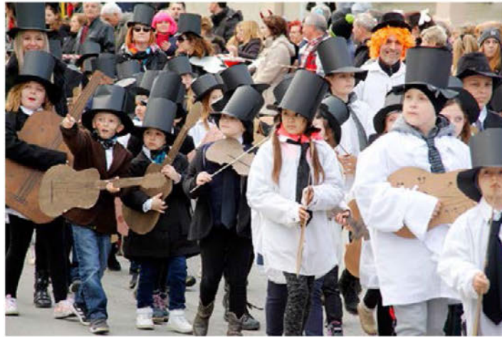
Tudi učenci Osnovne šole Videm so se zabavali v povorki, letos so se predstavili kot glasbeniki.

tradicionalnih etnografskih likov predstavile tudi zanimive karnevalske skupine iz tujine. Posebne pozornosti tako občinstva kot tudi posebne pustne komisije, ki je na koncu razdelila nagrade, pa so bile deležne karnevalske skupine iz videmske in sosednjih občin. Prva tri mesta so osvojili: Disco Party iz