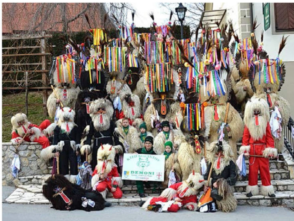
Številna skupina KTED Korantov Demoni na letošnjem videmskem fašenk

skih karnevalskih mest (FECC). Svoje poslanstvo korant demon opravlja v času pusta od svečnice do pepelnice.