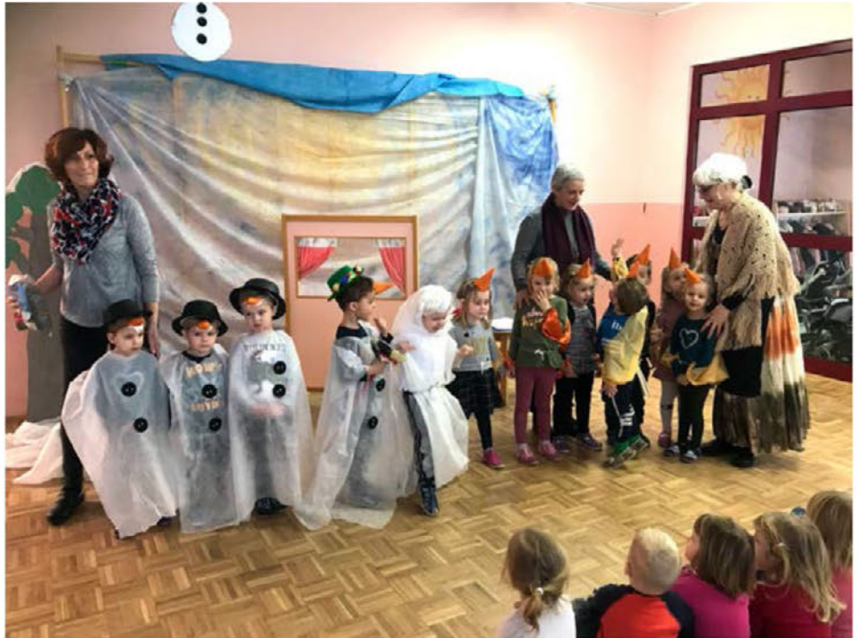
Utrinek s predstave Snežakec Jakec