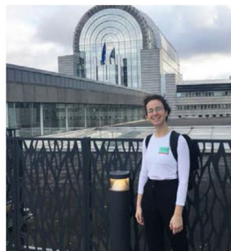
Reportaža iz Bruslja.

V januarju 2020 je bil čas za moj prvi popolnoma samostojni podvig. Izbrala sem prestolnico Evropske unije, Bruselj. Sama greš? Ja, celotno življenje v