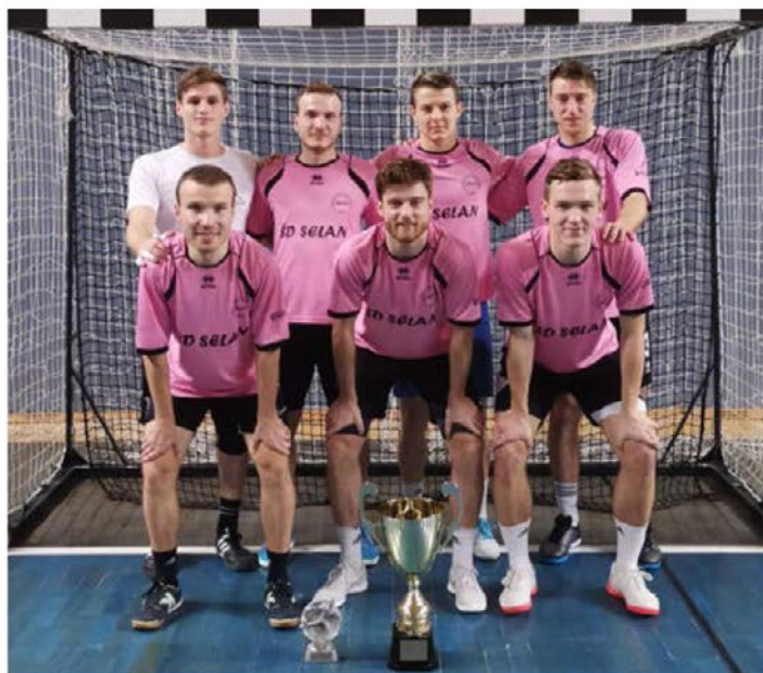
V zimski ligi MNZ Ptuj je ekipa ŠD Selan osvojila 2. mesto.

Ker je večina ekipe študentsko obarvana, smo se letos odločili igrati tudi študentsko ligo Zdrava zabava v Mariboru. Konec lige bo šele v poznih spomladanskih mesecih, po 7. krogih pa imamo trenutno na kontu same zmage. Aktivno smo sodelovali tudi na številnih turnirjih. Na izjemno kakovostnem novoletnem turnirju v Radencih je bil ponovno dosežen velik uspeh. V konkurenci 32 ekip smo osvojili 2. mesto in s kanč-