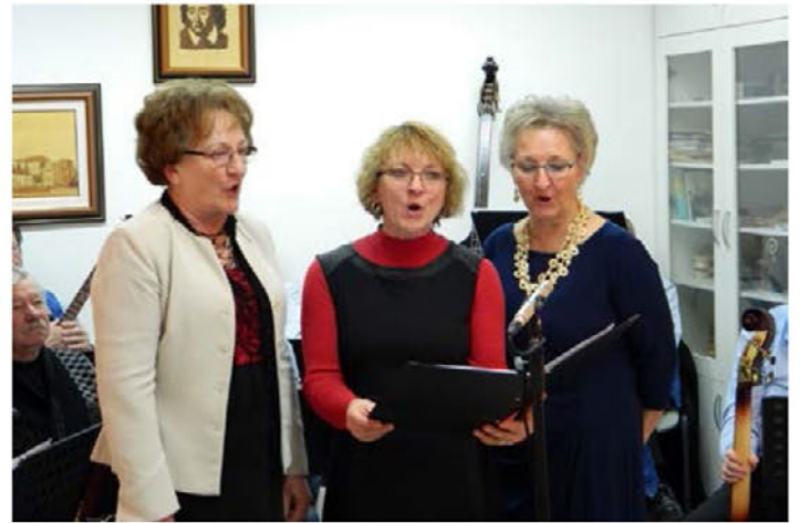
Ob kulturnem prazniku smo lahko prisluhnili sestram Gabrovce.