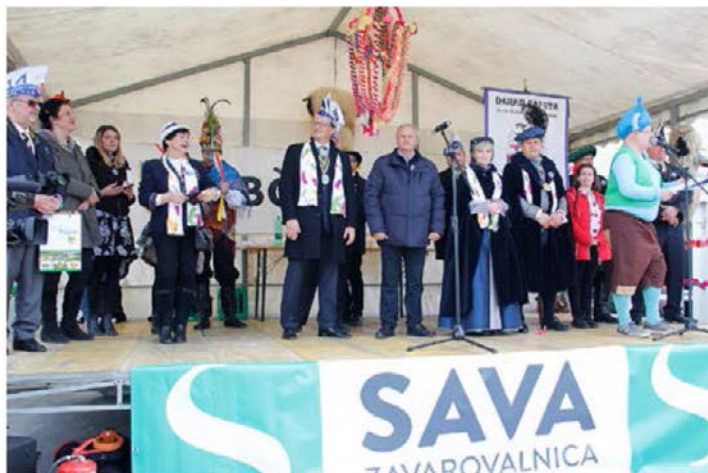
Župan in gostje na prireditvenem odru

Na videmskem fašenku so se poleg mask iz vrtca in šole ter