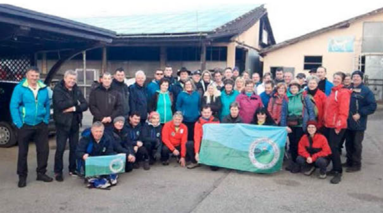
Na Štefanovem pohodu po Halozah

Od tod se razprostira čudovit pogled na Ptujsko Goro in Ptuj. Pohodniki smo se z Vildona podali mimo Janževine do vrha Janškega Vrha in nato krožno nazaj do avtomobilov. Na Janžu smo si ogledali notranjost cerkvice sv. Janeza Krstnika, ki leži na višini 641 m. Med potjo smo bili deležni prijaznosti domačinov, ki so nas pogostili z vinsko kapljico in dobrotami.