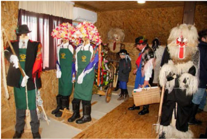
Pogled v muzej mask.