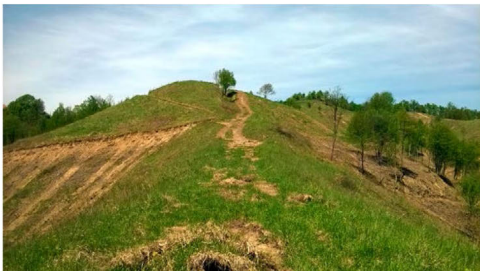
V Halozah je v projekt Življenje traviščem vključenih 93 kmetijskih gospodarstev.

Če ste zainteresirani za vključitev v pašno skupnost, vas vabimo, da izrazite interes za pridružitve pašni skupnosti na enega od kontaktov PRJ HALO, Cirkulane 56, 2282 Cirkulane, 02 795 32 00, info@halo.si.