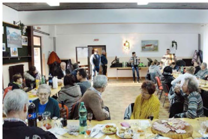
Krajani KS Dolena in gostje na novoletnem druženju

Ob zaključku leta 2019 smo se člani sveta KS ozrli na prehojeno pot v našem mandatu z začetkom v letu 2019. Sprejeti program dela in več kot 40 tekoče zastavljenih nalog (sklepov) smo realizirali v obsegu prek treh četrtin.