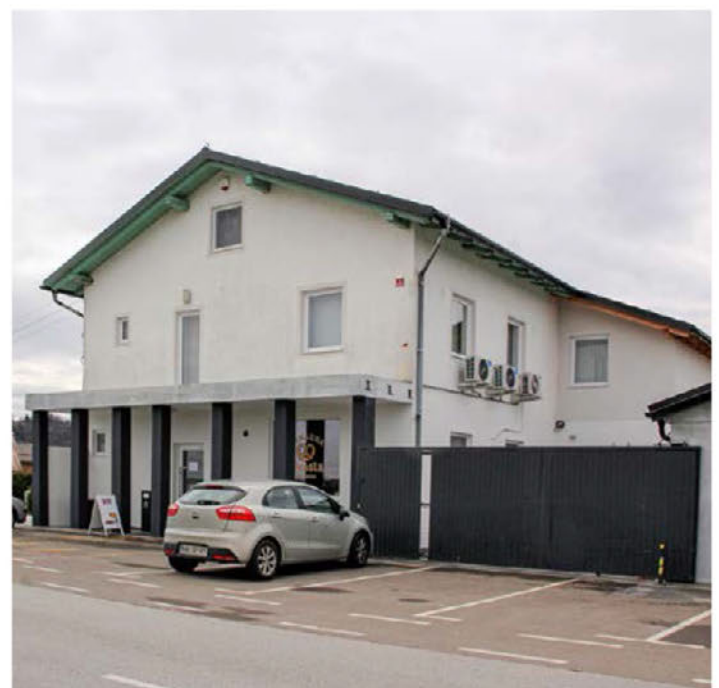
V zgradbi podjetja Miral je od lanske jeseni pekarna Presta Premium.

Osnovna šola Videm, Videm pri Ptuj 47, 2284 Videm pri Ptuj, na podlagi 20. člena Zakona o vrtcih (Uradni list RS, št. 100/05 – uradno prečiščeno besedilo, 25/08, 98/09 – ZIUZGK, 36/10, 62/10 – ZUPJS, 94/10 – ZIU, 14/15 – ZUUJFO in 55/17) objavlja