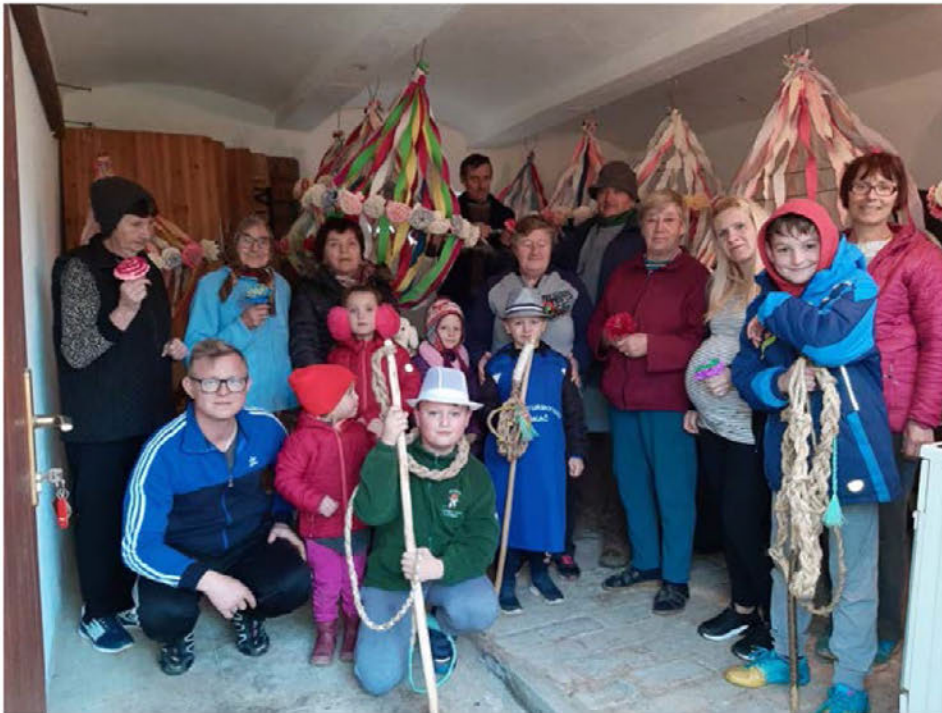
Z duhi so domačini okrasili Šturmovce.

N e mine leto, ko se Šturmovčani ne bi posvetili krašenju vasi v času pusta. Tudi letos je bilo tako.