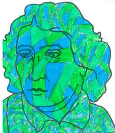
F. Prešeren – hladne barve Iona Ratajc Potrč, 5. a

Kultura zame pomeni, da se znaš lepo obnašati, da pozdravljaš, da uporabljaš besedi hvala in prosim, da se oblečeš priložnosti primerno, da znaš uporabljati knjižni jezik ter da obiskuješ kulturne prireditve.