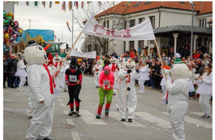
Zima po pobreško