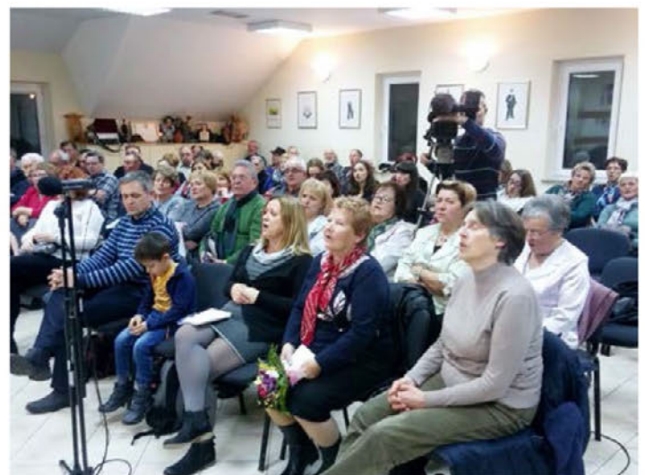
Ob koncu je zazvenela še skupna pesem Rožic ne bom trgala.