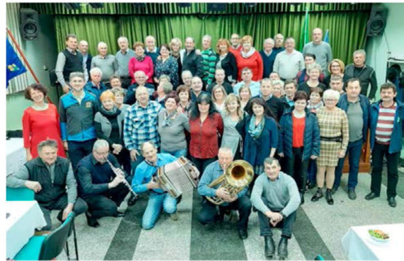
Člani Planinskega društva Haloze na delovnem srečanju

Povzpeli smo se na zahtevna vrhova – Razor, Begunjšičico. Vsako leto se podamo k sv. Donatu na Donačko goro in izpeljemo spominski pohod na naše preminule člane, Vidov pohod, Štefanov pohod in pohod na Goro Oljko. Zanimivi pohodi so bili na Žovnek - Čreto in vrhove Košutico, Mislinjo, Mirno goro in Javornik, Mrzlico. Dobro smo sodelovali tudi z drugimi društvi, predvsem s Hajdino. Nekaterim našim