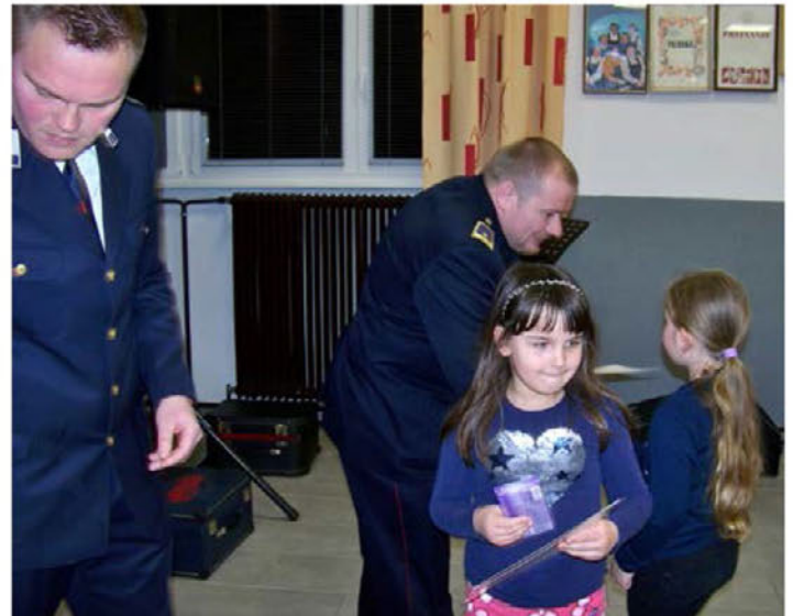
Čestitka za novo članico