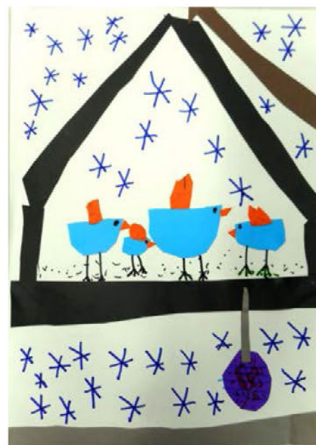
Ptičja hišica 1. OPB