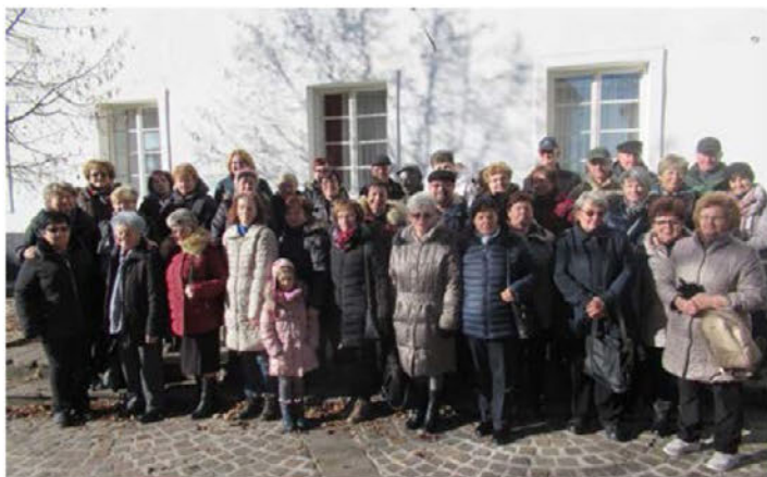
Na decembrskem izletu

vljice, v tradicionalni slovenski družinski hiši, so si ogledali prikaz izdelave srčkov in drugih izdelkov iz medenega testa.