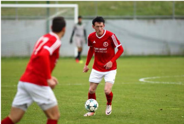
Članska ekipa Tržca upa na uspešno pomlad.

jih pripravlja ŠD. Tako bo za veliko noč organiziran pohod, sledi še prvomajski pohod z dvigom mlaja. Po koncu prvenstva je na sporedu srečanje med Tržcem in športno družino Emeršič. V avgustu bo v sklopu praznika KS Tržec na sporedu nočni turnir v malem nogometu za prehodni pokal KS Tržec, ne smemo pa pozabiti na novo tekmo med Polka slovensko nogometno reprezentanco in Tržcem, ki bo predvidoma v začetku septembra. Ob številnih sprotnih aktivnostih v klubu in okrog njega tako dogodkov v organizaciji ŠD Tržec tudi letos ne bo zmanjkalo.