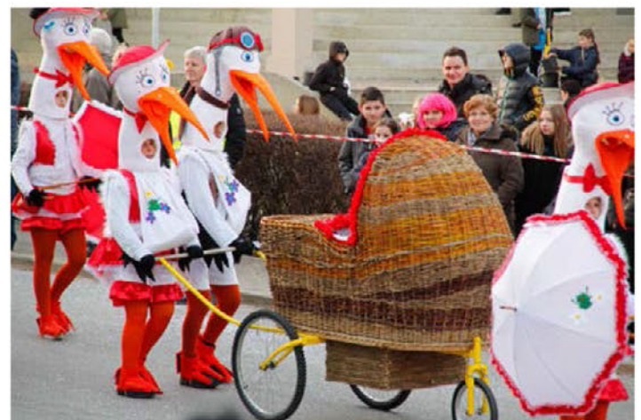
Štorklje iz Sodincev

Več fotografij na strani Facebook Koranti Lancova vas