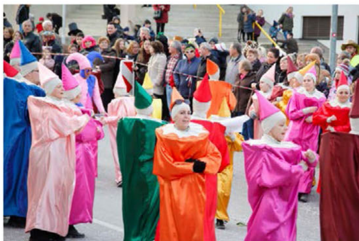
Barvice iz Bukovcev