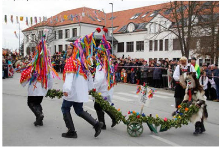
V povorki sodeluje tudi množica etnografskih likov.