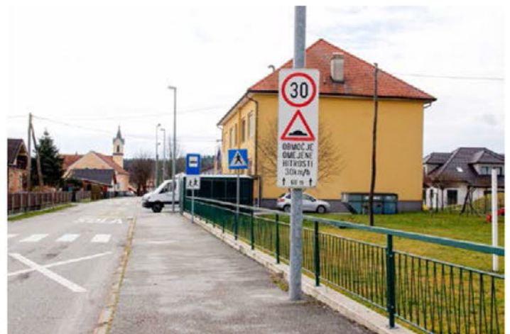
Utrip na terenu

Sicer pa SPVCP sodeluje s pristojnimi organi občine in strokovno službo ter predlaga ustrezne rešitve in ukrepe pri načrtovanju in razvoju cestnega prometa v občini, tako kot je to že bila praksa dosedanjih svetov v Občini Videm in kot je