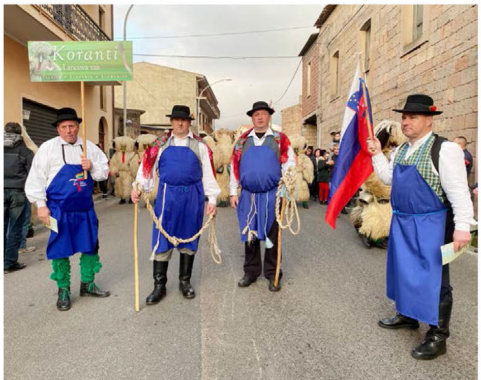
Za nami je še en obisk Sardinije, na katerem smo uspešno in s ponosom predstavili tradicijo naših krajev.