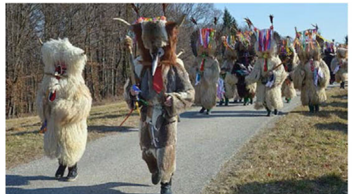
Na 10. Korantovem teku se je zbralo 160 korantov in več kot 50 drugih pustnih likov.