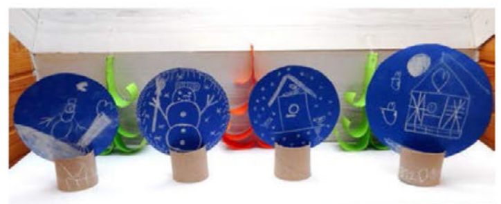
Snežne kroglice, 1. OPB