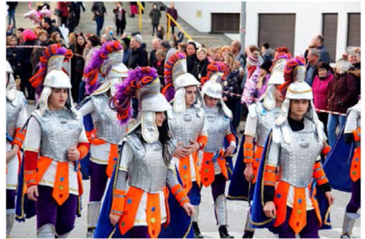
Sodeluje tudi več skupin iz tujine, med njimi letos prvič tudi učenci strojne šole iz Rakovice v Beogradu.