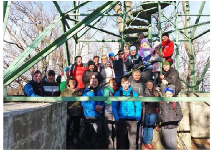
Novoletni pohod na Boč

dnem delu sta sledila še ogled slik s pohodov preteklega leta in druženje, ki se je zavleklo pozno v večer.