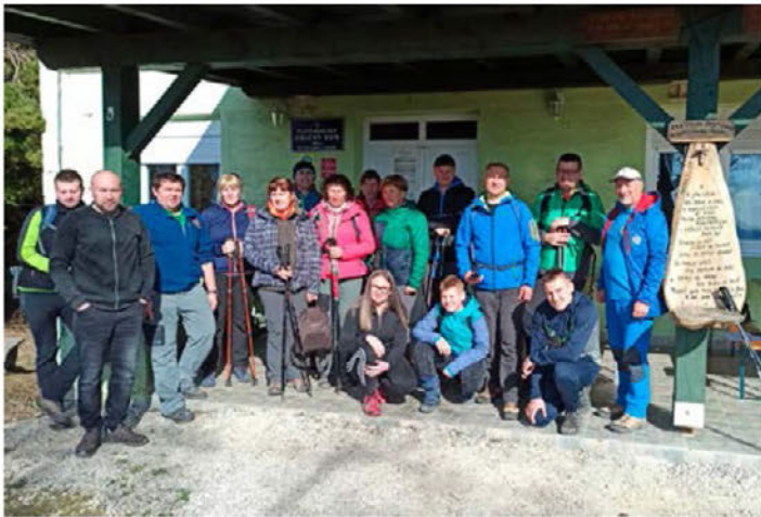
Na Ravni gori

Februarja smo izvedli redni zbor članov. Na zboru so vodilni predstavili delo v preteklem letu in načrte za letošnje. Po ura-