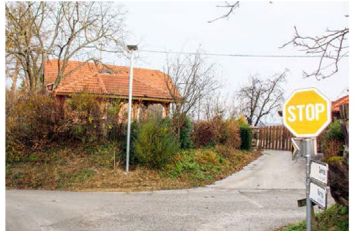
Solarne luči so povsem nova pridobitev v naseljih Soviče, Dravci in Vareja.

nogometno igrišče v Vareji, na domačiji Poslančec, v vseh treh naseljih KS so namestili po tri solarne luči, v jesenskih mesecih pa je bila modernizirana še cesta v Vareji proti Kmetcu v dolžini dobrih 190 m.