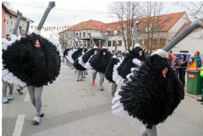
Noji iz Male vasi