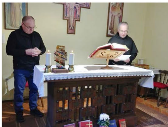
V samostanski kapeli sv. Vida je tudi letos potekal mini svetopisemski maraton.

Nprekinjeno, 24-urno branje Svetega pisma je letos potekalo med 26. januarjem in 1. februarjem v kapeli Antonovega doma na Viču, letošnji maraton pa so spremljale besede apostola Pavla »Živite kot otroci luči«. Številnim župnijam, ki organizirajo svoje mini maratone, se je četrto leto zapored pridružila tudi naša.