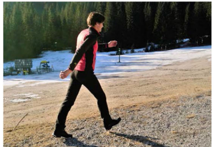
Pomen gibanja za krepitev zdravja

V prvem tednu v obsegu pol ure v intervalih od zmerne obremenitve dihalnega in srčno-žilnega aparata telesa do srednje visoke obremenitve. Povedano preprosto, od zmerno povišanega srčnega ritma do tolikšne intenzivnosti, da smo še sposobni dihati tekoče, brez lovljenja sape ali se sposobni pogovarjati v pohodniški družbi. Takšen interval naj se konča v približno 7–10 minutah. Opravimo od tri do pet vadbenih intervalov – ciklov. Pred prvim ciklom poskrbimo za približno