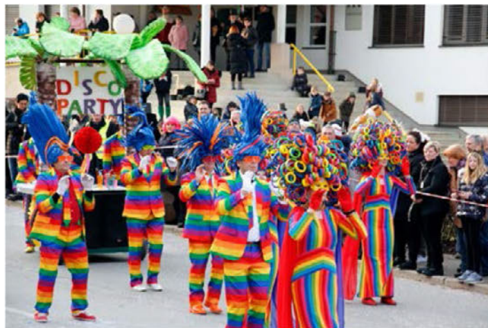
Disco Party iz Stojnecv