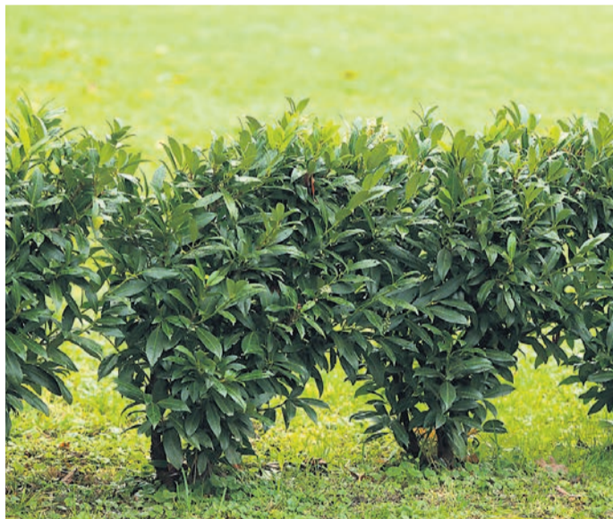
Strokovnjaki za okrasne rastline ljudem priporočajo, naj raje sadijo domače, avtohtone rastline.

V drevesnici Kurbus v Staršah še vedno prodajajo ciprese, ki jih uvažajo iz tujine. Povpraševanje se je sicer v zadnjih letih zelo zmanjšalo. Na spletni strani je navedena cena za sorto »Smaragd« od 6 do 548 evrov, odvisna pa je od višine, starosti in koreninskega sistema. Za okoli 50 cm visoko rastlino je treba odšteti okoli 10 evrov. Svojim strankam nudijo na kupljene rastline leto dni garancije, vendar samo v primeru, če so zasaditev opravili njihovi strokovni delavci. V nasprotnem primeru priznajo samo 40 odstotkov morebitne reklamacije, ob ustreznih dokazih seveda.