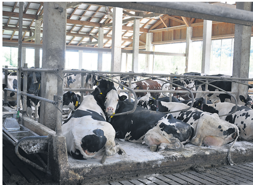
Pred šestimi leti so Hajškovi postavili nov hlev za 120 krav molznic. Gospodar Andrej Hajšek poudarja, da v kmetijstvu ni prostora za napake.

Andrej Hajšek je ob obisku (v večini mladih) kmetovalcev najprej izpostavil napredek kmetije in kmetijstva v zadnjih treh desetletjih, od ročne do robotske molže, prav tako pa ne gre spregledati šest let starega hleva za 120 krav molznic in še 20 presušenih krav, ki je bil skrbno načrtovan ob strokovni podpori kmetijskih svetovalcev. Vse investicije so pogojene seveda z denarjem. »Banke želijo denar nazaj,« je enostavno in brez olesjevanj dejal Hajšek. Da bi z dano količino molznic krav dosegli najboljše rezultate, jih enkrat ali dvakrat na mesec obišče avstrijski strokovnjak za prehrano živali. »Delati moraš brez napak ali s čim manj