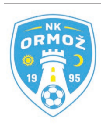
Novi klubski grb NK Ormož