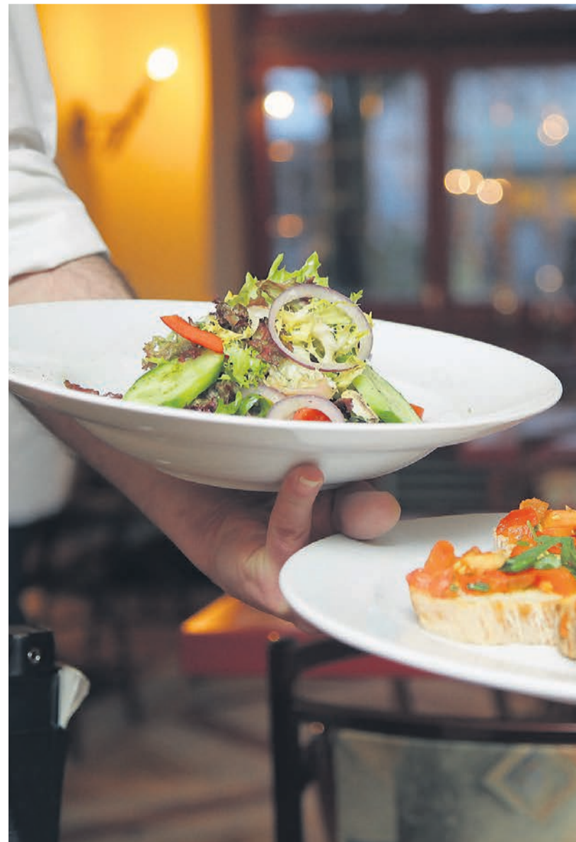
V panogi gostinstva in turizma se srečujejo s velikimi pomanjkanjem delavcev. Prihajajo večina kmalu zatem, ko pri nas pridobijo potrebne papirje, odpravi proti severu in zaho

mia in Hit Alpinea, ob napovedani ugasnitvi Družbe za upravljanje terjatev bank (DUTB) in prenosu njenega portfelja turističnih naložb na Slovenski državni holding (SDH) pa bo prišlo do dodatne