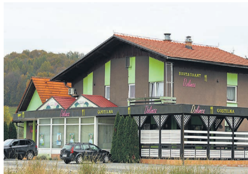
V Majšperku gostje lahko izbirajo med gostiščema Dolinca (od srede do nedelje) in Pice