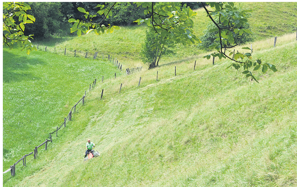
Država je nagradila višje ležeče kmetije. Kmete, ki se borijo s strminami, je kaznovala.

Znano je, da haloške strmine zahtevajo (praviloma dražje) specialno mehanizacijo in obilo ročnega dela, na drugi strani mnogi kmetje s sicer višje ležečimi kmetijami površine obdelujejo strojno, ob tem pa posedujejo še večje površine gozda. Država naj bi sedaj nagradila ravno slednje, medtem ko je haloške kmete kaznovala. »Država je v preteklosti izvajala projekte življenja travniščem in druge, ki naj bi spodbujali kmetijstvo v Haložah, s spremembo izračuna OMD se Haložam jemlje in izniči delo, ki je bilo do zdaj storjeno,« je dejal makolski kmetovalec. Bistveno je namreč, da bodo ob največ denarja kmetije s strminami in na nižjih nadmorskih višinah, kar je tipično za Haloze, Goričko in še nekatera druga slovenska območja, nagrajena pa