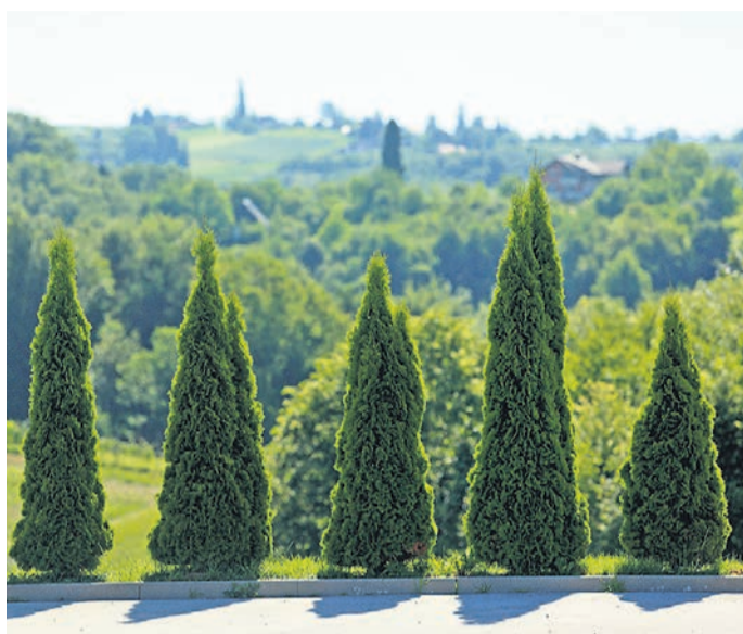
Veliko ljudi je v zadnjem času zaradi sušenja izruvalo ciprese.

Vrtnarstvo Tement iz Spodnjega Dupleka je že pred petimi leti iz prodaje izločilo ciprese, predvsem zaradi težav z obstojnostjo. Stranke so imele vse več težav s sušenjem rastlin in posledično tudi več sto evrov stroškov. Podobno odločitev so sprejeli v vrtnarstvu Tratenšek iz Slovenske Bistrice. Klekov ne prodajajo že dobri dve leti, saj se je povpraševanje zelo zmanjšalo, poleg tega večina ljudi po njihovih besedah ni znala