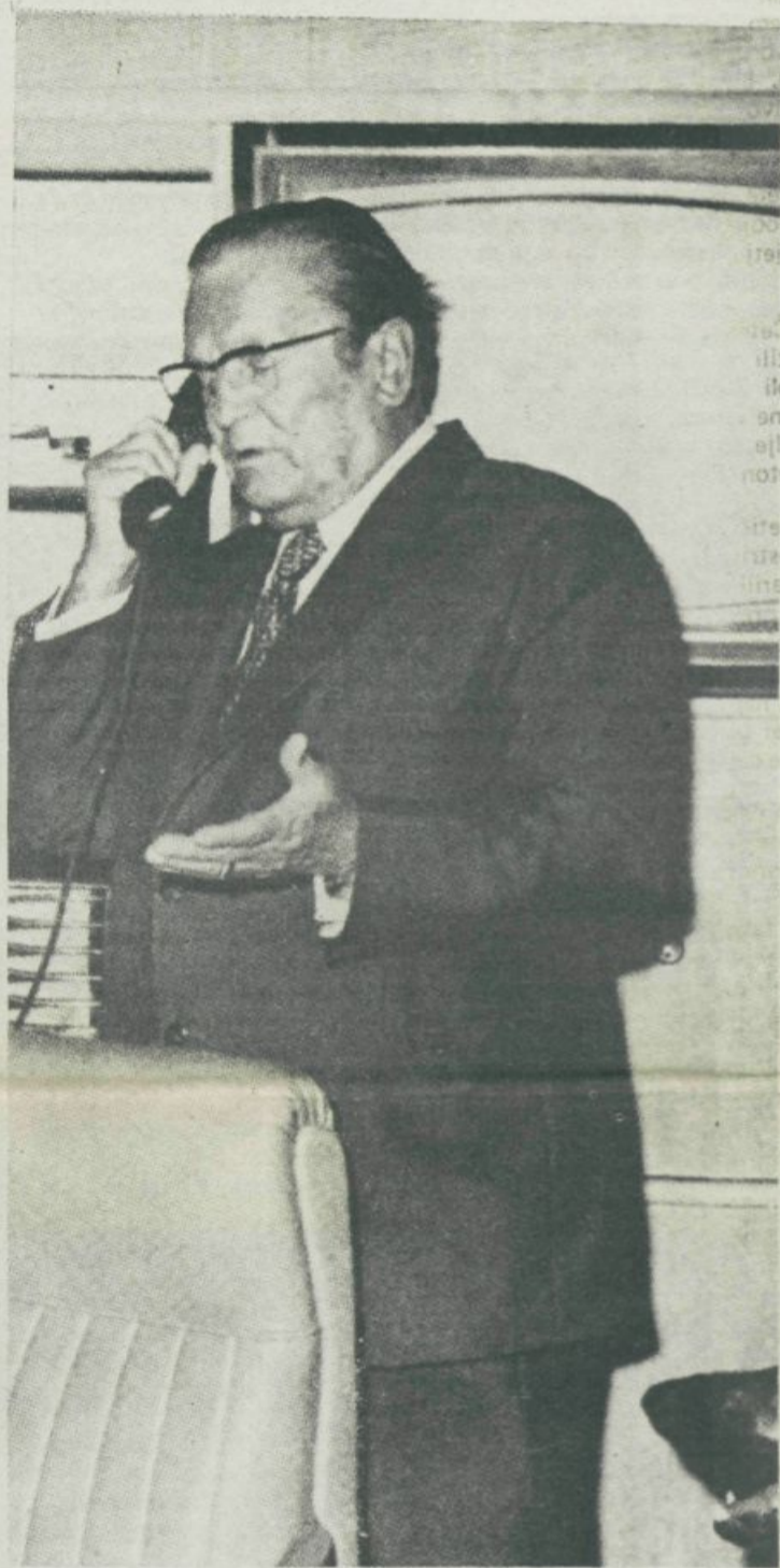
ljudje iz vrst ljudske inteligence, iz vrst delavcev in kmetov, tako da resnično lahko rečemo, da ima vso oblast v svojih rokah delovno ljudstvo naše države.

Prvič. Se med osvobodilno borbo smo uničili stari državni stroj, to silo za zatiranje, in sicer: a) administracijo; b) policijo in žandarmerijo, na katero se je opirala vladajoča buržoazija, in c) ostanek vojne organizacije emigrantske vlade v osebi četnika Draže Mihailovića, Paveličevo ustaško vojno organizacijo in Rupnikovo vojno organizacijo, tako imenovano belo gardo. Ta revolucionarni posel smo izvršili dosledno, v duhu principov, ki so jih postavili klasiki marksizma, kajti njihov nauk smo uporabili v vsem obsegu. Naša armada je popolnoma nova, od oficirjev do vojakov, sestavljajo jo delavci in kmetje, ki so se oborožili med osvobodilno borbo, med ljudsko revolucijo. Njen komandni sestav tvorijo — od podoficirjev do generalov — delavci, kmetje in ljudska inteligenca, ki so se udeležili vojne, ljudske revolucije. Milico in varnostne organe sestavljajo isti elementi. Državno administracijo sestavljajo delavci, kmetje in ljudska inteligenca, posebno vodilni kader. Vodilna mesta v gospodarstvu zavzemajo prav tako večinoma preizkušeni