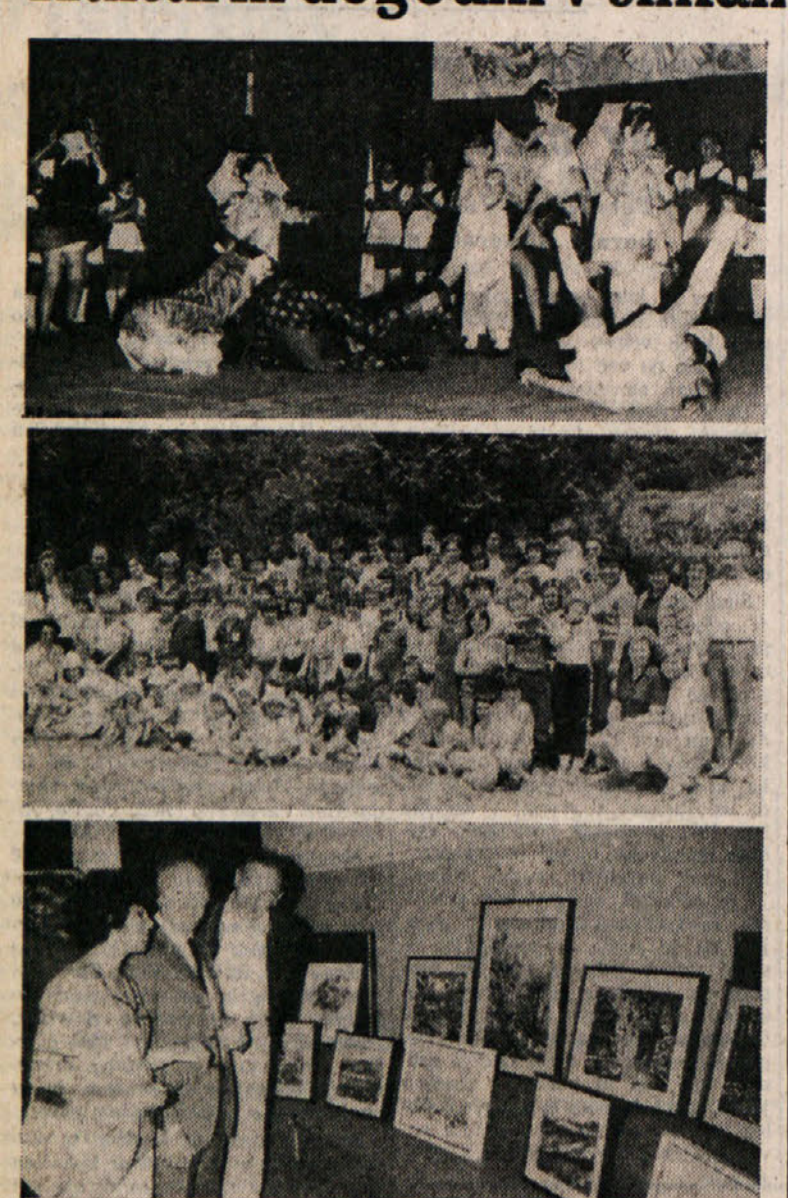
V soboto so v Ljudskem domu v Krizu imeli zaključni nastop tamkajšnje baletne šole (slika na vrhu). Otroci iz žaveljske šole ter od Korošcev so obiskali soljarje iz Ricmanj in v Dvorani (slika v sredini). Ob letošnji vinski razstavi v Nabrežini so od Dornja PD 'Igo Gruden' odprli tudi slikarsko razstavo domačih slikarjev