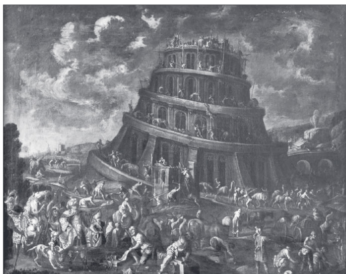
6. Babilonski stolp, Pokrajinski muzej Maribor