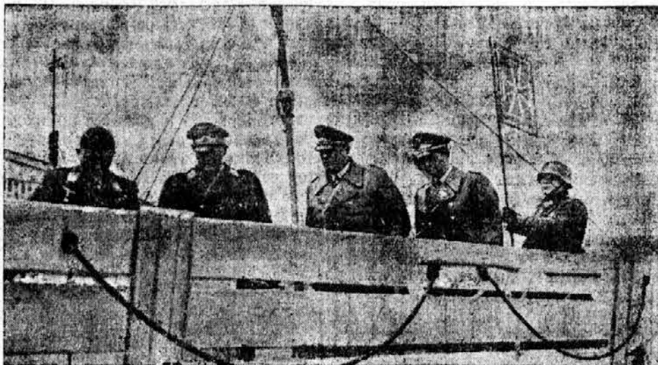
Maršal Göring na inspekcijskem potovanju ob Kanalu

V Kumingju in v nekoliko drugih kitajskih krajih pa so središča za izvežbanje mlajših kitajskih letalskih moči, katerih število se je do danes dvignilo že na dvatisoč. Poleg tega se pripravljata danes okoli 8000 vojakov za izvidnike, strelece in mornarje, med tem ko se na tisoče vojaštva uči za mehanike.