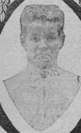
Gospa Kislan katere je bila zelo bolna in slabotna žena, je sedaj popolnoma zdrava in mati vrstnih in zdravih otrok.

Posljite še danes za 15 centov poštinih znamk za prekoristno knjigo "Človek, njegovo življenje in zdravje" Vsaka slovenska družina bi jo mogla imeti