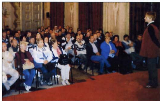
Litijski veterani v viteški dvorani poslušajo zgodovinski oris razvoja bistriškega gradu.