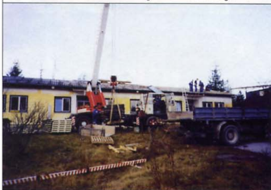
Nekaj utrinkov z dela na objektih prihodnjega Doma veteranov vojne za Slovenijo