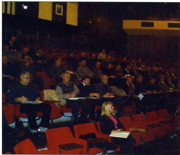
Delovno srečanje predsednikov in sekretarjev v Centru za obrambno usposabljanje v Poljčah

Seveda se organi ZVVS med 24. in 25. številko Veterana niso ukvarjali samo s športnimi srečanji. Po dolgem času se je končno premaknilo dogajanje okoli sprememb Zakona o vojnih veteranih. Naše zahteve o dodatni vključitvi določenih »civilnih« struktur med upravičence in o tem, da zakonska omejitev 50 let ne bi veljala za socialno ogrožene člane, so načeloma sprejete in zajete v predlogu, ki ga je Ministrstvo za obrambo posredovalo Ministrstvu za delo, družino in socialne zadeve, našemu pristojnemu ministrstvu. Od njih smo še pred volitvami sprejeli dopolnjeno besedilo, ki sta ga takoj obravnavali komisija za statutarna, finančna