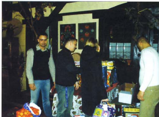
Mariborski študentje pripravljajo Miklavževa darila.

TISTI, S KATERIMI SMO SE SKUPAJ BOJEVALI, NISMO POZABILI TUDI TAKRAT, KO SO BILI ONI V STISKI