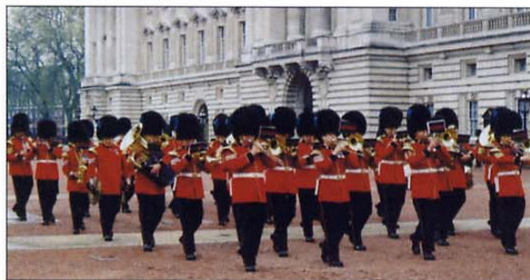
Nepogrešljiv del pri menjavi je polkovna godba na pihala.

Straža se je bojevala na vseh večjih bojnih pohodih angleške vojske, razen v Indiji. Brigade stražarjev in sestavljeni bataljoni stražarjev so se bojevali po vsem svetu. V muzeju lahko vidite, kje vse so se pripadniki kraljeve garde izkazali s svojim pogumom, ko so branili britanske interese. S ponosom vam povedo, da so pripadniki garde od leta 1680 sodelovali v številnih bojih od Maroka do zalivske vojne 1991. Stražarji so se pod kraljem Williamom III. in vojvodo Marlboroughejem bojevali na območju sedanje Belgije in Nizozemske, v severni Ameriki so se med tamkajšnjo osvobodilno vojno spopadali z generalom Washingtonom in njegovimi četami. Med Napoleonovimi vojnami so se proti Francozom bojevali v Španiji in na Portugalskem. Najbolj ponosni pa so pripadniki kraljeve garde na svoje predhodnike in njihovo vlogo v bitki pri Waterlooju, kjer je 18. junija 1815 Wellington končno premagal Napoleona. Ključni položaj je bila kmetija Hougoumont na levem Wellingtonovem krilu, ki so jo ves dan obvladovali pripadniki britanske kraljeve garde. Ob kritičnem trenutku bitke so Napoleonovo