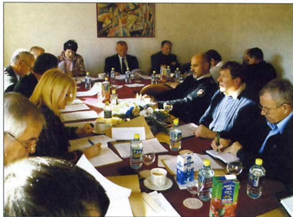
Med obema številkami revije Veterana je zasedalo tudi predsedstvo ZVVS.

Kaj je veteranski dodatek? To je dodatek, ki je najnižji med vsemi drugimi vojnimi veterani in znaša samo 60 odstotkov razlike med osnovo, ki je trenutno