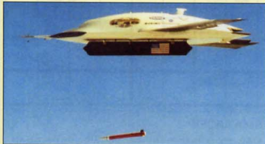
Letalo brez človeške posadke X-45A je odvrгло bombo in zadelo cilj. Operater je bil v bistvu samo nadzornik postopkov, ki jih je izvajalo letalo.