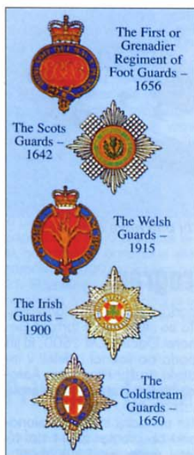
Oznake posameznih polkov