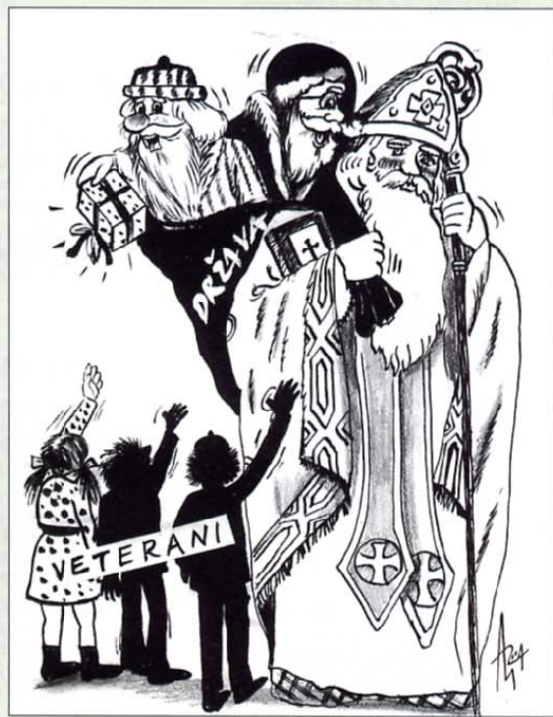
Država ima za veterane podobna darila kot Miklavž, Božiček in dedek Mraz – skromna!