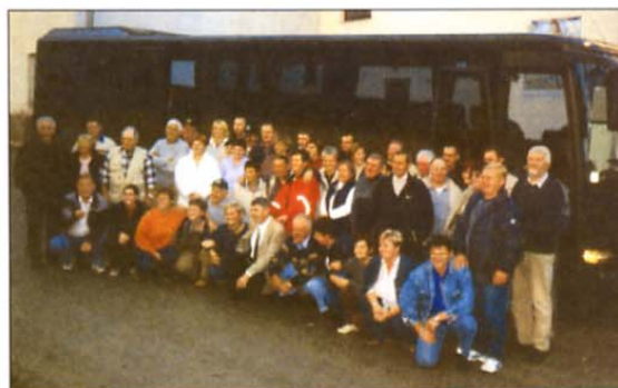
Skupinska slika je nastala v Dragatušu, kjer so si koroški veterani ogledali sobo pesnika Otona Župančiča.

Naslednji cilj je bil Dragatuš, kjer so si v gostišču Štefančič ogledali sobo pesnika Otona Župančiča, poskusili vino iz njihove vinske kleti ter se dobro najedli. Čas izleta je kar prehitro minil. Na poti proti domu je bilo veselo, zaigrala je harmonika in stresali so šale. Domov so prispeli za-