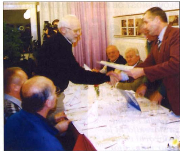
Veterani nismo pozabili na naše soborce, ki jih je prizadel letošnji potres v Posočju.