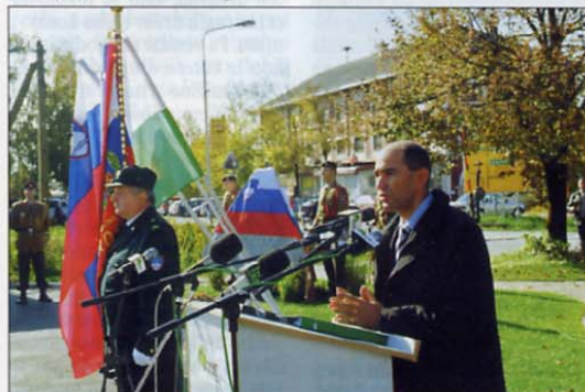
Janez Janša je v govoru poudaril, da se bo zavzel za čimprejšnjo popravilo in obravnavo zakona o vojnih veteranih v državnem zboru.