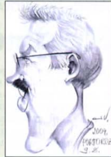
Pripravljala: Milan Alašević