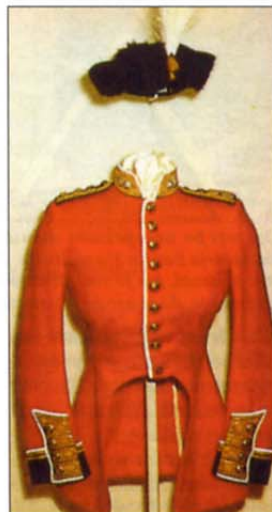
Vojaška bluza, ki jo je nosila kraljica kot poveljujoči polkovnik grenadirjev. (slika ima oznako sukunjic)