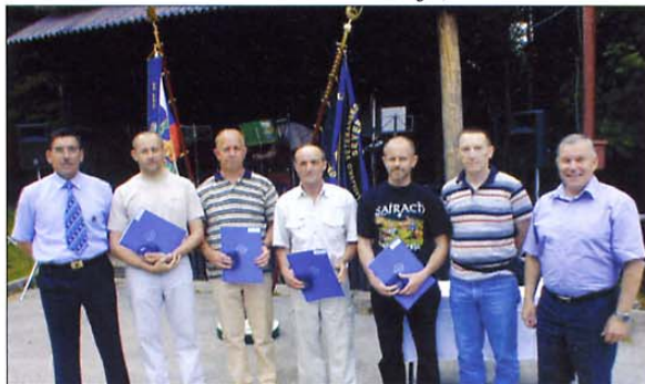
Prejemniki veteranskih priznanj