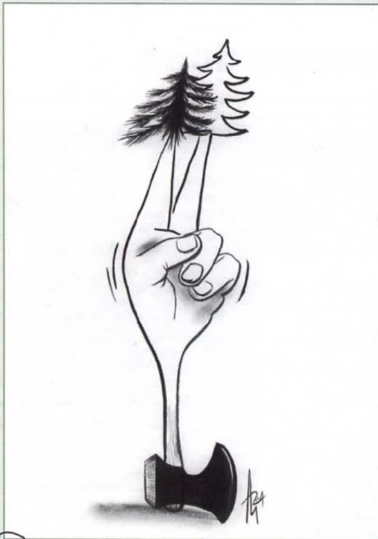
ZA) novoletni umor jelk