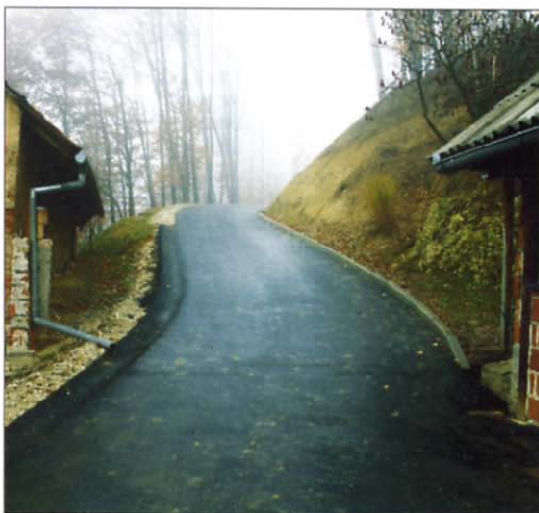
Do Cmagerjevih zdaj vodi lepa, asfaltirana cesta.

N akup avtomobila invalidnemu veteranu s Kuma je ena od prvih in hkrati tudi največjih solidarnostnih akcij, ki so jo pripravili in izpeljali veterani Zaslavja in v kateri so sodelovala tako rekoč vsa območna združenja. Tudi veterani Ruš so ob pomoči območnih združenj pomagali svojemu invalidnemu veteranu kupiti invalidski voziček in tako urediti stanovanje, da je postalo primerno za bivanje. Koroški veterani so priskočili na pomoč članu, kateremu je požar uničil gospodarsko poslopje, po požaru pa so pomagali tudi družini z Medvedjeka in ob koncu lanskega leta še družinam iz Loškega potoka, ki so prav tako pogorele. Odzvali smo se tudi ob hudi naravni nesreči v Logu pod Man-