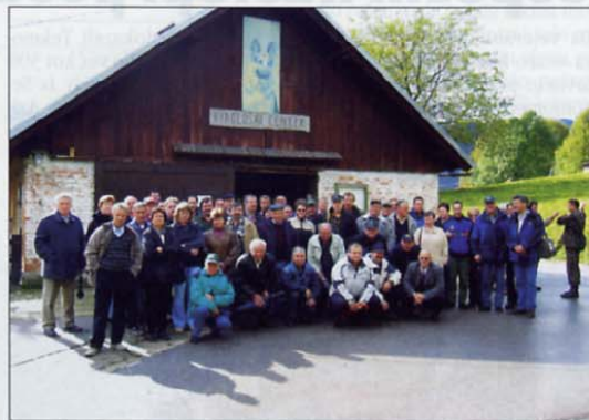
Vipavski in ajdovski veterani so si najprej ogledali Center vojaške veterinarske službe v Primožu, kjer so jim obširno predstavili center in prikazali delo s službenimi psi. V centru je nastala tudi ta spominska fotografija.

Veterani vojne za Slovenijo občin Vipava in Ajdovščina so se oktobra udeležili strokovne ekskurzije, med katero so si ogledali nekdanj zaprto območje Kočevske Reke. Zbralo se jih je 54, čeprav je bilo prijav veliko več. Najprej so si ogledali Center vojaške veterinarske službe v Primožu; v njem so jim obširno predstavili center in prikazali delo s službenimi psi. Udeleženci so pokazali kar veliko zanimanje, saj je marsikdo izvedel kaj novega. Zatem so si ogledali še znamenit center v Goteni, kjer pa so nekoliko negodovali, ker jim niso odprli vrat v goteniško podzemlje. Center je vseeno vreden ogleda. Nad celotnim izletom so bili izredno navdušeni, saj so spoznali kraje, v katerih jih večina še ni bila. Sicer jih je veš dan spremljal dež, kar pa ni motilo dobre volje. Ekskurzija na Kočevsko je bila del letnega programa dela OZVVS občin Ajdovščina in Vipava; letos so izvedli kar nekaj dejavnosti.