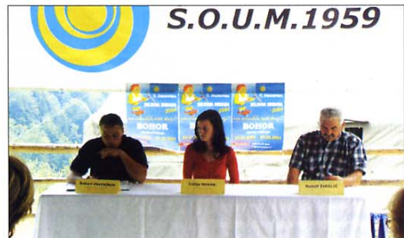
Tiskovna konferenca, ki so jo pripravili po končani delovni akciji na Bohorju.