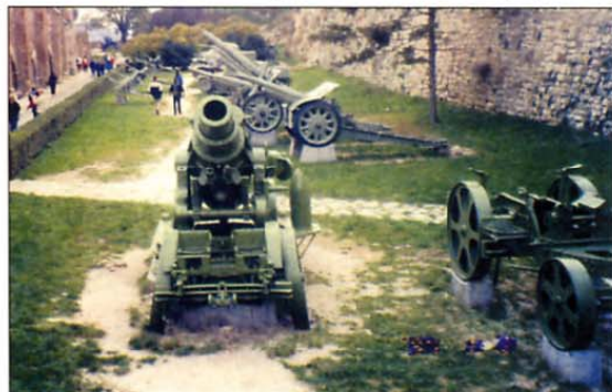
Eden od dveh še obstoječih primerkov možnarja škoda kalibra 30,5 cm je razstavljen v Vojaškem muzeju na Kalemegdanu v Beogradu.

Posebno pozornost so namenili ogledu Vojaškega muzeja na Kalemegdanu. Za temeljit ogled razstavljenih eksponatov v notranjih prostorih