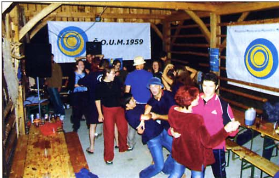
Čeprav so se izkazali z delom na delovni akciji, to ni bila ovira, da zabava ne bi trajala pozno v noč.