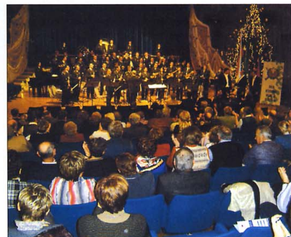
Dobrodelni koncert Orkestra Slovenske vojske v Krškem.

SPONZORJA DOBRODELNEGA KONCERTA ORKESTRA SLOVENSKE VOJSKE V KRŠKEM