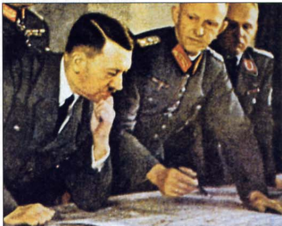
Tik pred eksplozijo je Hitlerja pritegnila neka podrobnost na zemljevidu sredi mize in nagnil se je, da bi bolje videl. Debela hrastova plošča, ki bi ga sicer morala ubiti, mu je rešila življenje.

Ko je Stauffenberg čakal, da ga najavijo pri Hitlerju, je Keitlov pribočnik nič hudega sluteč postavil bombo le 30 cm od diktatorja. Stauffenberg se je po pozdravu postavil blizu Hitlerja. Žico v bombi je že najmanj 10 minut razjedala kislina. Stauffenberg se je zavedal, da bo moral kmalu poročiti. Na vrsti je bil takoj za Heusingerjem. Zavedal se je, da ga bodo ujeli, če bo moral predolgo čakati. Na sestanku je bil še eden od zarotnikov, polkovnik Heinz Brandt, ki je vedel, da je atentat na Hitlerja neizogiben. Vendar mu na žalost nihče ni povedal, da bodo atentat izvedli na tem sestanku. Stauffenberg je bil na koncu živci, saj ni vedel, čez koliko časa bo bomba ob njegovih nogah eksplodirala. Če ga ne bi kmalu poklicali iz barake, bi ga lahko ubi-