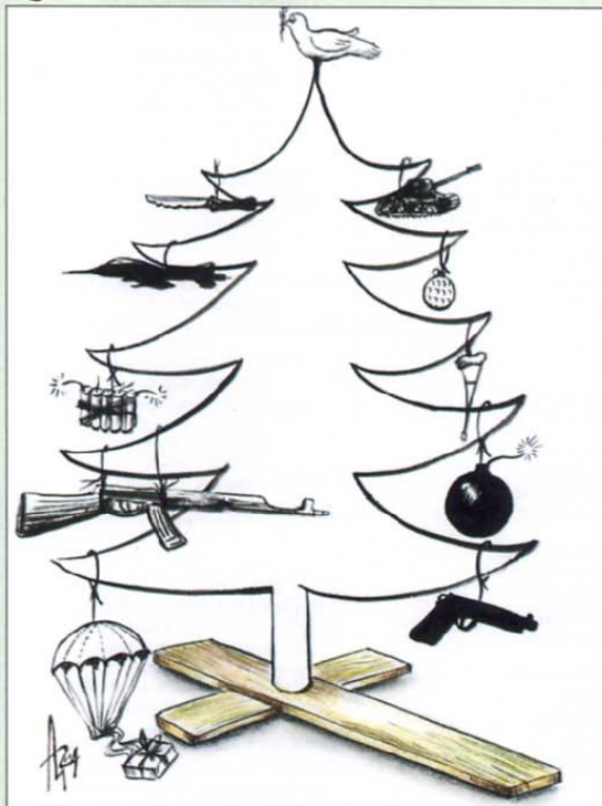
(Veteranova) novoletna jelka miru