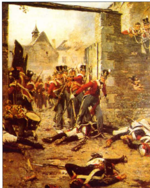
Zapiranje vrat kmetije Hougoumont med bitko pri Waterlooju 18. junija 1815 – kritični trenutek v bitki

vsak dan ob 11.30 in vsak drugi dan v preostalih mesecih. Nova straža se na dolžnost pripravi v Wellingtonovi vojašnici in ob 11.00 na čelu s polkovnim pihalnim orkestrom odkoraka do Buckinghamске palače. Obe enoti stare straže, tako iz Buckinghamске kot iz palače St. Jamesa, se zbereta pred palačo. Ob prihodu nove straže se enoti pozdravita, stotnika obeh straž si simbolično izmenjata ključe, stražarji pa se zamenjajo. Stara straža nato po-