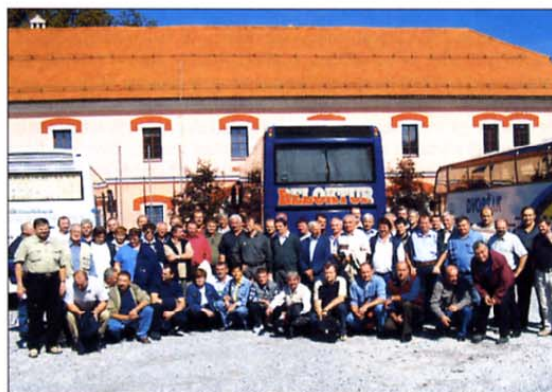
Osrednja točka jesenskega izleta je bil ogled Tehniškega muzeja v Bistri.