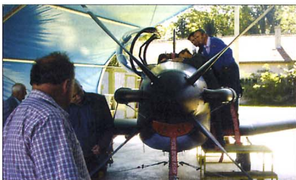
Letos so veterani vojne za Slovenijo in borci NOV obiskali letalsko bazo SV v Cerkljah ob Krki in Sedlarjevo.