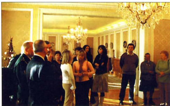
Minister za obrambo Karl Erjavec in minister za notranje zadeve Dragutin Mate sta pred prazniki v Vili Podrožnik pripravila sprejem za otroke in svoje padlih v vojni za Slovenijo.

94.680 tolarjev, in deležem premikov na družinskega člana. Po zakonu ga lahko prejemo le tisti, ki imajo priznan status vojnega veterana in so dopolnili 50 let ali so invalidi 1. kategorije, in je izključno namenjen