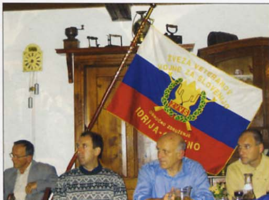
Udeleženci srečanja so podprli idejo o zbiranju dokumentarnega gradiva o dogodkih iz osamosvojitvene vojne ter o pripravi in izdaji Zbornika o poteku osamosvojitvene vojne na Idrijskem in Cerkljanskem.

za pogovor o tem, kaj lahko znotraj veteranske organizacije skupaj naredijo za ohranjanje spomina na dogodke, ki so v osamosvojitveni vojni potekali na Idrijskem in Cerkljanskem. Zbrani so podprli idejo o zbiranju dokumentarnega gradiva o dogodkih iz osamosvojitvene vojne ter o pripravi in izdaji Zbornika o poteku osamosvojitvene vojne na Idrijskem in Cerkljanskem.