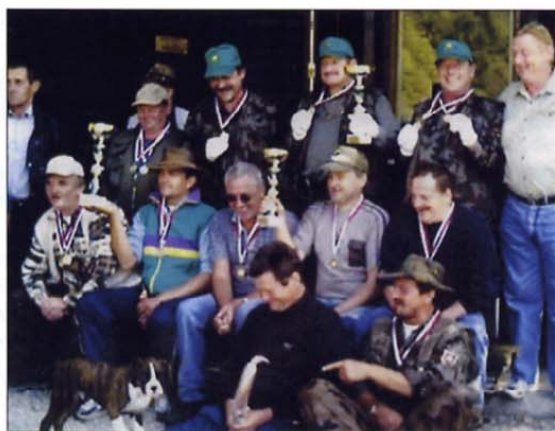
Koroški veterani so ob ribniku preživeli prijetne urice in nekaj je bilo tudi smeha. Zakaj? Uganite sami!