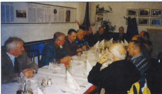
Zbrano denarno pomoč sta predsednik ZVVS in predsednik OZVVS Gornje Posočje trem prizadetim članom izročila 18. novembra.

Številna območna združenja so se na akcijo, ki jo je organiziralo predsedstvo ZVVS, odzvala in prispevala pomoč za prizadete. Pomoč so prispevala območna združenja ZVVS Radovljica - Jesenice, Trbovlje, Domžale, Kranj, Maribor, Krško, Gornje Posočje, Šmarje - elje, Gornja Radgona, Slovenske Konjice, Mežiška dolina, Bela krajina, Ruše in Dolenjska. Skupaj se je na računu zbralo 512.000 tolarjev.