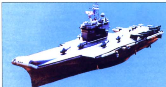
Ena od možnosti, kakšna naj bi bila nova indijska letalonosilka.

Prvotno je Nemčija načrtovala, da bo Poljski podarila 23 migov-29, vendar je bil eden v takšnem slabem stanju, da so ga raje podarili Nemškemu letalskemu muzeju. Poljaki tudi načrtujejo, da bodo januarja 2007 dobili že prvih 6 od 48 večnamenskih bojnih letal vrste F-16 C/D block 52 M+, ki jih izdeluje ameriška družba Lockheed Martin. Ameriška letala bodo prišla na Poljsko nekaj mesecev pozneje, kot so pričakovali. Z njimi bodo verjetno nadomestili ruska leta mig-29. Strokovnjaki menijo, da bodo prvega od treh skvadronov, ki bodo opremljeni z F-16, dali v operativno uporabo šele leta 2009 ali celo 2010.