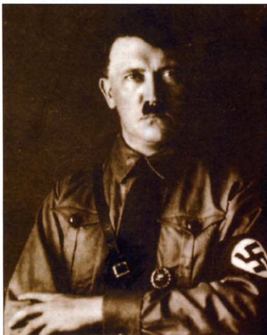
Po petih letih vojne je Hitler postal paranoičen samotar in zasvojenec z zdravili. Vse to je vplivalo na njegove odločitve v vojni.

Ko je Hitler poslušal slabe novice o dogajanju na vzhodni fronti, je moral Stauffenberg izročiti aktovko z bombo Keitlovemu pribočniku. Prosil ga je, naj mu določi sedež čim bližje firerju, da ga bo lahko slišal.