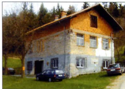
Danes veterani zgradbo posodablajo, predvsem pa ji želijo vdihniti novo vsebino.

streho na šoli, ki je zdaj spet zaščiten pred vremenskimi vplivi. Zamenjali so stara stikala in vtičnice, uredili sanitarije in položili nove keramične ploščice na zidu v kuhinji. Poleg občinskih sredstev vlagajo v objekt tudi svoja finančna sredstva, predvsem pa