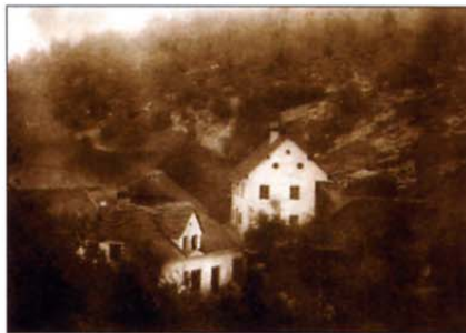
Posnetek nekdanje gozdarske hiše je nastal še pred prvo svetovno vojno.

Po drugi svetovni vojni je bila šola oktobra 1952 zasilno obnovljena in pouk se je spet lahko začel. Zaradi odseljevanja vaščanov in upadanja števila rojstev so šolo leta 1971 zaprli. Zgradba je potem samevala in so jo upo-