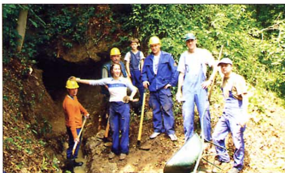
Rudarji pred vhomom v zapuščen rudnik svinca in cinka