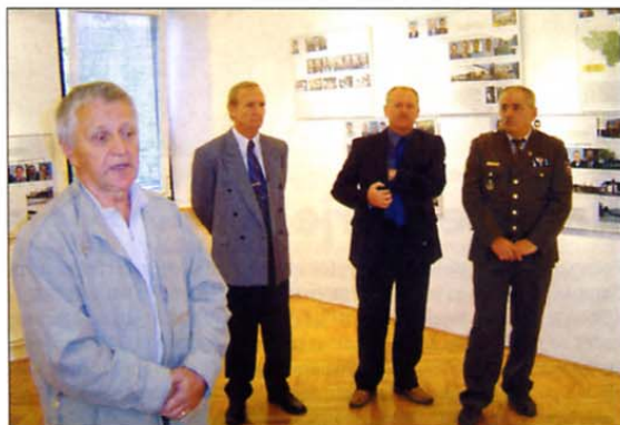
Z odprtja razstave Uporniki z razlogom, ki je bila od 4. do 20. oktobra v Revirskem muzeju v Trbovljah.