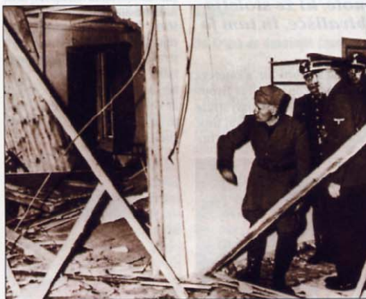
Two uri po neuspešnem atentatu je Hitler sprejel italijanskega diktatorja Benita Mussolinija. Peljal ga je v razdejano barako in mu pokazal, kje je stal. Mussolini se je strinjal, da je preživelje znamenje, da je usoda na njegovi strani.

V Berlinu je še naprej krožila novica, da je Hitler preživel. Stauffenberg je menil, da bi zarotnikom lahko uspelo, če bi odločno ukrepal. Okoli 17.30 je ukazal aretirati ministra za propagando dr. Josepha Goebbelsa. Pripril naj bi ga poveljnik berlinskega stražarskega bataljona »Grossdeutschland« major Otto-Ernest Remer. Ta je odšel v Goebbelsovo vilo, ki je bila izven območja vladnih poslopij. Toda telefonske zveze Hitlerjevega ministra so delovale normalno. Goebbels je poklical Hitlerja in izročil služalko Remerju. Hitler mu je dejal, da so ga skušali ubiti, toda on je živ. »Govorim vam kot vrhovni poveljnik. Ukazujem vam, da v Berlinu znova postavite red. Uporabite vso potrebno silo. Če se bo kdo upiral, ga ustrelite.«