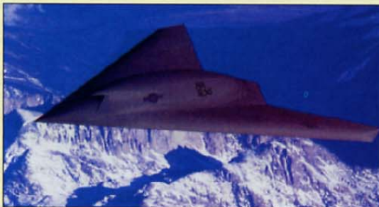
Risar si je tako zamislil letalo X-47 C. Slika: Boeing

Rusko obrambno ministrstvo je sporočilo, da je jedrski arzenal njihove države na varnem. To je povedal predstavnik ministrstva po vaji, ki je potekala v severni Rusiji in na kateri so vadili ukrepe ob morebitni nesreči ali terorističnem napadu na ruske vojaške jedrske zmogljivosti. Rusko obrambno ministrstvo pravi, da so njihove jedrske zmogljivosti dobro zavarovane in do zdaj še ni bilo terorističnega napada na njih