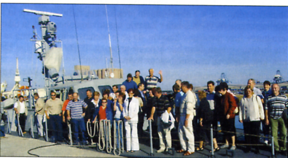
Ena od skupin veteranov na obisku pri Slovenski vojski - na ladji Ankaran