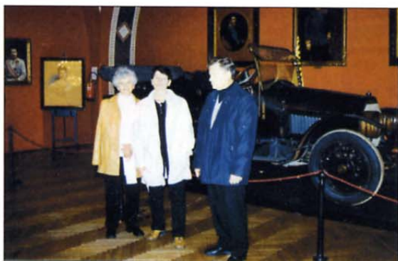
V muzeju je tudi avtomobil avstrijskega prestolonaslednika nadvojvode Ferdinanda, na katerega je v Sarajevu streljal Gavrilo Princip.