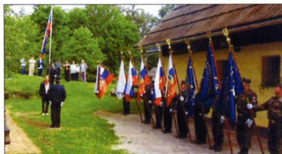
Udeleženci srečanja so se razšli zadovoljni in z ugotovitvijo, da so praporščaki Koroške pokrajine dobro usposobljeni ter da na vseh prireditvah vzorno zastopajo območna združenja, ki jih predstavljajo.