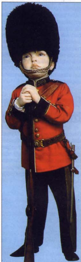
Princ Artur Connaughtski kot otrok v uniformi grenadirske straže leta 1885

visnosti v vojni. Nastanjeni so bili v Londonu in so bila edina disciplinirana enota ljudi, ki je bila na voljo oblastem, opravljali pa so naloge od dušenja nemirov, gašenja požarov do izvajanja policijskih nalog. Ta trenutek sestavlja britansko kraljevo gardo pet polkov. Poleg treh, ki imajo večstoletno tradicijo, sta v njeni sestavi tudi dva nova polka. Nova! Seveda je to relativna trditev, saj imata oba že skoraj stoletno tradicijo. Prvega, ki se imenuje Irish guards (irska straža), je v čast pogumnih Ircev, ki so se izkazali v vojni z Buri na jugu Afrike, ustanovila kraljica Viktorija, kralj George V. pa je leta 1915 ustanovil še Welsh guard (valežansko stražo). Teh pet polkov skupaj z The Household cavalry (domačo konjenico), The life guards (telesnimi stražarji) in Blues and royals (Modrimi in kraljevskimi) sestavlja The household division (domačo divizijo).