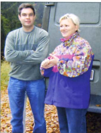
Zadovoljna po razdelitvi hrane

Glede na to, da je od takrat minilo že 14 let, se zgodovinski dogodek čedalje manj omenja v javnosti, prebivalci kočevsko-ribniške doline pa se zavedajo takratne potrebe po prvem postroju enote.