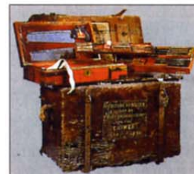
Kirurški pribor, ki so ga uporabljali v krimski vojni.

Kraljičina straža pred Buckinghamsko palačo se v spomladanskih in poletnih mesecih menjava