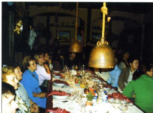
Miklavževanja se udeležujejo tudi drugi svojci padlih v vojni za samostojno Slovenijo.