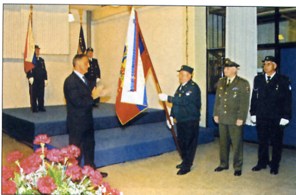
Zdaj ima svoj prapor tudi OZVVS Sevnica.