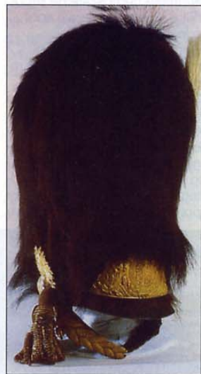
Kapa iz medvedje kože, ki jo je nosil yorkshirski vojvoda kot polkovnik Grenadier Guards v letih od 1805 do 1827.