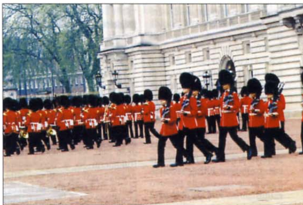
Menjava straže pred Buckinghamsko palačo je velika paša za oči.

prej najdete prostor, s katerega boste lahko opazovali ta živopisan dogodek. Na menjavi straže se včasih zbere tudi nekaj tisoč radovednih obiskovalcev z bri-