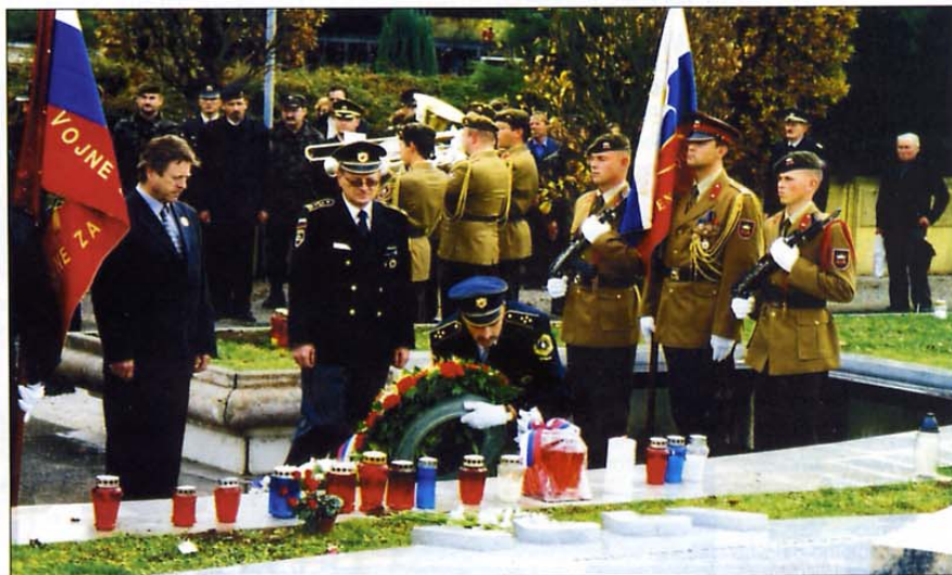
Padlih miličnikov in drugih se je z vencem spomnila tudi delegacija Veteranskega združenja Sever.