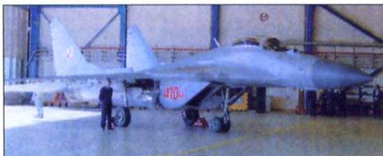
Letala mig-29, ki jih je Nemčija podarila svoji vzhodni sosedji, so že na Poljskem.

V začetku avgusta je poljsko vojaško letalstvo prejelo zadnjih devet letal vrste mig-29, ki jih je svoji vzhodni sosedji podarila Zvezna republika Nemčija. Ta je ruska bojna letala »podedovala« od Nemške demokratične republike, ko sta se državi spet združili. Berlin je Varšavi podaril 22 migov in zanje zahteval simbolično plačilo – 1 evro. Prvih pet letal je na Poljsko prispelo 30. septembra 2003, kjer so jih namestili v oporišču poljskega vojaškega letalstva v Bydgoszczu, ki ima oznako WZL 2. Medtem so se v drugem oporišču poljskega vojaškega letalstva