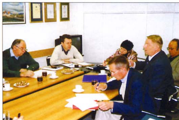
Utrinek s seje komisije za statutarne, finančne in organizacijske vprašanja.

V tem času je bilo precej dela s sestavljanjem programa in koledarja ZVVS za leto 2005. V objavljenem koledarju so naštevale samo tiste dejavnosti, ki jih bo organizirala ZVVS, zbiramo pa tudi podatke o programih