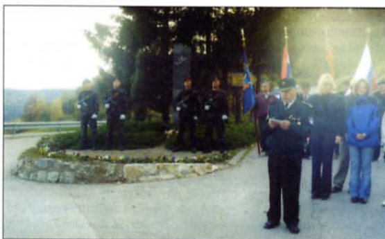
Utrinek s komemoracije na Svetini