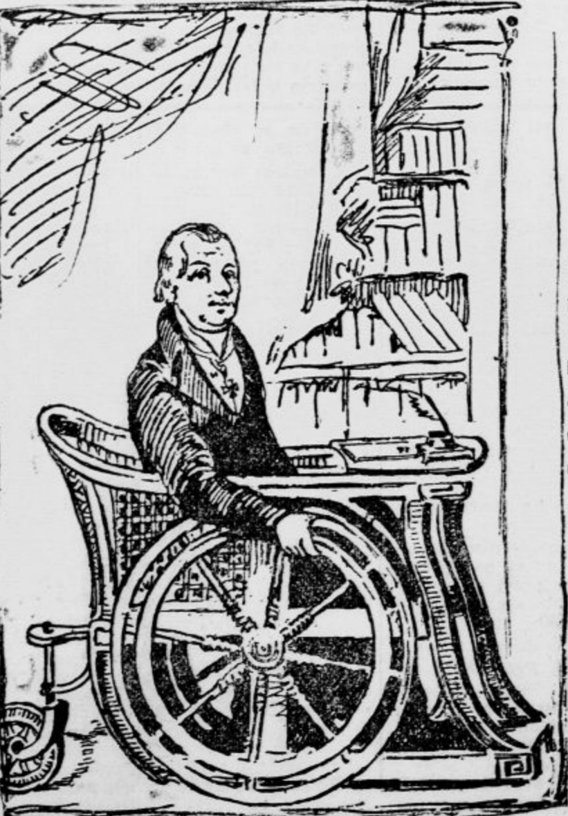
Baron Žiga Zojs, velik prijatelj in podpornik slovenskega slovstva in kulture v Prešernovih časih. Njegovo mecenstvo zaman išče plemenitih posnemovalcev med bogatimi meščani v današnjih dneh