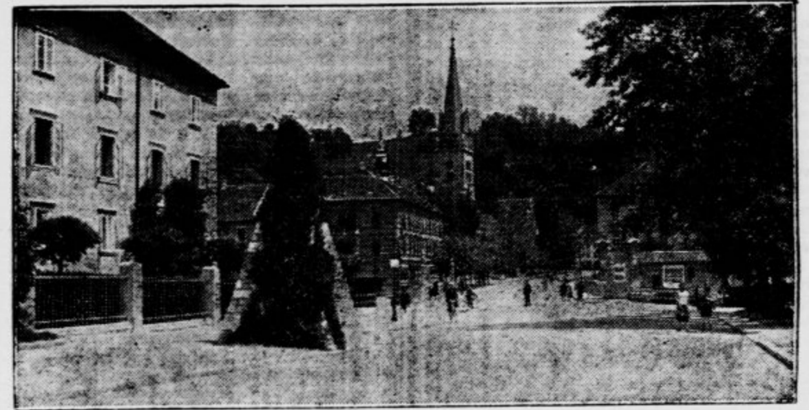
Vogal Zojsove palače s spominsko piramido, v ozadju Šentjakovski trg

okrajni glavar in svetnik, živel potlej v Gorici, kjer je tudi umrl. Studiral sem gimnazijo v Ljubljani in Gorici ter stopil v Terezijanišče na Dunaju, internat za plemiške sinove, ustanovljen od Marije