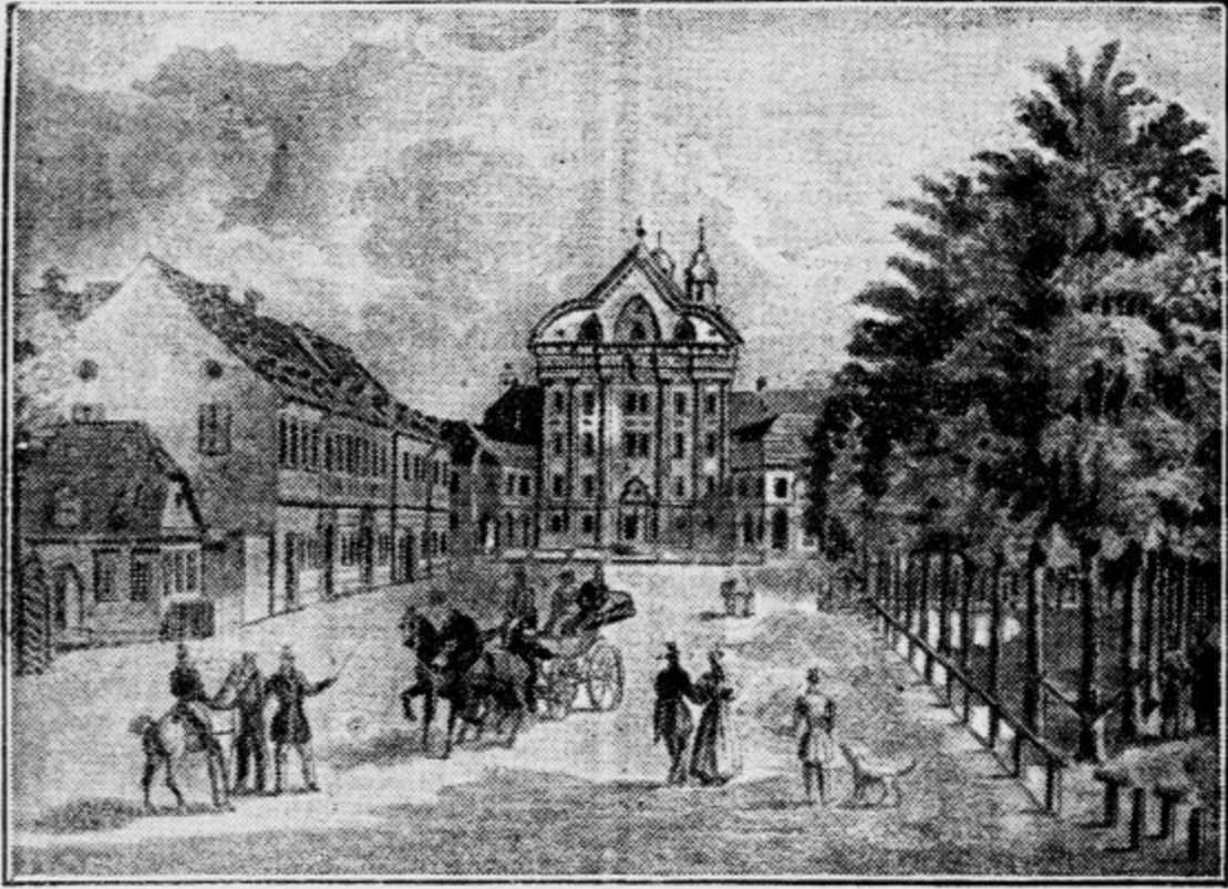
Kongresni trg stare fevdalne Ljubljane

Pa to so v glavnem samo nekatere važnejše in uglednejše družine, ki so dajale Ljubljani in vsej slovenski deželi pred sto, dvesto in še več leti svoj plemiški pečat in sijaj.