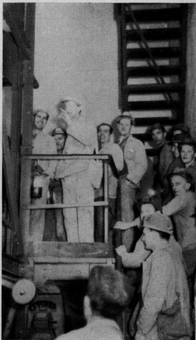
Naši rudarji pred spustom v globino