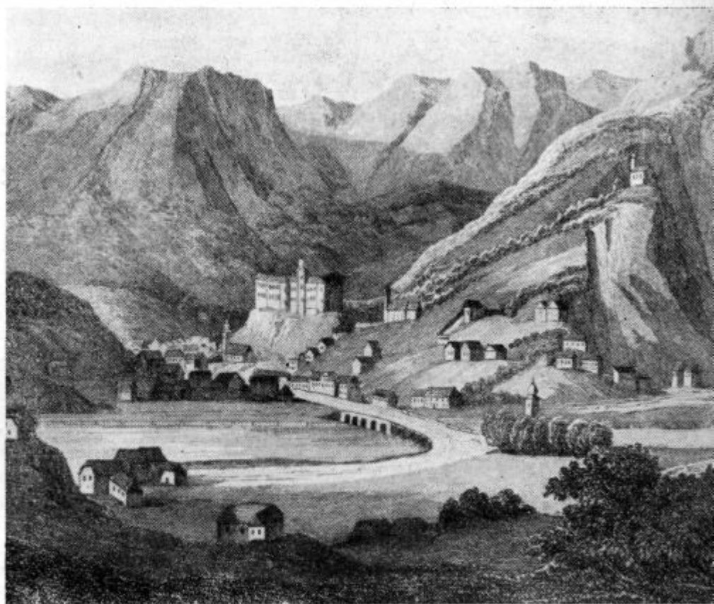
Idrija okoli leta 1785