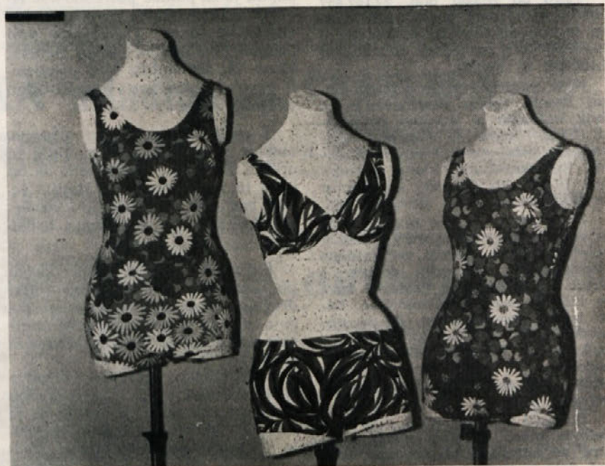
Ženske kopalke, ki so v tej sezoni osvojile tržišče

Malo je tovrstnih proizvajalcev, ki bi imeli v svojih kolekcijah tako obsežen sestav izdelkov. Od kvalitetnega bombaža, prefinjenega velurja za perilo in vrhnja oblačila do izdelkov iz najlon šarmesa, lepe gladke elastične helanke in helanke v vzorcu čipkastega rašel pletiva, žakardnega pletiva in raznih tiskanih velurjev in helanke, skratka