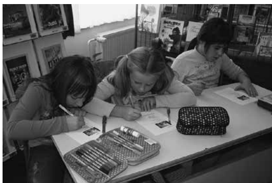
Slika 3: Povratna informacija učitelju