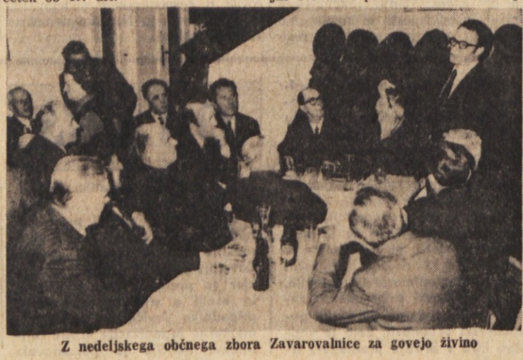
Z nedeljskega občnega zbora Zavarovalnice za govejo živino

Nedeljska številka milanskega gospodarskega dnevnika «Il Sole-24 Ores», poroča, da sta se tržaška industrija «Veneziani Zona Vernice» in podjetje «Zorka» in Šabca v Srbiji dogovorila o medsebojnem tehničnem sodelovanju pri proizvodnji barv in lakov v Jugoslaviji. Tržaška družba naj bi pripravila načrt za novo