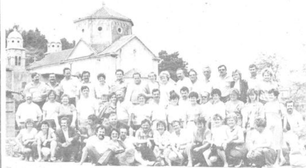
Vedno lepa Dalmacija in velenjski darovalci krvi na ekskurziji