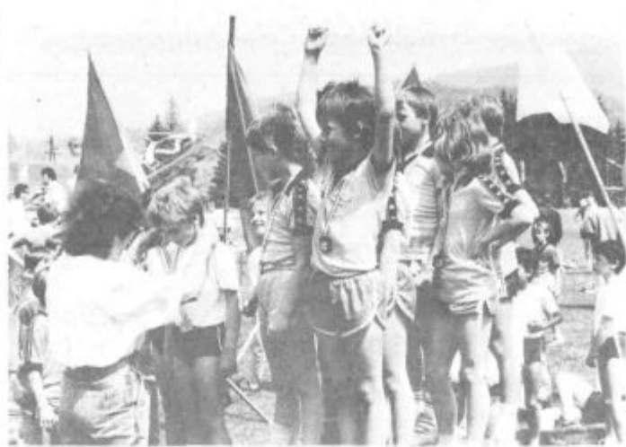
Učenci prvih in drugih razredov so se preizkusili v štafetnih tehnikah. Takole veseli pa so bili najboljši.

Devet pionirk je s šopki rož steklo proti izhodu in jih poneslo k Titovemu spomeniku v središču mesta. Pridružila sta se jim planinca iz Sarajeva, ki sta se po-