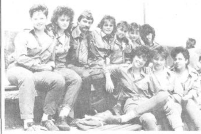
Mladinke Škal so bile vesele uspeha