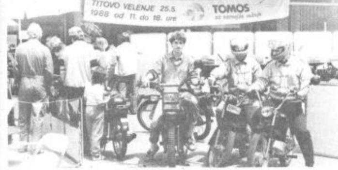
Spretnostna vožnja (morda pa mikavne nagrade?) je pritegnila mnogo tekmovalcev.

Akcija je potekala pred AMD na Prešernovi cesti in je bila za vse, ki so se je udeležili izjemno doživetje. Obisk je bil nad vsemi pričakovanji in po mnenju organizatorjev je akcija povsem uspela. B. Mugerle