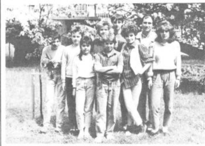
Po pogovoru še slikanje. Kje drugje kot pred lipo, ki so jo posadili v spomin na nepozabno srečanje.