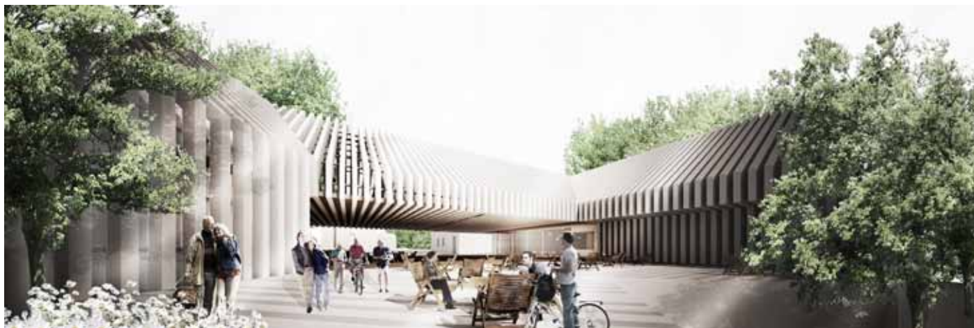
Slika 5: Križevci, notranje dvorišče [Laura Mercina, Neza Novak].