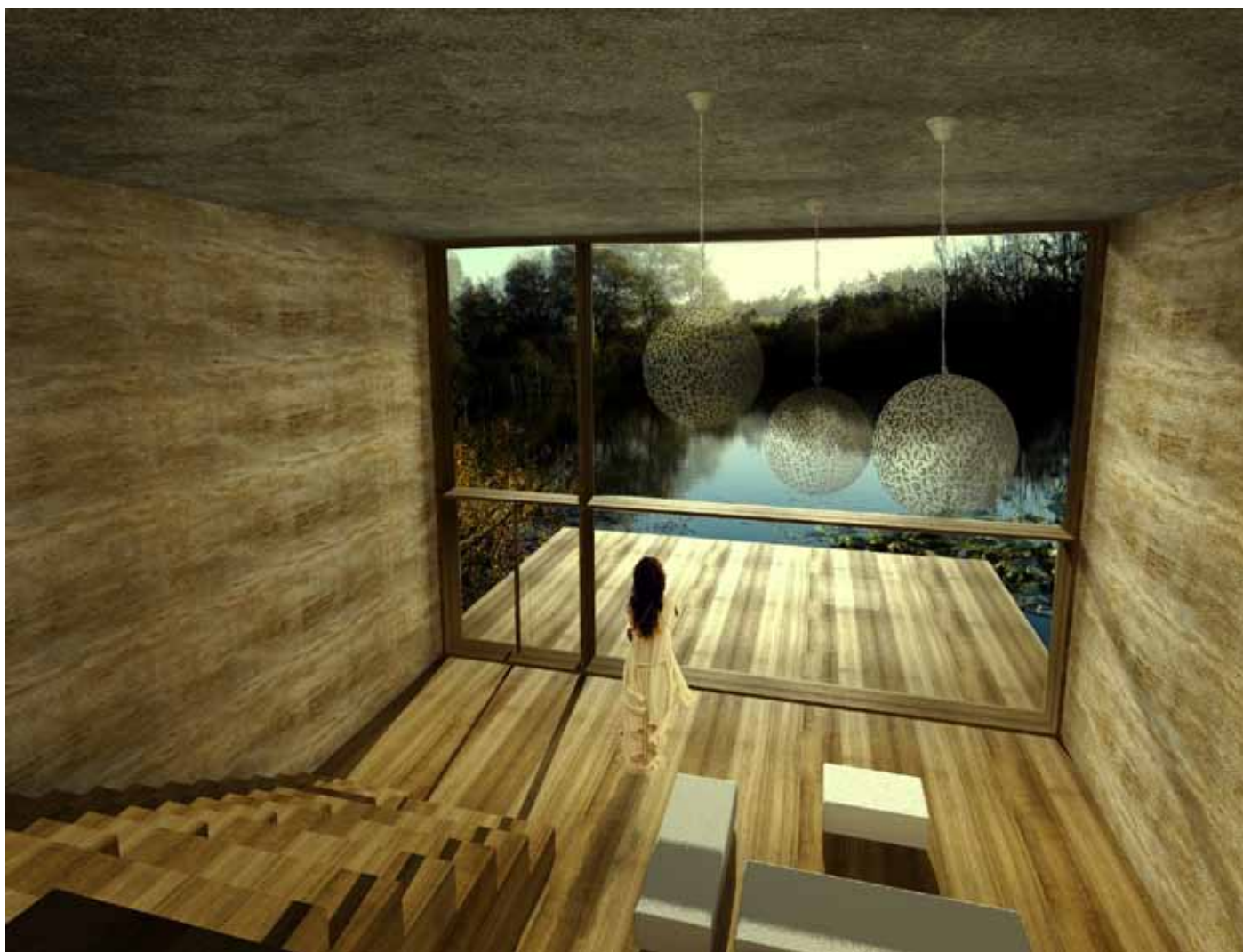
Slika 4: Križevci, vizualizacija notranjosti [Danica Sretenovič].