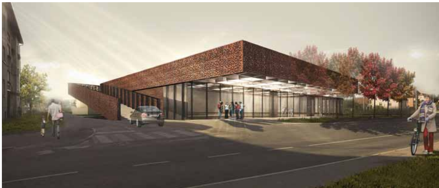
Slika 1: Križevci, vizualizacija [Rok Staudacher].

v delu Slovenije, ki ima dobro ohranjeno stavbno dediščino. Zaradi nahajališč glin in s tem povezano proizvodnjo, ima kulturna krajina še danes prepoznavno podobo, ki temelji na uporabi opeke. Opisano dejstvo so udeleženci delavnice uspešno uporabili za oblikovanje niza povsem sodobnih objektov. To so stavbe, ki zagotavljajo dolgoročni razvoj kraja a hkrati nadaljujejo stoletja dolgo tradicijo območja, kjer se nahajajo.