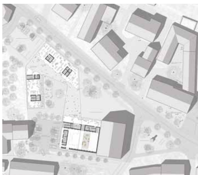
Slika 8: Križevci, situacija parterja [Eva Rajster, Gregor Turnsek].