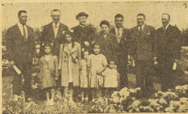
P. Juan entre los compatriotas en Río Gallegos en el parque principal. Med rojaki v Río Gallegos 3. februarja.

Po planjavi so se podili noji in ovce; sem pa tja kak vodni mlin oznanja človeško bivališče; nizki grički, z vrhom črnim kot oglje, menda sami ugasli volkani, vsiljujejo človeku misel na pogorišče. Čudno, da ni drevja, ko je menda vendar deževja dovolj, tako sem umoval, a pri obmejni stražnici sem kmalu doumel zakaj. Ko sem stopil iz auta, mi je silovit veter pognal v obraz deževne kaplje kot z bičem, da me je skoraj