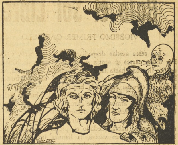
Las manos de Rado temblaron . . . El dolor se reflejó en su rostro . . .

Pero Rado no olvidó a Liubíniza. Desde lejos observaba a Iztok y Radován. La incertidumbre, el temor y la esperanza llenaban su alma. Esperó, miró, sus pies comenzaron a