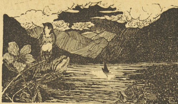
Un idilio del amanecer en Eslovenia.

En 1848 recién se interesó por ese lugar también la autoridad religiosa que levantó allí una capilla, donde por lo menos pudo celebrarse la misa, pero ya iban preparándose