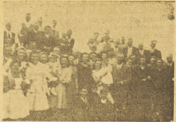
Ob priliki krsta pri Sirku Nute v Rosariju, zbrala se je vesela družba Bricov in rojakov ter sosedov.

Si no han sido tan malos como para colocarse junto con los expresos enemigos de Dios, tampoco hicieron nada para apoyar las cosas religiosas, para defender a la Iglesia, para apoyar el triunfo de la causa de Dios. La indiferencia, la tolerancia, el no querer provocar, son frases con las cuales trataban de disculpar su inacción. No querían comprender la palabra de Jesús: "Quien no está conmigo está contra Mí. Quién no recoge conmigo, dispersa".