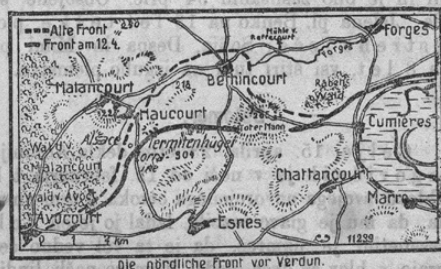
Die nördliche Front vor Verdun.

Z ozirom na zadnja uradna poročila o velikanskih bojih okoli Verduna prinašamo danes mali zemljevid, ki predstavlja severno fronto pred Verdunom.