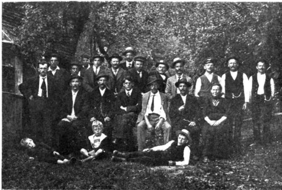
Člani škofjeloške čebelarke podružnice l. 1921

ni bilo nikogar, da bi skrbel zanje. Društveno življenje je popolnoma zamrlo, ker čebelarji niso hoteli sodelovati z okupatorjem. Ta je sicer nudil sladkor proti oddaji medu. Sladkor so čebelarji jemali, a oddajo medu odlašali iz leta v leto z izgovorom na slabe letine. Vse delo, kolikor ga je bilo, je vodil tov. Noč. Skrbel je, da se je dobil sladkor, oskrboval in prikrival čebele partizanov, da jih niso zaplenili Nemci in tako rešil marsikateri panj čebel.