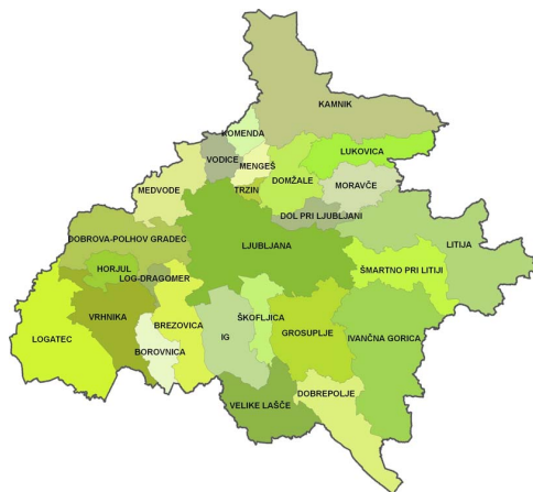
Slika 3: TURAS Web GIS Ljubljana vsebuje podatke za vse občine (LAU 2) v Ljubljanski urbani regij NUTS 3, ki vključuje 26 občin.

Namen DP 1 je vzpostavitev geografskega informacijskega sistema (GIS) in podatkovnih struktur za podporo drugim delovnim paketom (DP 2–6). DP 1 je ogrodje projekta in zagotavlja javni dostop do podatkov. GIS omogoča vizualizacijo in hkrati razumevanje urbanih procesov ter je temelj za povezovanje med vključenimi partnerji. TURAS GIS je javno dostopen podatkovni sistem, povezan s spletnimi stranmi sodelujočih mest, in se razvija v odvisnosti od potreb v drugih delovnih paketih. Vodilni partner DP 1 je University College Dublin (Irska).