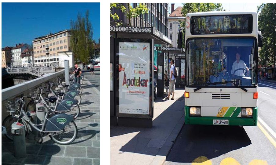
Slika 6: Trajnostna mobilnost v Ljubljani: levo – Ljubljanski bicikelj; desno – LPP: novi avtobusi na metansko gorivo.

Namen DP 4 je ustvariti kreativne vizije, prostorske strategije in podnebno nevtralne infrastrukturne rešitve (promet, voda, energija, odpadki itn.) ter pripraviti priporočila za zmanjševanje ekološkega odtisa in postopni prehod na nizko(nič)ogljivična mesta. Vodilni partner DP 4 je Free University of Amsterdam (Nizozemska). V okviru DP 4 UL FGG skupaj z RRA LUR in MOL pripravlja strategije in izvedbene projekte za trajnostno mobilnost in upravljanje voda (poplavalna varnost, kakovost voda) v mestu in regiji (sliki 6 in 7).