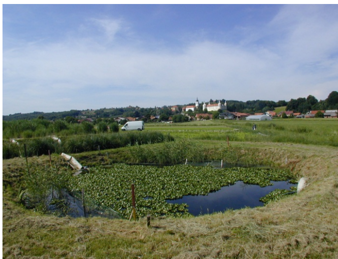
Slika 7: Ekoremediacijski objekt – poplavni zadrževalnik Podutik v Ljubljani (vir: Tjaša G. Bulc, 2009, osebni arhiv).