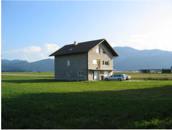
Slika 8: Razpršena poselitev v okolici Ljubljane.

Namen DP 5 je razumevanja prostorske, gospodarske in družbene preobrazbe mest pod vplivom procesov suburbanizacije. Cilj DP 5 je priprava priporočil za boljše upravljanje in obvladovanje mestnih območij ter negativnih učinkov (ne)načrtne rasti urbanih površin v vzhodni Evropi v primerjavi z zahodno Evropo (slika 8). Vodilni partner DP 5 je Varna Free University (Bolgarija).