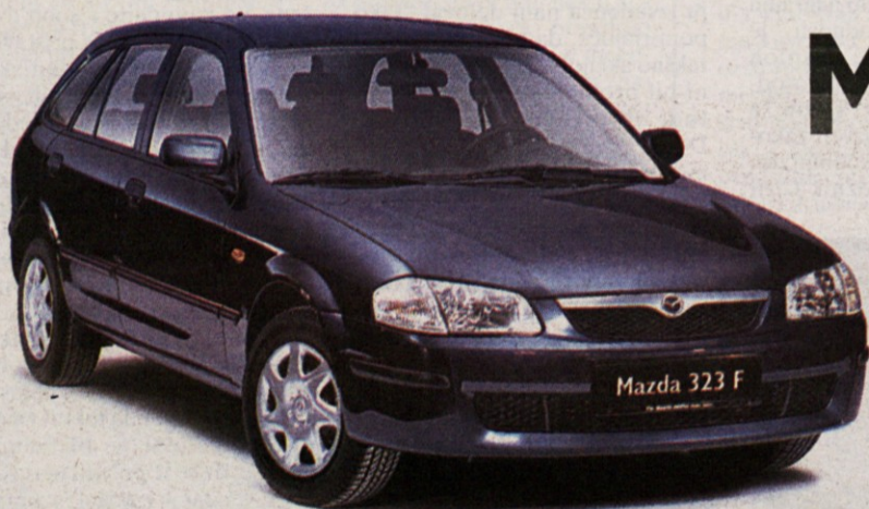
*Na sliki je Mazda 323F