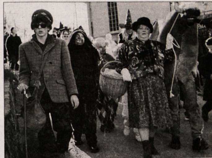
GOMELA GOTENSKA - Pustni sprevod z gotensko kamelo, ki je bila resnica na ljubo precej bolj podobna konjski kravi, so v Gotni vasi v Novem mestu v nedeljo pripravili prvič in temu primerna je bila kljub prekrasnemu vremenu skromna udeležba pustnih sem. Je pa prav, da so se gotenske maškare šle družno kazat po vseh ulicah te novomeške vasi. Saj tudi karneval v Benetkah ali Rio pravič ni bil tako velik, kot je zdaj.