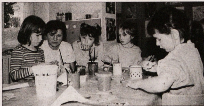
VRATA SO BILA ODRTA VSEM - Predpustni čas so malčki izkoristili za izdelovanje pustnih mask, verig, s katerimi bodo za pusta okrasili svojo igralnico, in za barvanje pobarvanke.

sredni bližini sodišča in zemljiške knjige, notariata ter tudi davčne uprave, ki se je odselila v Bršljin. I. V.