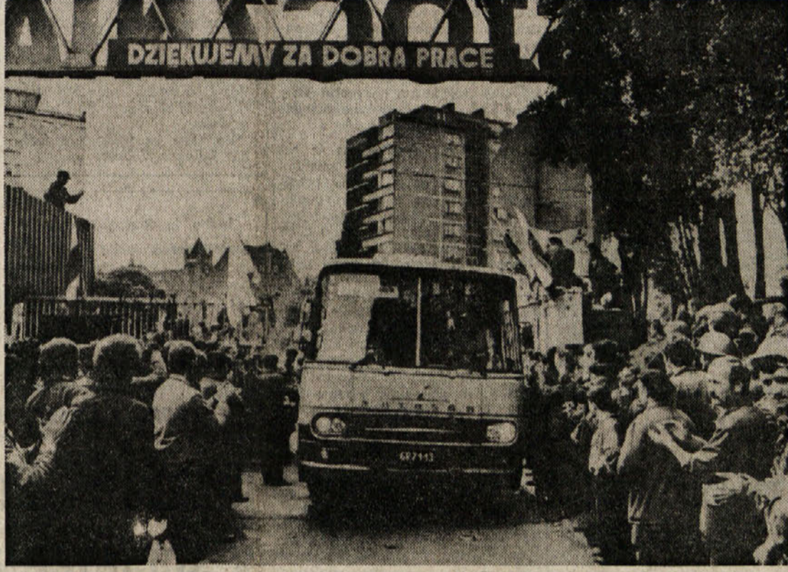
Delavci ladjedelnice Lenin so v nedeljo s ploskanjem sprejeli avtobus, s katerim se je pripeljala vladna delegacija na pogajanja z enotnim odborom stavkajočih

Pri pomirjujočih duhov je odigrala pomembno vlogo tudi poljska cerkev. Že v nedeljo je nadškof iz Gdanskija poudaril nujnost «dostojanstva in medsebojnega razumevanja» pri pogajanjih ter dejal, da je treba «končati s prekinitvami delala, če je to odvisno samo od delavcev. Tudi poljski primas kardinal Wyszyński je bil včeraj pomirjujoč in je dejal, da v trenutku, ko je prioriteta izključno na proizvodnji in ne na človeku pomeni to «sporočilo kapitalističnih idej, proti katerim smo se dolga leta borili. O zahtevi delavcev, da bi se Cerkev lahko posluževala sredstev javnega obveščanja pa je kardinal dejal, da «skofje ne morejo ne materialne» ne politične oblasti ampak prizadevajo le za širjenje udarnih vrednot, ki jih katoliška cerkev tudi Poljski, kajti «človek ne živi samo od vsakdanjega kruha».