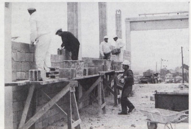
Ločni elementi in nosilci še niso niti postavljeni, zidarji pa že hite v Bos. Petrovcu zazidavati vrzeli med nosilnimi stebri z zidaki