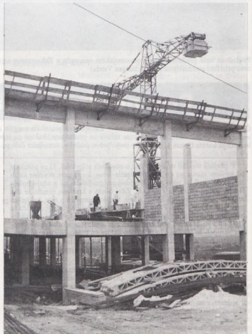
Eden izmed izsekov gradnje v Bos. Petrovcu, posnet na tistem delu res velike TOGREL dvorane, ki še raste iz tal

– s samoupravnim sporazumom o združitvi v podjetje se določajo primeri in pogoji, pod katerimi je delavec dol-