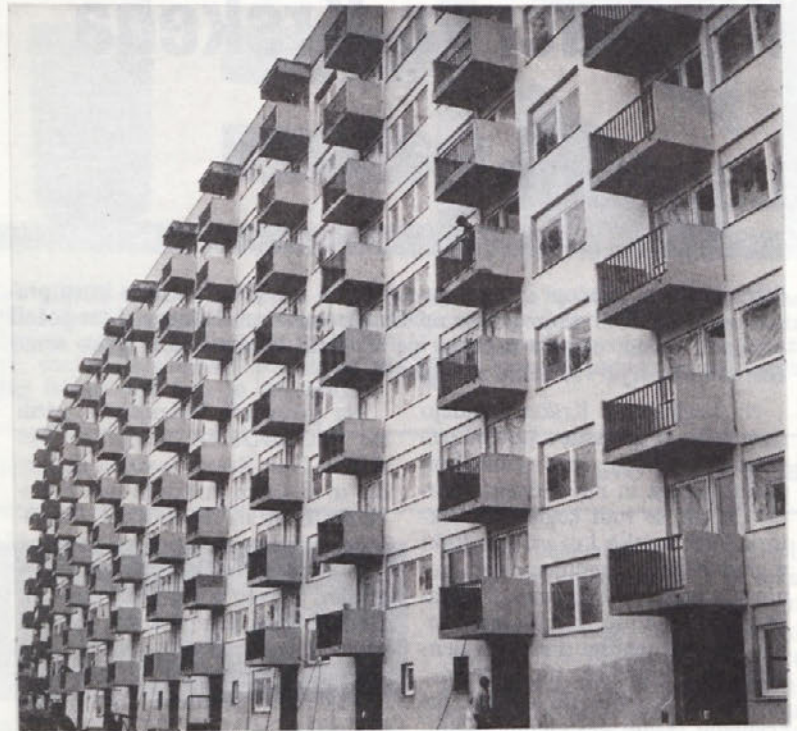
Pogled na del 130-stanovanjskega bloka UTRINA v Zagrebu, ki ga je zgradil sektor Krško

V Kulen Vakufu smo v sredi aprila predali naročniku Trikotajni tovarni BEBITRIKO togrel proizvodno dvorano v tlorisni površini 2600 m 2 . Tam smo opravili samo zemeljska dela in zmontirali betonski skelet, vsa ostala dela ( streho, tlake itd.) pa je prevzelo gradbeno podjetje iz Bihača.