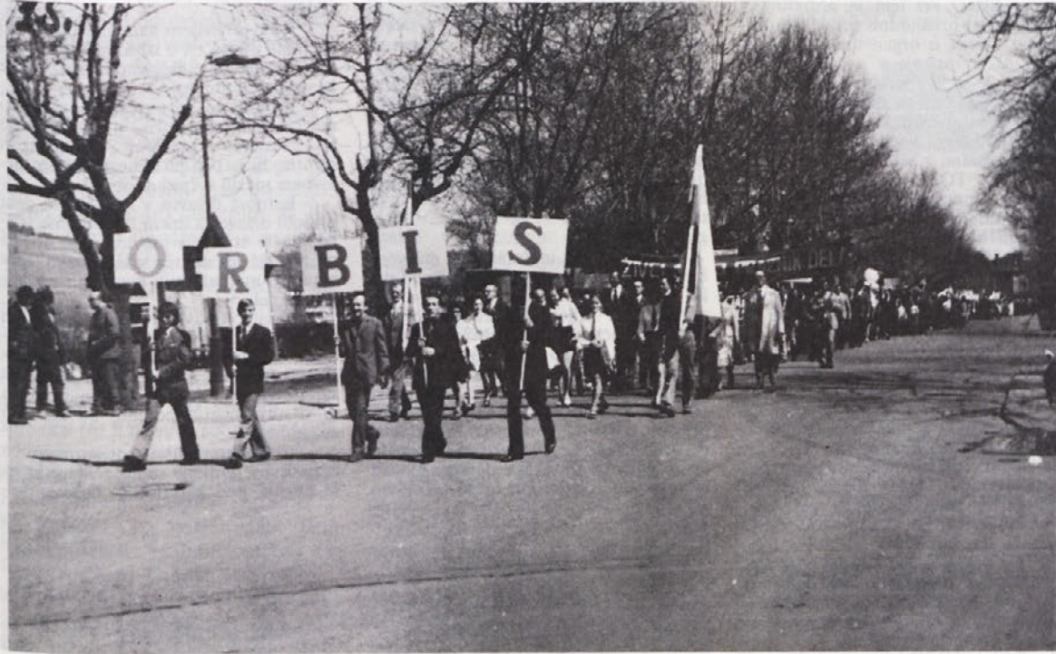
Pogled na naše predstavništvo v prvomajskem sprevodu v Zakopanem na Poljskem, kjer so bili PIONIRJEVCI zelo prisrčno pozdravljeni