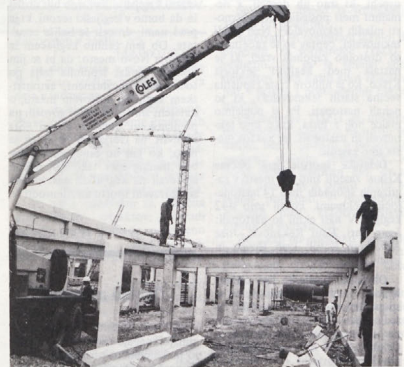
Proizvodna dvorana bodočega NOVOTEKSOVEGA konfekcijskega obrata na Vinici v Beli krajini hitro raste iz TOGREL elementov