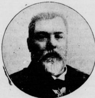
Admiral Nebogatov, poveljnik tretjega ruskega tihomorskega brodivja.