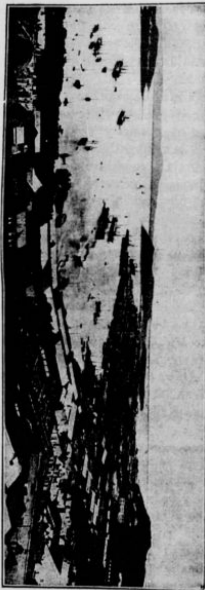
Pogled na Vladivostok.