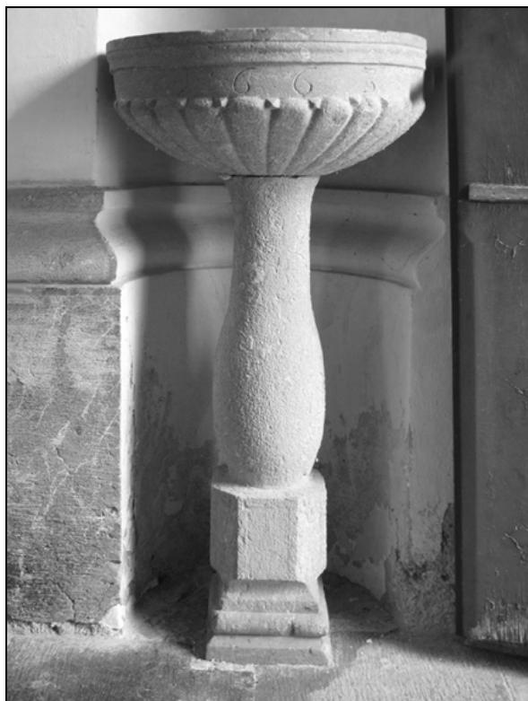
Kropilnik s školjkasto skodelo iz leta 1663.

gornji zidec. Streha je bila strma, prvotno verjetno krita s skodlami, kasneje morda že z opečno kritino.