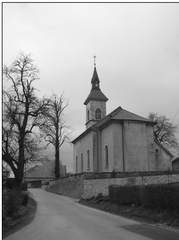
Pogled na cerkev sv. Marjete v Kočah z zadnje strani.