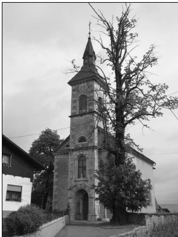
Pogled na cerkev sv. Marjete v Kočah od spredaj.