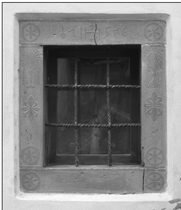
Okno v zatrepni fasadi hiše Pri Matjaževih v Kočah, na katerem so sklesane tudi take rozete kot na južnem obzidnem portonu pri cerkvi.

sta izbočeno izklesani okrajšavi Jezusovega in Marijinega imena: IHS in MRA. 13