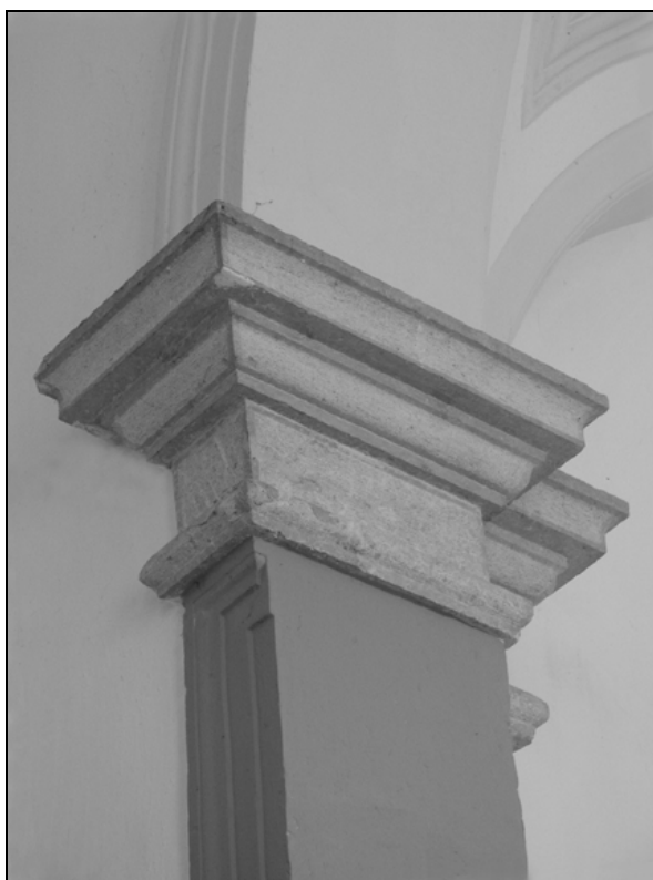
Detajla slavoloka: na levi strani baza s spodnjim delom pokončnika, na desni kapitel.