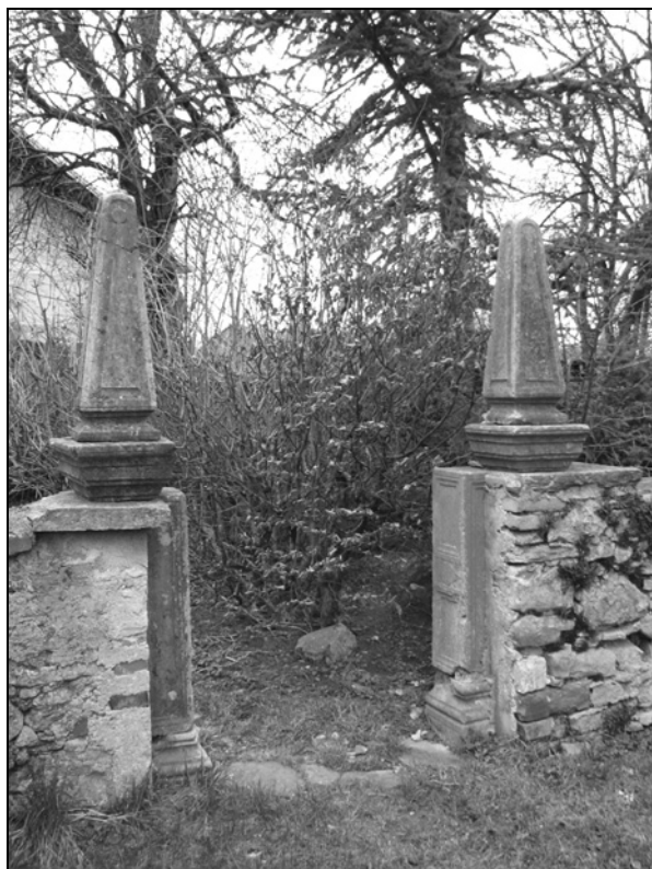
Obzidni porton na zahodni strani.