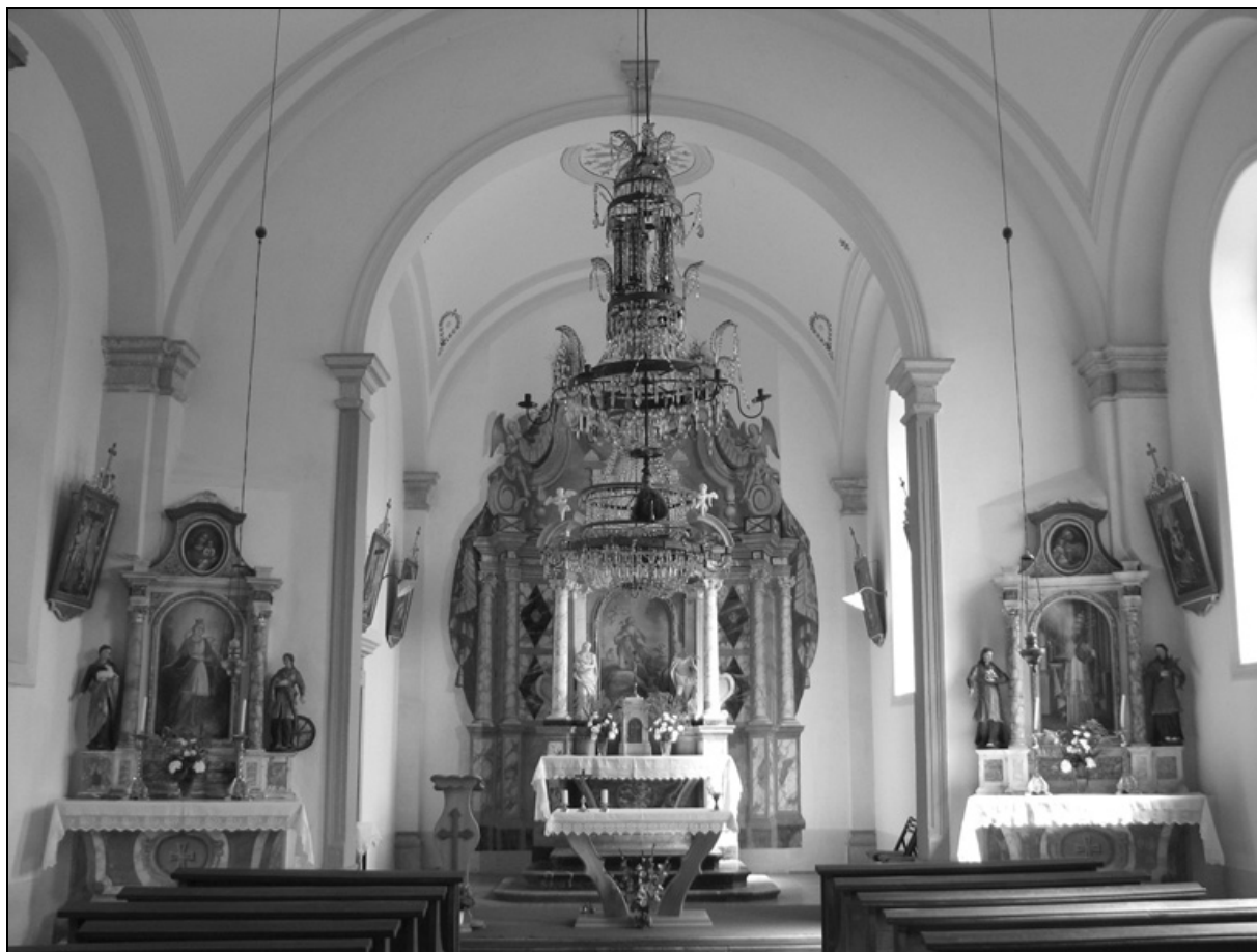
Prezbiterij s slavoločno steno.

prejel plačilo 352 goldinarjev. 38 Datiral ga je z naslikano letnico na ometanem hrbtu oltarja. Že precej prej, leta 1866, pa je slikar Štefan Šubic iluzionistično poslikal steno za oltarjem s stebriščem, volutno atiko, baldahinom in draperijo in tako povečal njegov vtis. 39 Stranska lesena oltarja stebrega tipa, ki sta bila izdelana leta 1856 v baročni tradiciji, sta postavljena v kotih ladje ob slavoločni steni. Na levi strani je oltar sv. Lucije, na desni oltar sv. Silvestra. 40