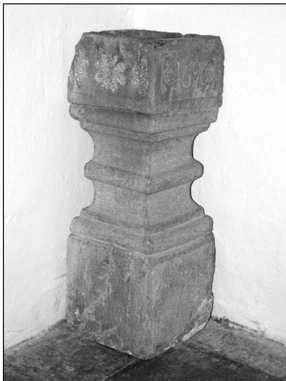
Pušica z letnico 1696, okrašena z rozetami.

Prezbiterij, ki je bil za stopnico višji od tlaka v ladji, je imel, kot rečeno, slavlolik iz klesanega kamna. Njegova pokončnika, ki sta bila obenem s profiliranima bazama, kapiteloma in sklepnim kamnom kasneje vgrajena v novi slavlolik, sta stopnjevito profilirana in v spodnjem delu okrašena z osemlistnima