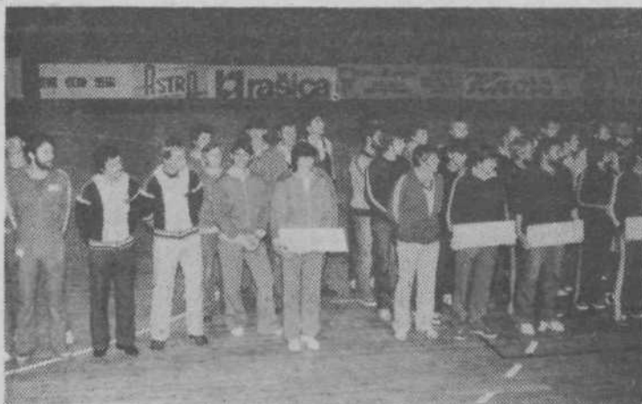
Svečan začetek VII. športnih iger ZPS v športni dvorani na Kodeljevem