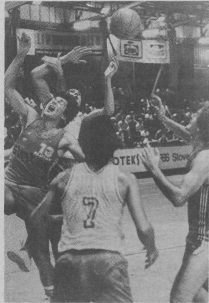
S finalne tekme Radnički — Slovan

Komisija za rekreacijo pri ZTKO Ljubljana Moste-Polje