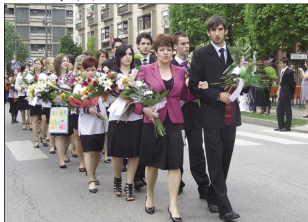
Slovo od gimnazije in mesta

»Gaudeamus igitur iuvenes dum sumus...« smo slišali v prejšnjih tednih pesem večkrat, saj so na Madžarskem potekale valete. Tudi na monoštrski gimnaziji so zapeli maturanti to pesem skupaj z drugimi. To leto sta se posljavljala dva razreda, 12. a in 13. b.