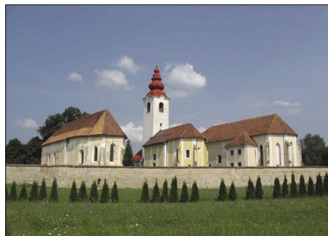
Tri fare – Rosalnice

eške samo en malo pred prvov bojnov so železnico zozidali. V šestdeseti-sedemdeseti lejtaj je industrija vsikder bole krepka gratala, depa je nej zavolé delavcov bilau, na delovna mesta so prišli lidgé z drügi republik Jugoslavije. Eške gnes skoro v cejloj Sloveniji Belokranjci najmenjšé plače majo.