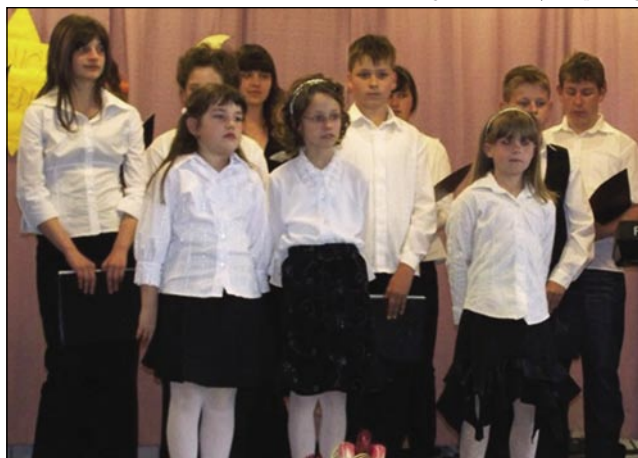
Šaularge so pozdravili mamice pa babice