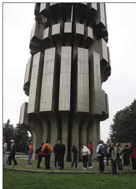
V nacionalnem parku Kozara

Pomurski aktiv Društva novinarjev Slovenije je 24. aprila organiziral enodnevni izlet v Bosno in Hercegovino, konkretno na območje Kozare, v Prijedor in Banja Luko. Tudi midve s sestro sva se prijavili, ker radi potujeva in je bila tudi dobra priložnost, da spoznava kolege in kolegice, ki delajo pri raznih medijih v Pomurju. Na Hrvaškem sva že bili, jaz sem bila še v Črni gori, v Bosni pa še ne, in naju je zanimal tudi ta balkanski svet, ljudje in življenje nasploh. Bosna in Hercegovina je kot pravijo dežela različnih kultur. Je multietnična država, v kateri živijo Bošnjaki, Srbi, Hrvati in pa druge narodnostne manjšine. Republiko BiH tvorita dve samostojni entiteti, Federacija Bosne in Hercegovine ter Republika Srbska.