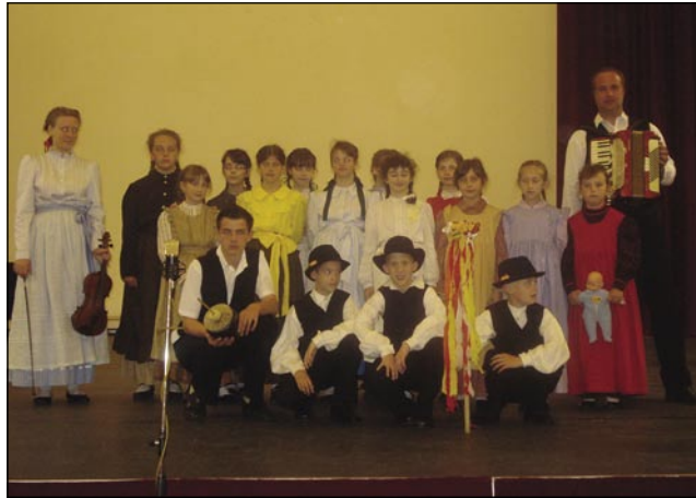
Na skupinskem kejpi se dobro vidi, ka mlajši majo lejpe nauve gvante

domau. Šofer se je pa oglaso iz Bohinja, kama se je odpelo, nej ka bi o tom kaj prle povedo. Pravo je ešče, ka prej pride po mlajše drugi avtobus, gda, de pa pauzvo po mobilnom telefoni. Tau je biu za vse velki šok. Kak si je šofer tau spoj dovollo?! Odpelo je tudi stvari, štere so mlajši pistili na busi. Tak se z lidami, ešče menje z malo decov ne dela. Užaljeni pa žalostni so bili mlajši, starejši so je malo pocartlali s kakšim sla-