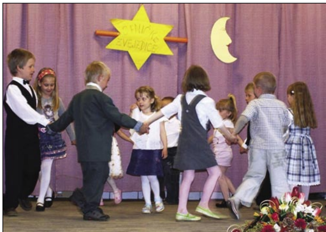
Malčki iz domanjoga vrtca

če..., Mi imamo zajčka... in Abraham ima sedem sinov. Leko smo čuli izštevank, potejm so pa pozdravili mamice z lejpimi pesmi. Na konci njenoga programa so