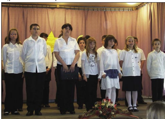
Pevski zborček seničke šaule

iz domanjoga vrtca. Bili so spoj lepau oblečeni, nasmejani in pridni. Program so meli v madžarskom, slovenskom in malo v nemškem geziki. Slovenski so zapeli M a r k o s k a -