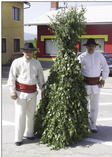
Zelenoga Jurija sprejavajo podje v bejlom gvanti

V Šentjerneji smo preminauči keden poslušali spejvati slovenske oktete, tak ka si zdaj gvüšno želejmo malo tüüče. Tau leko najležej najdemo v klauštri Pleterje , gde eške gnes živejo baratke, najbolje sigurno v cejloj katoličanski Materi Cerkvi. Kartuzijange, šteri cejli den nika ne gučijo, živejo v Sloveniji več samo v Pleterji. Nej davnik je klaušter svetiu šeststau lejt od svojoga