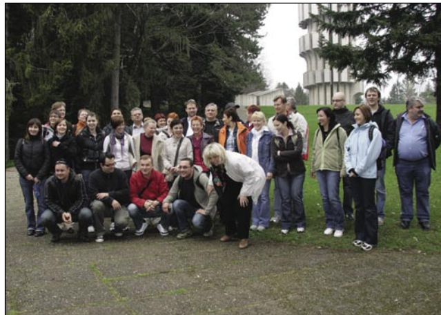
Skupinska slika z vsemi udeleženci izleta

to je precej razvito, v njem so zelo moderne stavbe in lepi, urejeni parki. V mestu imata sedež univerza in Državni zbor Republike Srbske.