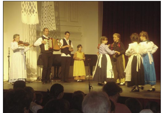
Goslare pa plesalci na odri

Na revijo je prišlo devet skupin. Števanovski so bili na vrsti ausmi. Tau so bile skupine od