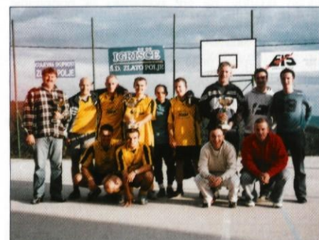
Najboljša ekipa na jesenskem turnirju

Ob koncu turnirja se je udeležencem zahvalil za sodelovanje in udeležbo podpredsednik društva ŠD Zlato Polje Janez Pogačar ter ekipe povabil na turnir tudi prihodnje leto.