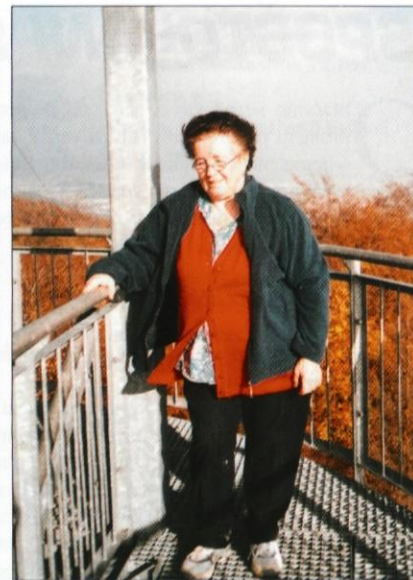
Ukčetova mama iz Obrš se je povzpela na 16m visok razgledni stolp (najstarejša udeleženka)