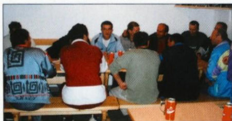
Ekipo Skočaja v prijetnem druženju z Zlatopoljci po končani tekmi

V iztekajoči jesenski nogometni sezoni so Zlatopoljci gostili ekipo podjetja Elektroinstalacije SKOČAJ iz Preserij pri