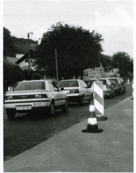
Delo na cest je povzročalo velike zastoje.

izvajalcem lotil ureditve preostalih črnih toč na stari magistralci, ki so v programu izgradnje avtoceste napisani kot nujni ukrepi za zagotovitev varnega prometa.