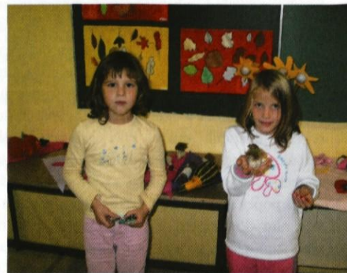
Poglej, kakšnega ježka sem izdelala!