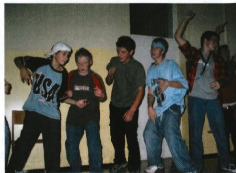
fantje v plesnem elementu.