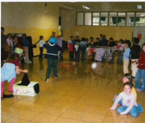
Vesele igre (obešamo perilo) na hodniku med odmorom.

V tednu otroka smo učitelji in mentorici šolske skupnosti za naše učence pripravili vrsto dejavnosti z namenom imeti se lepo, sproščeno, ustvarjalno in zabavno ter seveda malce drugače kot ostale dni v šolskem letu. Cilj nam je bil tudi potrjevati otrokova močna področja in krepiti občutek lastne vrednosti.