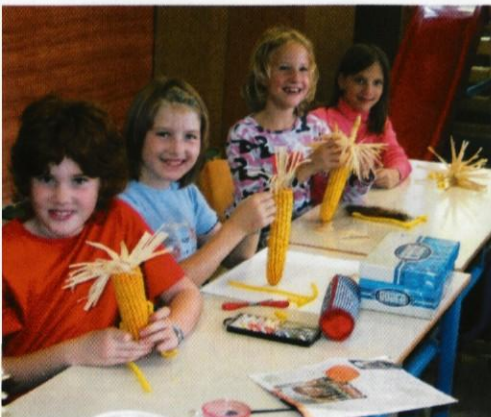
Ustvarjalne delavnice - jesenska dekoracija v OPB.

Zelo ustvarjalno in zanimivo je bilo cel teden v oddelkih podaljšanega bivanja, kjer so učiteljice pripravile USTVARJALNE DELAVNICE. Prva dva dni so učenci IZDELOVALI JESENSKO DEKORACIJO, nato so se URILI V IGRAH IN DRAMATIZACIJI, zaključili so z barvito jesensko RAZSTAVO IZDELKOV, ki vas vabi na ogled. Pridite!