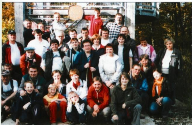
Zlatopoljski pobodniki ob stolpu na Rašici

krajši postanek, nato pa nas je pot vodila po strmini navzdol do gradu Jable, kjer nas je čakal avtobus in nato vožnja nazaj v Zlato Polje.