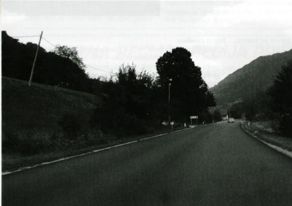
Cesta je obnovljena od Krašnje do konca Spodnjih Lok.