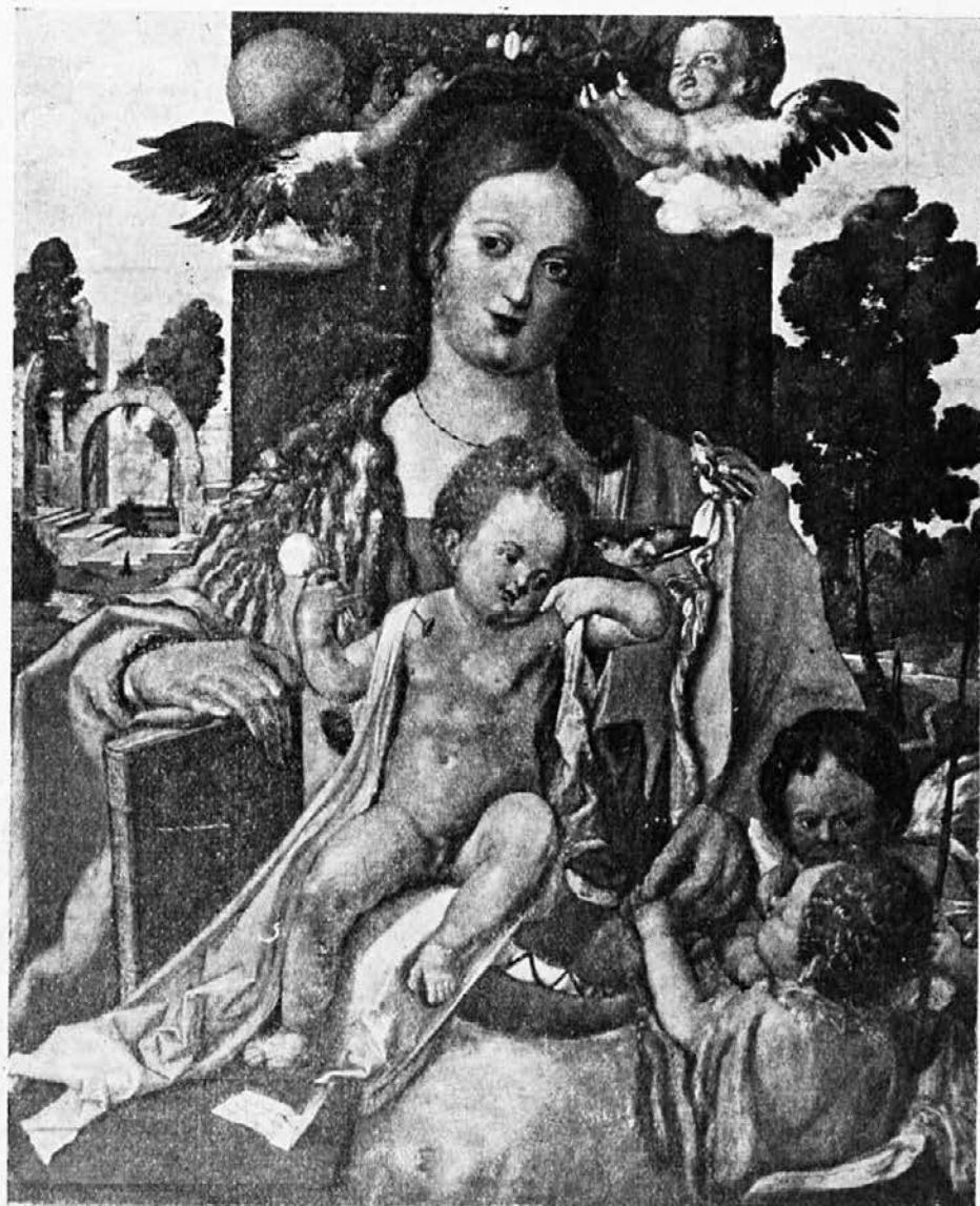
Albrecht Dürer: Madona s kanarčkom. (Muzej cesarja Friedricha, Berlin).