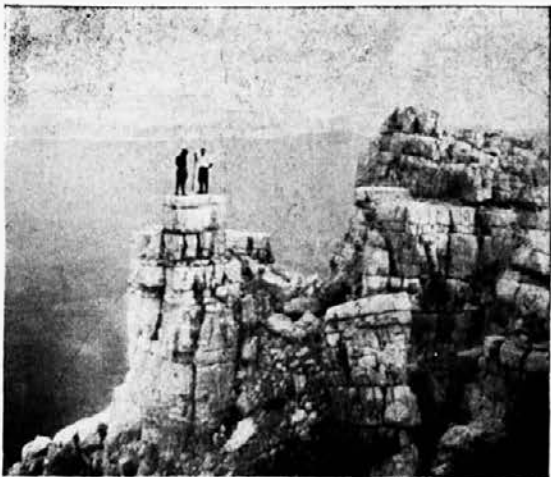
Čaven: Mala gora.

Publicist Forst Battaglia naznanja, da bo v svoji zbirki «Literature sedanjosti» v letu 1928. predstavil poljsko literaturo sedanje dobe. Brücknerjeve knjige o poljski literaturi so postale že nekoliko zastarele in ne zadostujejo več. Forst Battaglia je znan v evropskem časopisju kot pisatelj mnogoštevilnih člankov o moderni poljski literaturi, radi tega moremo pričakovati od njega zelo dobro pisano knjigo v tem področju.