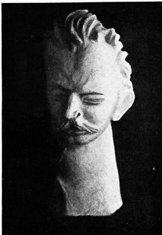
Veno Pilon: Ivan Cankar.