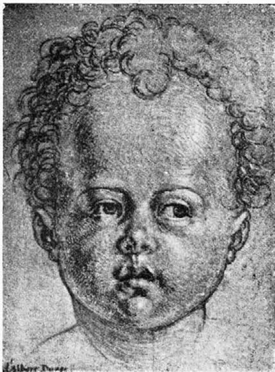
Albrecht Dürer: Glava otroka. (Louvre, Pariz).