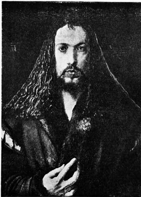
Albrecht Dürer: Lastni portret. (Stara Pinakoteka, Monakovo).