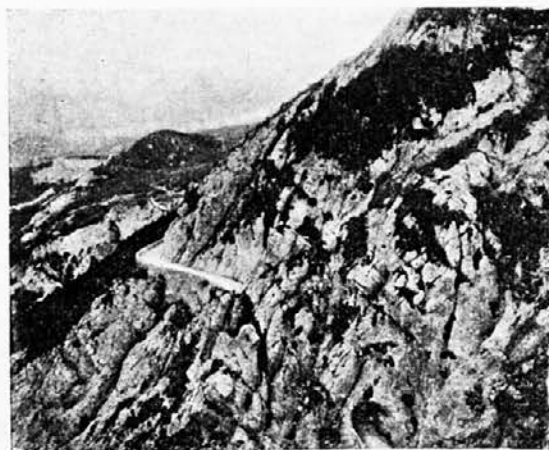
Gorska cesta na Dol nad Ajdovščino.

Razne izkušnje so me pogosto privedle do prepričanja, da more le taka inteligenca, ki je vzrasla na kmetih in se pozneje med nje povrnila, biti prava pionirka napredka in povzdige naših vasi, naše dežele, našega ljudstva, ker le ona more pravilno doumeti svojo vzvišeno dolžnost in postavljeno ji nalogo z uspehom rešiti. Ona je tudi v prvi vrsti poklicana, premostiti na videz nepremostljivi prepad med našo meščansko inteligenco in našim kmetom. Dani so ji vsi pogoji tega posredovanja, le da jih ne izkorišča vselej v dovoljni meri. (Dalje prih.)