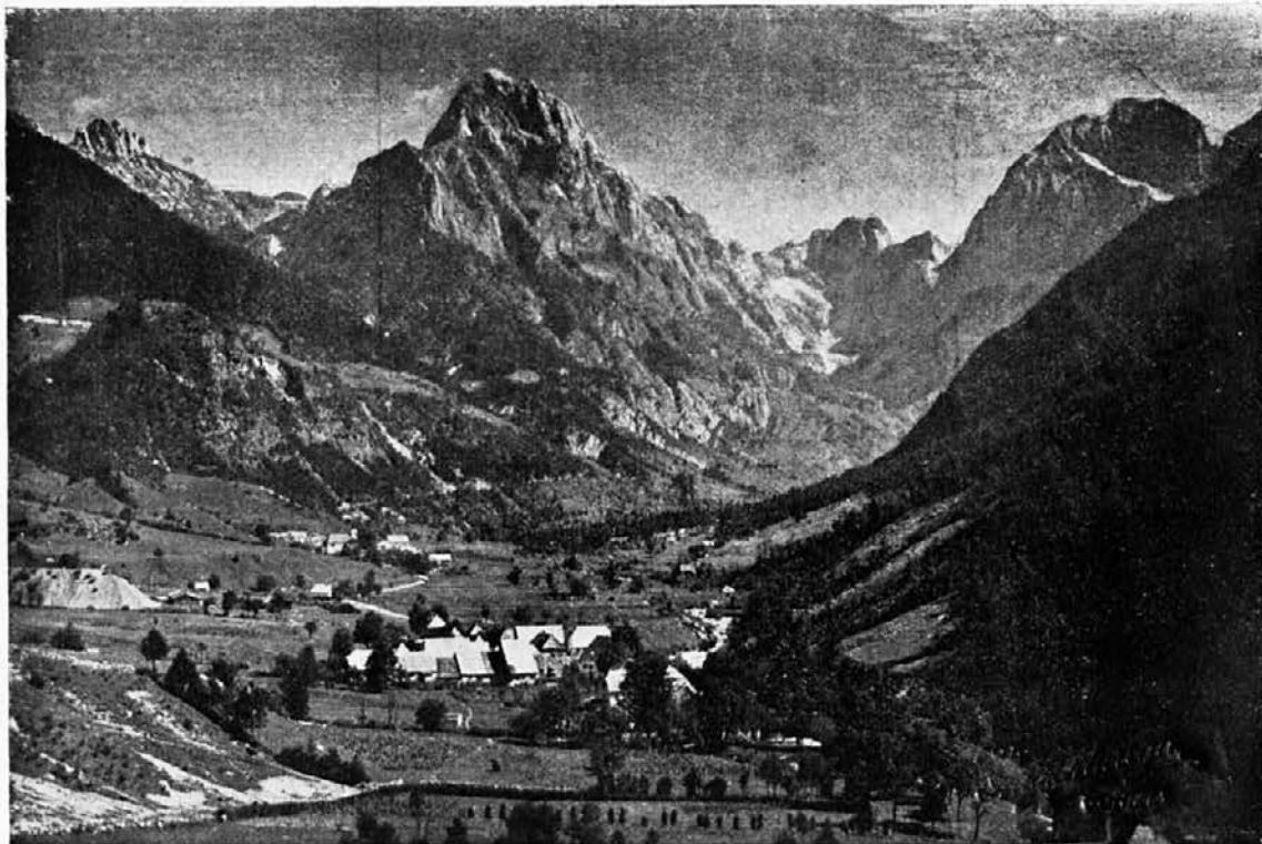
Lepota naših krajev: Mangart in Jalovec, Loška dolina z vasjo. (Fot. Marega, Gorica).

ljudsko gibanje širokih slojev, toliko vaških kolikor mestnih, in to še v večji meri kot je postal sport drugod po svetu.