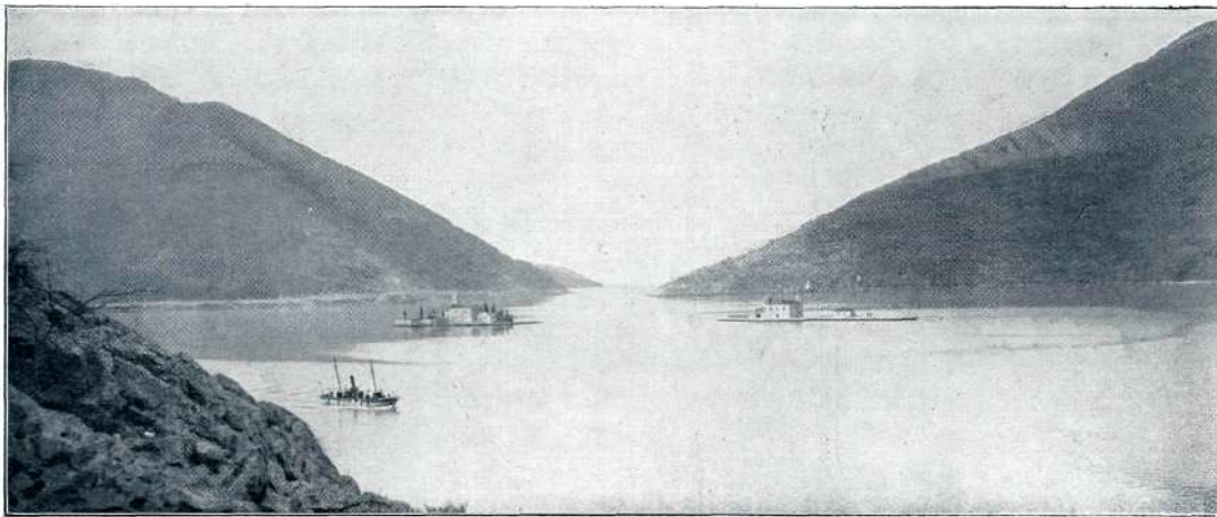
V KOTORSKEM ZALIVU.