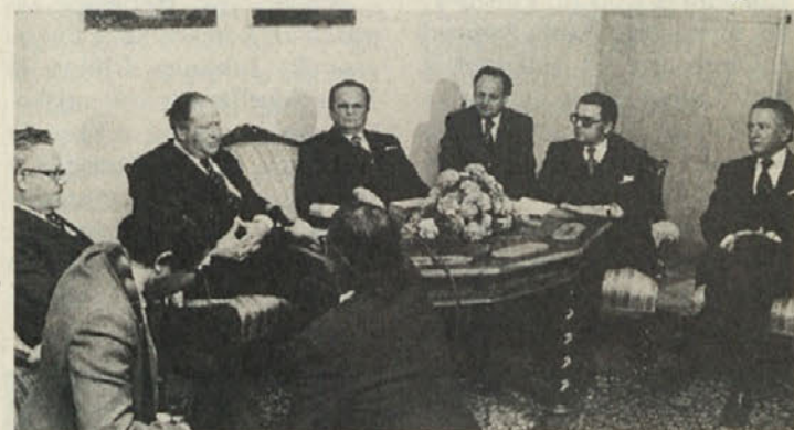
Dr. Bruno Kreisky na razgovoru o manjšinskih vprašanjih z jugoslovanskim predsednikom Josipom Brozom Titom

Bruno Kreisky je bil prav gotovo kancler, ki je drugi republik dal svoj nezamenljiv pečat. »Era Kreisky« je pomenila velike spremembe v avstrijskem družbenem življenju, v svetu pa je stalo njegovo ime za posredovanje v kriznih žariščih.