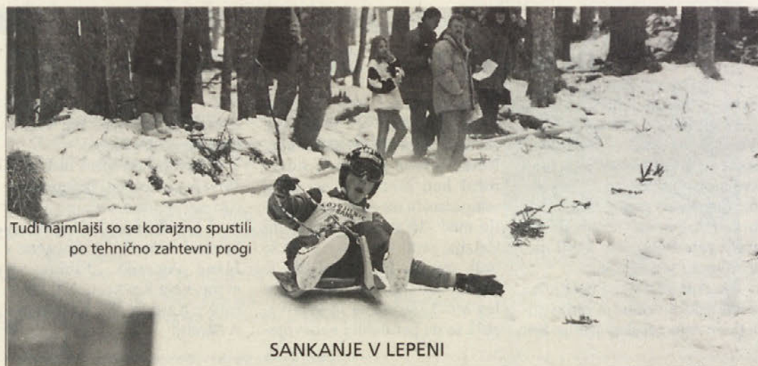
Tudi najmlajši so se korajžno spustili po tehnično zahtevni progi