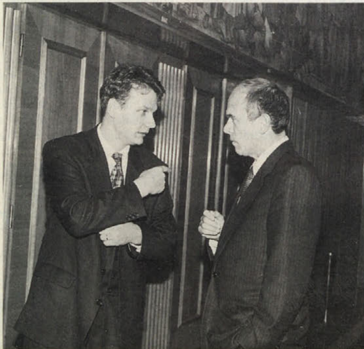
Mandatar Janez Drnovšek (desno) s predsednikom Slovenske ljudske stranke, stranke zamujenih priložnosti, Marjanom Podobnikom

Pretrsla nas je vest, da je v svojem 76. letu, v torek, 28. januarja 1997, na posledicah prometne nesreče nepričakovano umrla