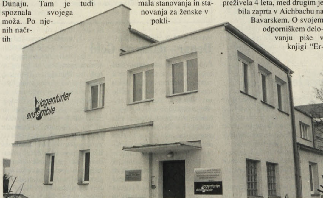
Ljudska hiša - sedež dež. vodstva KP, gledališča »Klagenfurter ensemble« in drugih organizacij