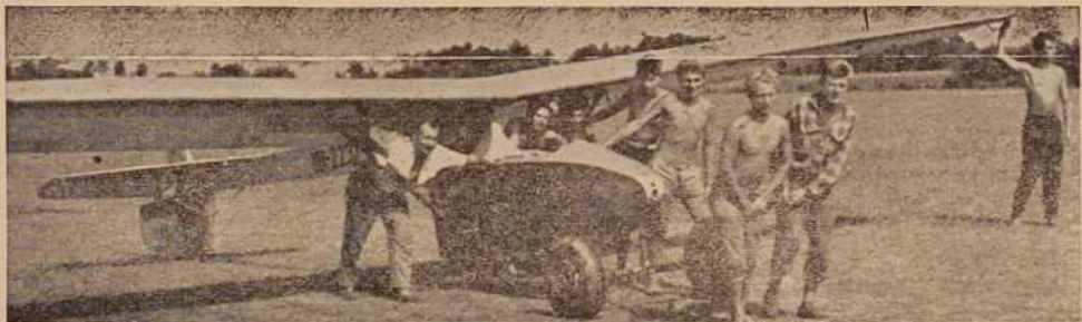
Priznave pred startom...