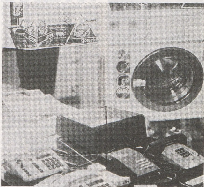
Osrednji del inteligentnega doma v povezavi z nekaterimi gospodinjskimi aparati na demonstraciji 5. in 6. septembra v Gorenju Raziskave in razvoj.