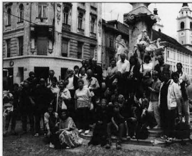
Skupina udeležencev pred znamenitim Robbovim vodnjakom na Starem trgu pred Mestno hišo v Ljubljani

Po kosilu so se podali na Kongresni trg, se ustavili pred NUK-om, si ogledali Križanke, se zadržali v Ljubljani, če bi morda ugledali ošabno Urško ali urnega Povodnega moža, in pripešali do Trga republike, kjer jih je čakal avtobus. Na njem so potem veselo papevali nekatere pesmi iz slovenske ljudske zakladnice z zabavnimi refreni. Ob povratku jim je preostalo še nekaj časa, da so pred mrakom lahko občudovali znamenitosti Rakovega Škocjana z njegovim čudovitim naravnim mostom.