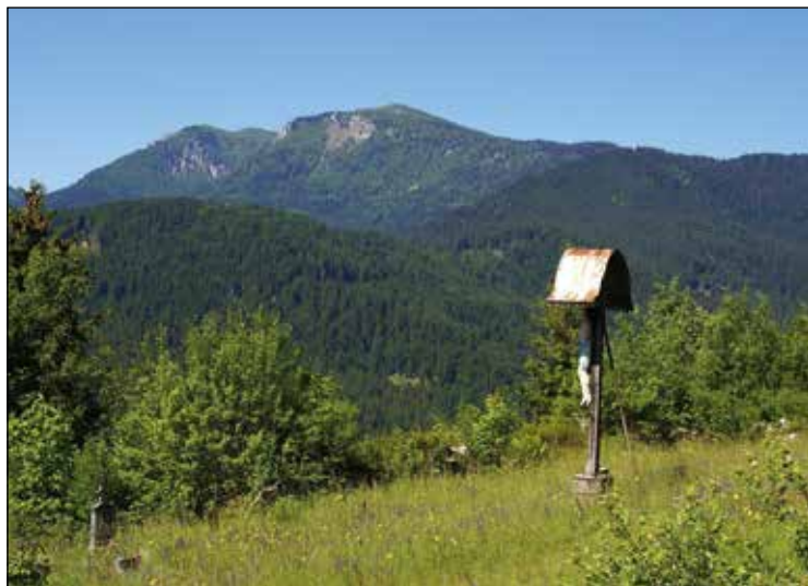
Ratitovec s starega dražgoškega pokopališča.

Prestop iz dražgoške šole v osnovno šolo v Železnike se mi niti ni zdel tako težak. Sestra Lucija je hodila malo pred mano in je bilo zato malo lažje, včasih mi je kakšno stvar tudi pomagala. V sedmem in osmem razredu, se mi zdi, se je bilo treba malo bolj učiti.