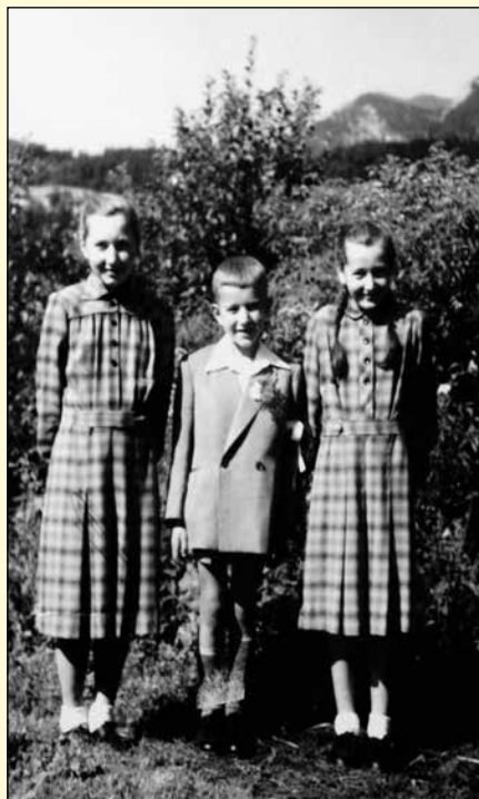
Spomin na prvo sv. obhajilo.

Veliko nas je bilo, pa nikoli ni bilo nobenega "dre-na". Še potem ko smo bili zdoma, smo se radi vračali domov za konec tedna in še vedno se. Je ena rekla, da tako samo mama naredi, da se družina skupaj drži. Ne spomnim se, da bi se kdaj med seboj kregali.