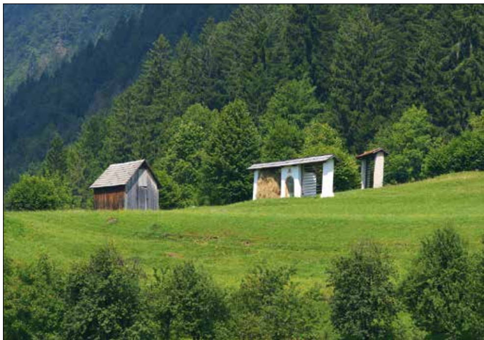
Znamenje v kozolcu.

Kaj sem se v življenju naučil ali kaj me je življenje v mojih šestdesetih letih naučilo? Rekel bi takole: precej je ljudi, ki jih spoštuješ. Po eni strani jih spoštuješ kot ljudi, po drugi strani kot strokovnjake. Vsak človek zase je osebnost. Tudi če hočeš nekoga posnemati, saj ga lahko, lahko se tudi zgleduješ po njem. Mislim, da človek vsepovsod poskuša pobrati dobre stvari. V stroki so lahko odnosi konfliktni ali pa tudi ne, zdi se mi, da če človek prehitro odreagira, to ni dobro. Bolje je malo počakati in malo premisliti. Vem, tudi sam nimam vedno prav, pa najbrž tudi drugi nimajo. Človek se uči tudi iz lastnih izkušenj. Že sam pri sebi vidiš, da včasih nisi bil dovolj vztrajen, da nisi tako odreagirajal, ampak da si prav mislil. Ne vem. Z ljudmi si vsak dan v stiku in če si tak človek, bi se lahko kar naprej kregal, če pa nisi, se pa ne.