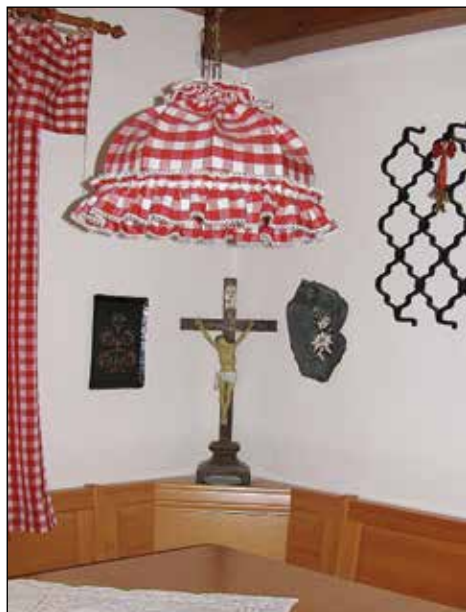
Bohkov kot v Francetovi hiši v Dražgošah.