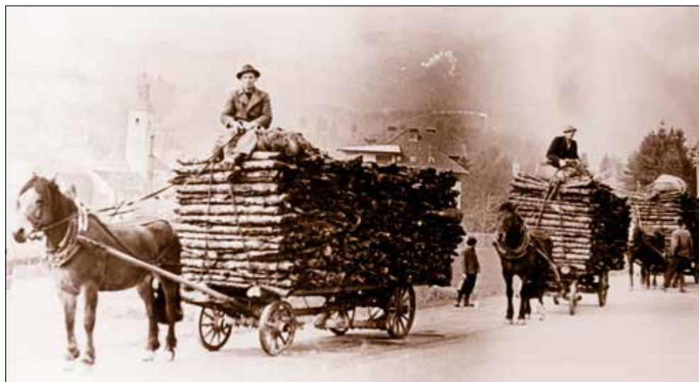
Furmani v Škofji Loki. Fotografija prikazuje prevoz smrekovega lubja iz Selške doline v Demšarjev obrat za proizvodnjo čreslovine na Trati. Vozniki in konji so z Rudna.