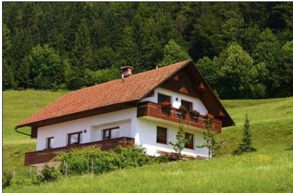
Novi dom v Dražgošah.

Odklop od službe, meja med službo in privatnim življenjem? Zelo rad pridem v Dražgoše, pa tudi če samo za eno uro. Sploh pozimi, se mi zdi, ko zadimam ta sveži zrak. Včasih tudi kaj postorim pri hiši.