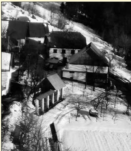
Pri Hkaušč v Dražgošah.

Ko smo imeli veliko sena, smo pustili najmlajša Jožeta in Bernardko doma, ker še nista mogla grabiti, lahko sta pa pomivala posodo. No, bolj sta pomočila kot pomila! Otroci se ne znajo paziti. Imeli smo dvanajst krav in konja, prašiče in ovce. Spomnim se, da so se pozimi ovce vedno drle. Na njivah smo imeli krompir, peso, pa njivo korenja, dve njivi repe. To je bilo treba vse opleti. Njive so od hiše sem, Zadnja njiva, Prebernica, Pod klancem, pod šolo so Sela.