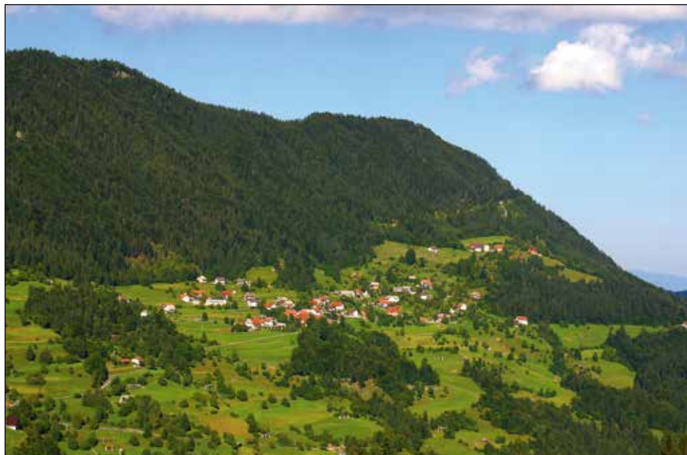
Dražgoše iz Novakov.

Francelj je bil kar živahen fant. Pri hlevu je bila postavljena lestev, ne vem, koliko je bil star, splezal je na vrh. Mama je rekla: "Jaz sem bila samo tiho spodaj pod lestvijo, tako me je bilo strah, da ne bi dol padel."