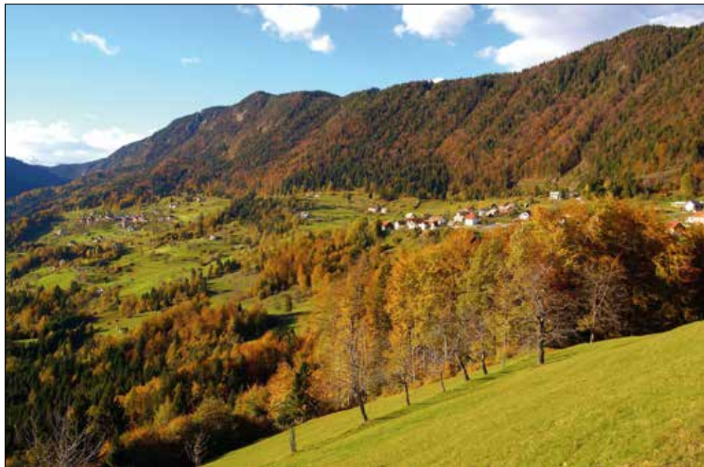
Dražgoše v jesenskem žaru.

Še vedno grem enkrat na teden domov in še vedno imam vse v lepem spominu. Po mojem zato, ker sem odšel zdoma, ko sem imel 14 let. Sedaj izgleda vse to bolj idilično, kot je bilo zares.