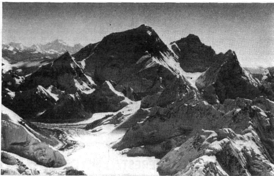
Pogled na Everest in Lotse s Čo Oja, kot smo ju videli lansko jesen