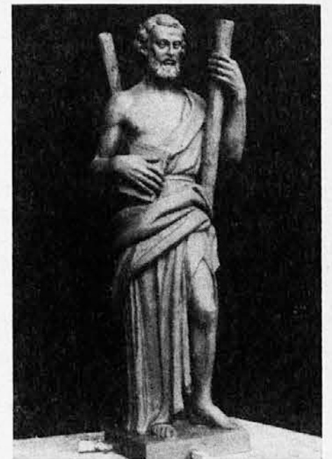
Novi kip sv. Andreja na pročelju cerkve v Standrežu

Preteklo nedeljo pred slovesno mašo je škofov vikar O. Simič v spremstvu štirih duhovnikov blagoslovil novi kip. Na trgu je blagoslovu prisostvovala množica vernikov, oba cerkvena zbora, mladinski in mešani pa sta v čast sv. Andreju zapela pesem. Temu je sledila v cerkvi slovesna maša. Prav bi bilo, da bi nas sv. Andrej v prihodnje vsako leto na svoj shod videl zbrane v tako lepem številu.