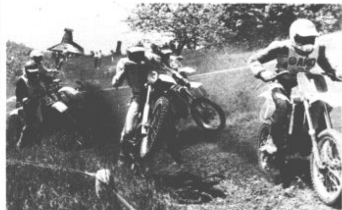
Pa vendarle je bilo tudi razburljivo

Skratka, nedeljska turistična prireditev na Trebeliškem je uspela in če so se vsi ljubitelji moto-crossa, pa iger na srečo varno vrnilo domov, pa če je bil izkupiček tak, kot si ga je organizator želel, potem smo gotovo lahko vsi zadovoljni.