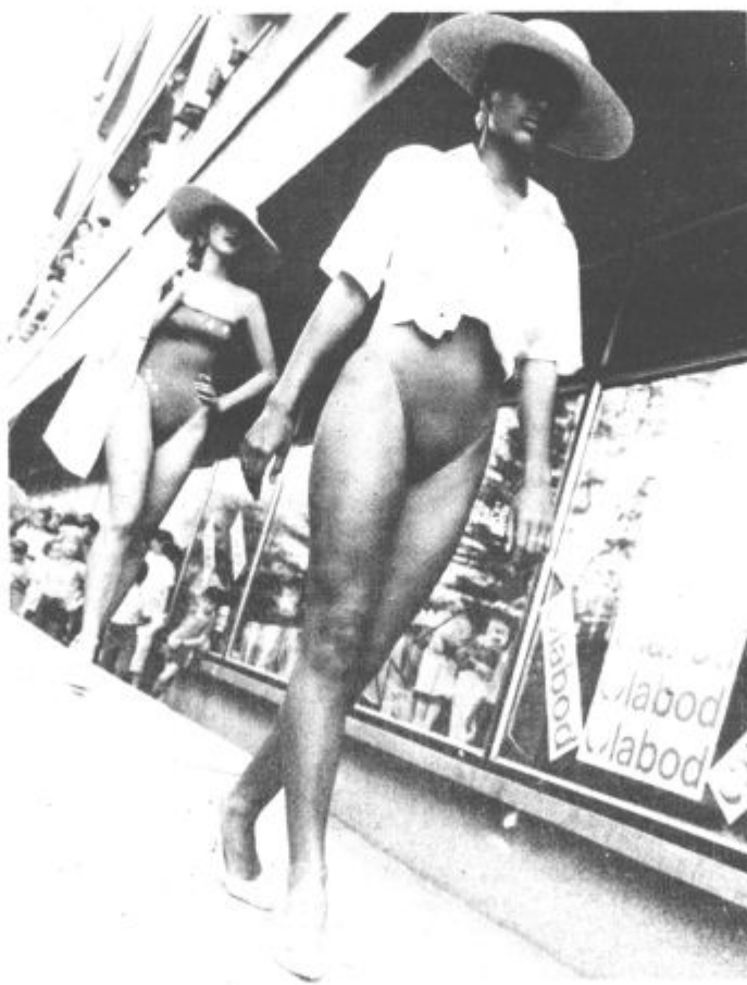
Vse kar so nosile manekene in maneken je mogoče kupiti v Erinih trgovinah

Med modno revijo pred blagovnico Center so izžrebali nagradne križanke prvomajске nagradne križanke Našega časa in Ere. (mz)