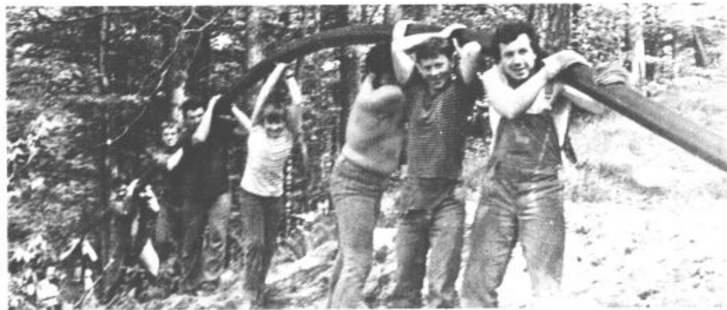
Med prvomajskimi prazniki je na trasi kar mrgolelo pridnih udarnikov

Ob koncu naj zapišemo, da so se po svojih močeh vključili v uresničevanje te zahtevne naloge krajevni skupnosti Šmartno ob Paki in Gorenje, pomoči pa se nadejajo še od krajevne skupnosti Mozirje, kjer poteka kar dve tretjini vodovodnih poti.