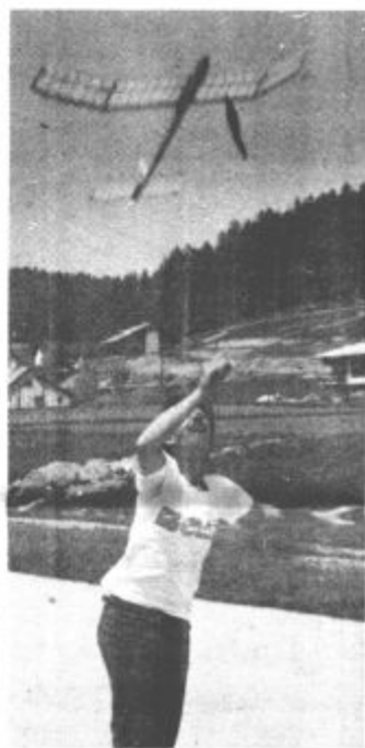
Na letališču v Lajšah so mladi modelarji pokazali veliko znanja in spretnosti

Republiško tekmovanje mladih tehnikov pa bo letos v Celju, in sicer 30. in 31. maja. Mugerle