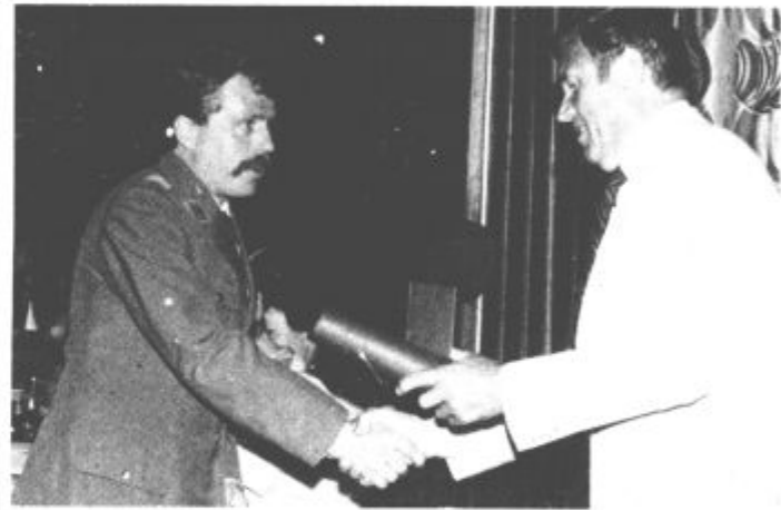
Med podelitvijo priznanj