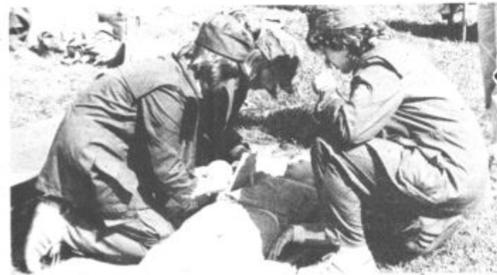
»Poškodovanci« so bili letos še bolj oskrbovani kot preteklo leto