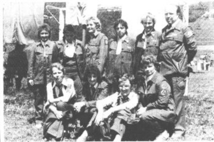
Zmagovalna ekipa šoštanskih termoelektrarn, ki se je uvrstila še na republiško tekmovanje

Pri združenih odredih pa je zmagala druga ekipa pred prvo.